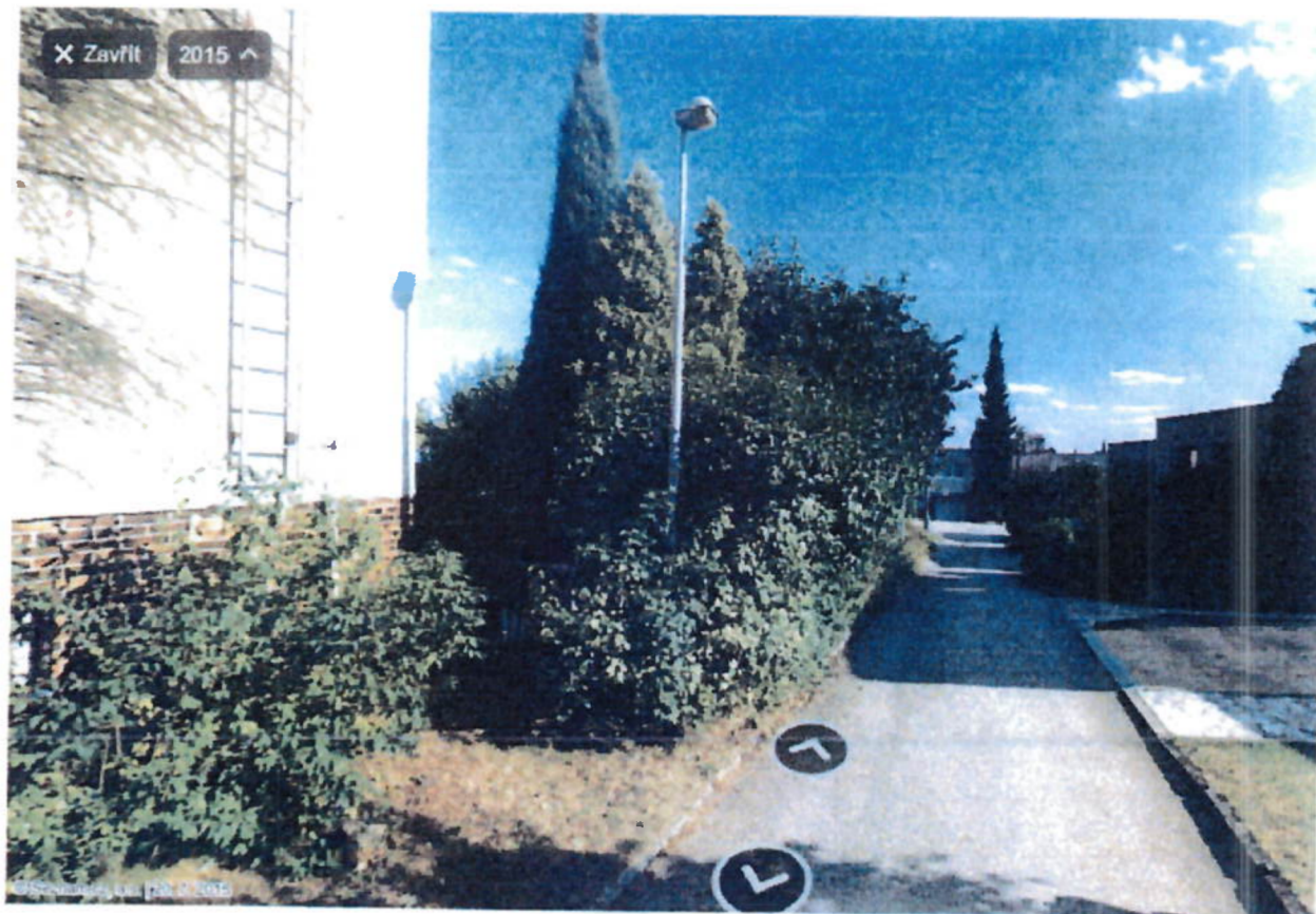
Panorama – vstup do zahrady – Mapy.cz 2019