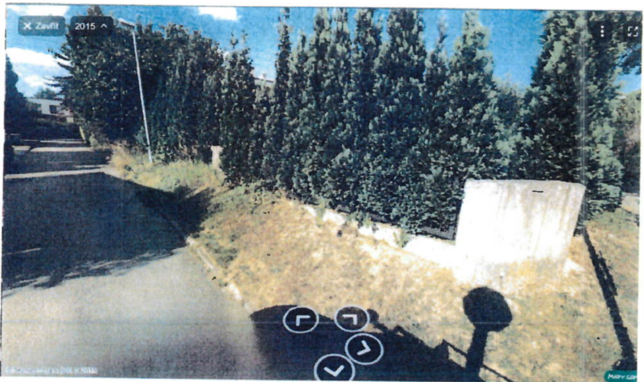
Panorama – zahrada od ulice Oty Pavla – mapy.cz 2019