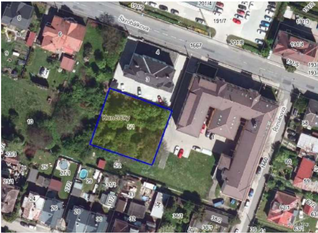
Výřez z katastrální situace.