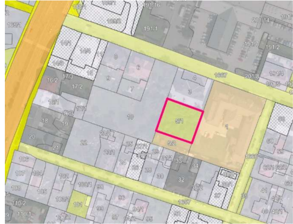
Výřez z majetkové mapy.

Vyjádření se týká žádosti o prodej v k. ú. Kunčičky, obec Ostrava, a to pozemku s parc. č. 5/1 ve vlastnictví statutárního města Ostrava svěřeného městskému obvodu Slezská Ostrava za účelem budoucí výstavby.