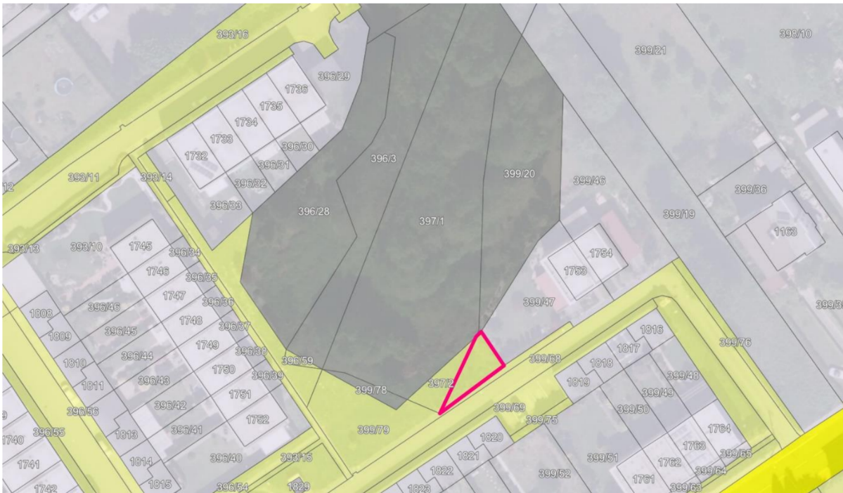
Výřez z katastrální mapy se zákresem předmětu žádosti

Vyjádření se týká žádosti o prodej v k.ú. Heřmanice, obec Ostrava, a to části pozemku s parc. č. 399/79 ve vlastnictví Statutární město Ostrava, Prokešovo náměstí 1803/8, Moravská Ostrava, 70200 Ostrava, svěřeno městskému obvodu Slezská Ostrava, za účelem rozšíření zahrady.