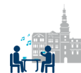
Oživit historické centrum města