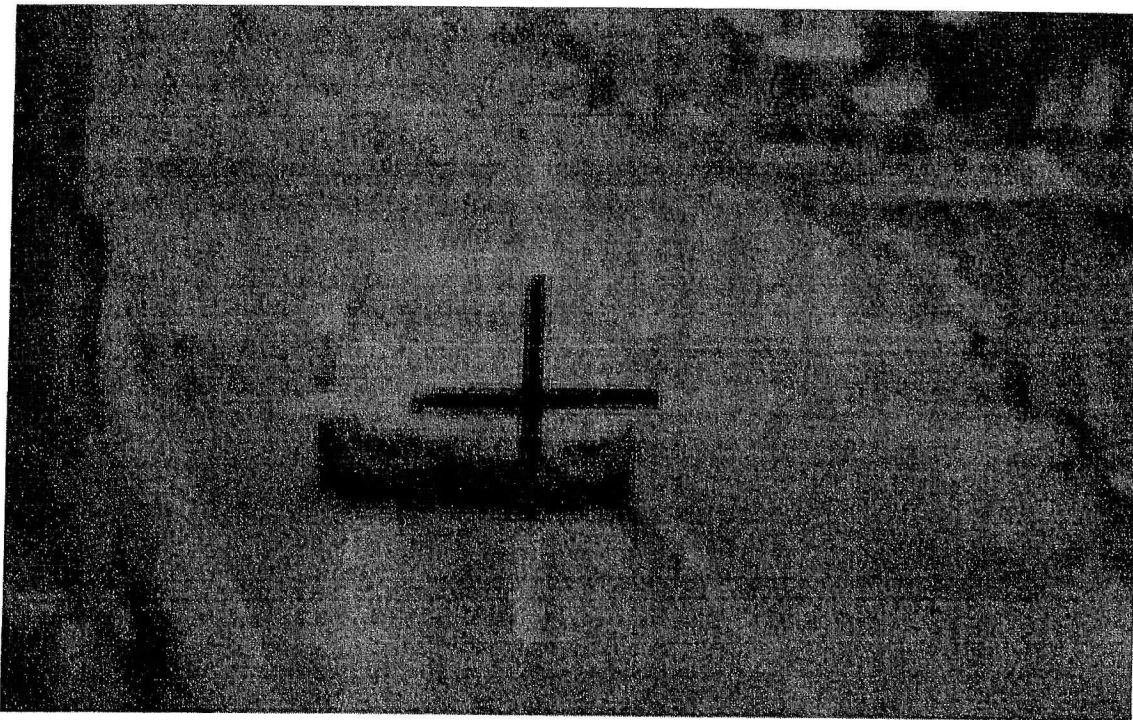
Zdroj: Oznámení podezření ze spáchání přestupku - dokumentace

Obviněný rozporuje správnost měření rychloměrem TruCam, neboť záměrný kříž leží na vozidle jen z části, jak je patrné z níže uvedené fotografie. V takovém případě je samozřejmě možné, že byla rychlost vozidla změřena správně, přestože záměrný kříž leží částečně na vozovce. Ovšem v případě, kdy záměrný kříž leží na vozidle pouze z části, je nutno považovat takovéto měření za měření, během něhož nebyl dodržen postup obsluhy lidarového rychloměru a jako takové nelze toto měření použít jako důkaz proti obviněnému.