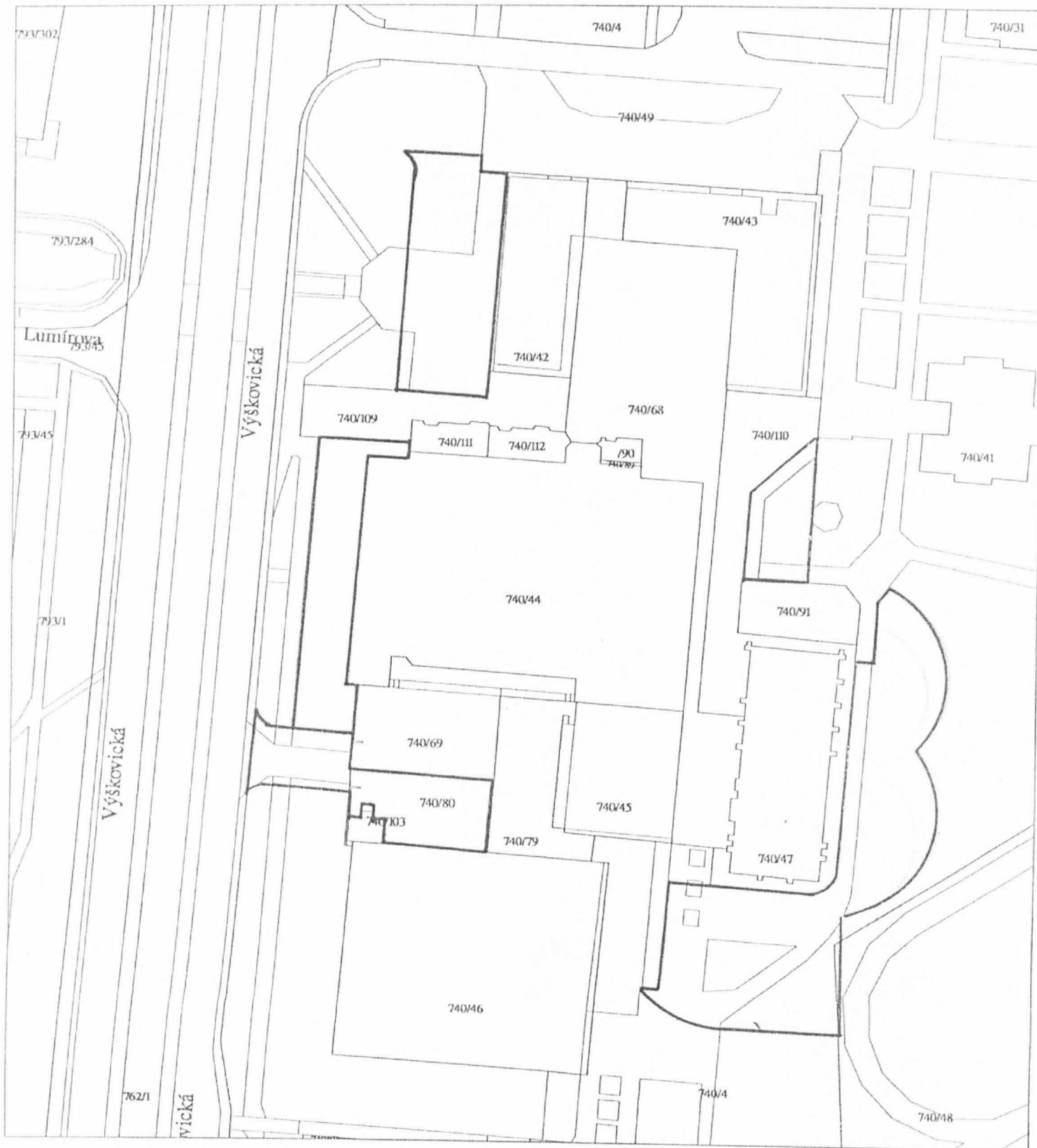
Katastrální území: Výškovice u Ostravy

Soubor parcel vyištěn 6.1.2009 07:15 na počítači HP 9000 J282, software ARC/INFO.