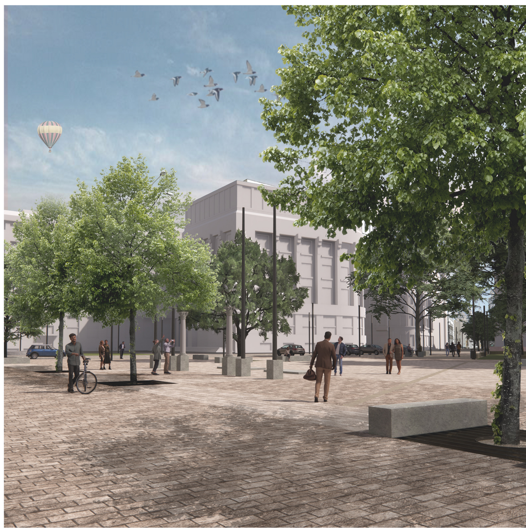
Koncepce komerčního místa po německém domě má význam pro smíření v prostřanství. Benešove dekrety spolu se složitou situací vytvořili mnohonásledných událostí. Místo připomíná pitoreskní sloupořadí původního odmu - sloup jako prvek stálosti nebo taky jenom formy. V řešeném území je kladen důraz na kvalitní materiály.