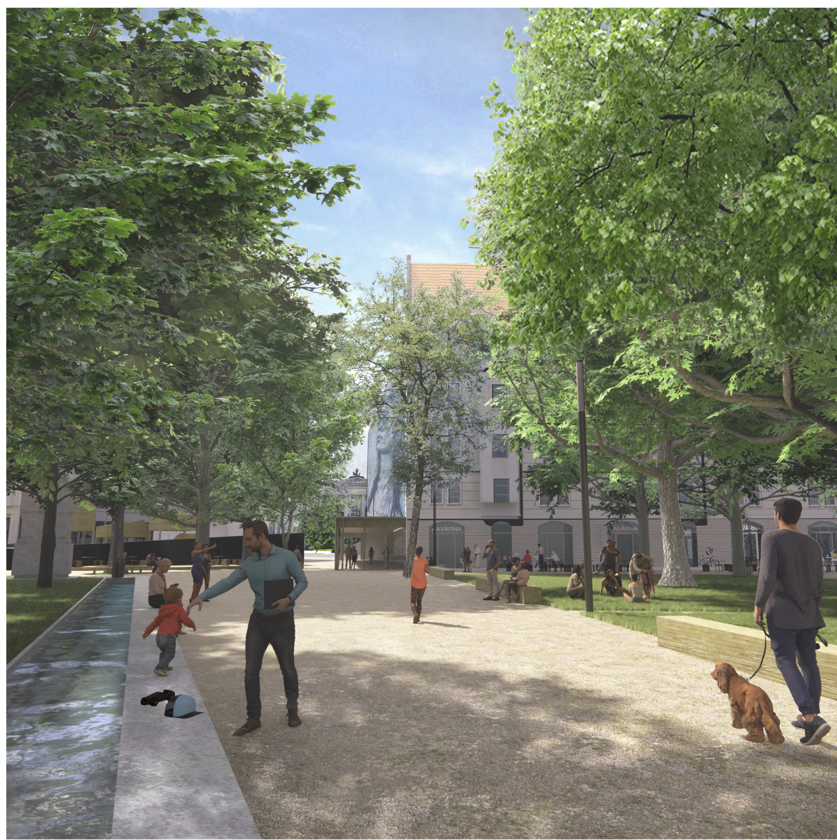
Parková část prostřanství pomáhá osvězení prostřanství i jako funkční prvek zelenomódré infrastruktury, kdy zachytává deštové přehánky a svádí je ke korenům stromů. Zároveň je však využít rezervoár pro závlahu z přebytků vody. Místo doplňuje vodní prvek pro zvýšení vlhkostia příjemnosti i jako připomínka náhonu. Vodní prvek také pomáhá schovat a odclonit parkoviště a následně propojit prostřanství.