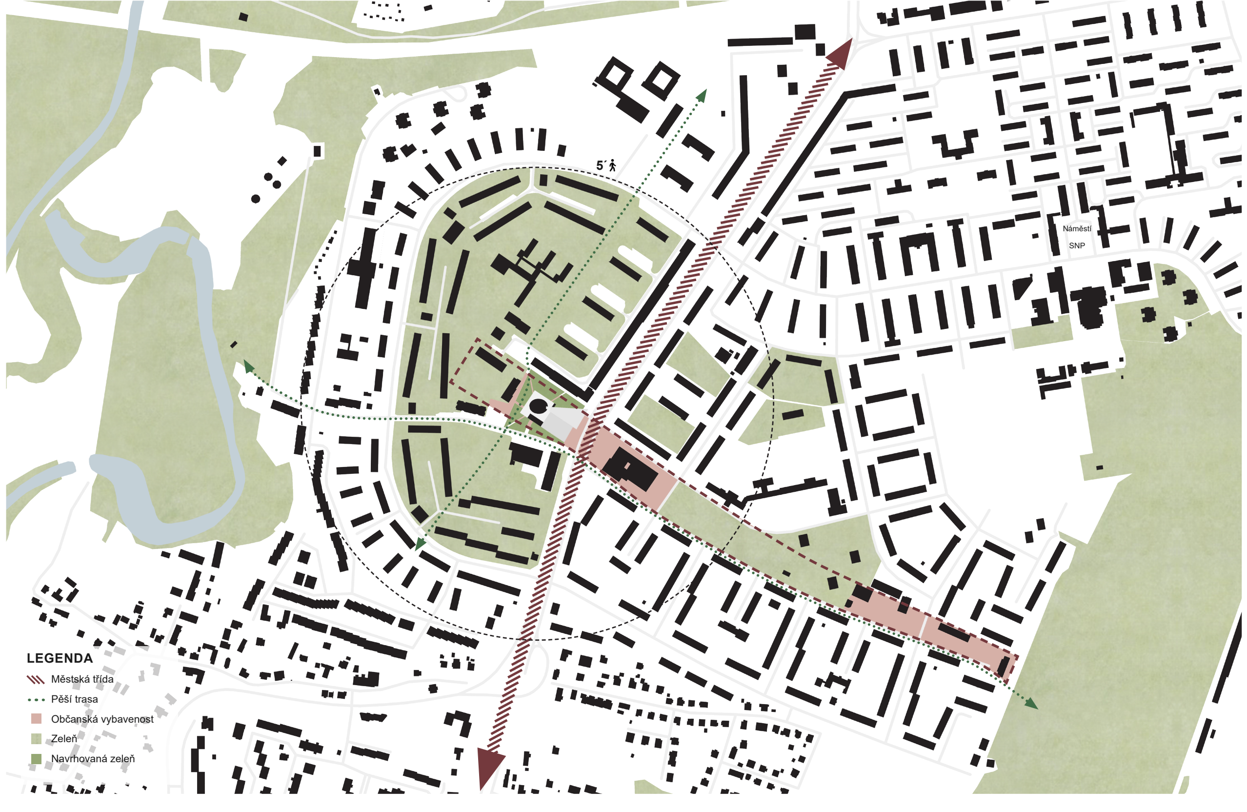
SCHÉMATA VYUŽITÍ VEŘEJNÉHO PROSTRANSTVÍ