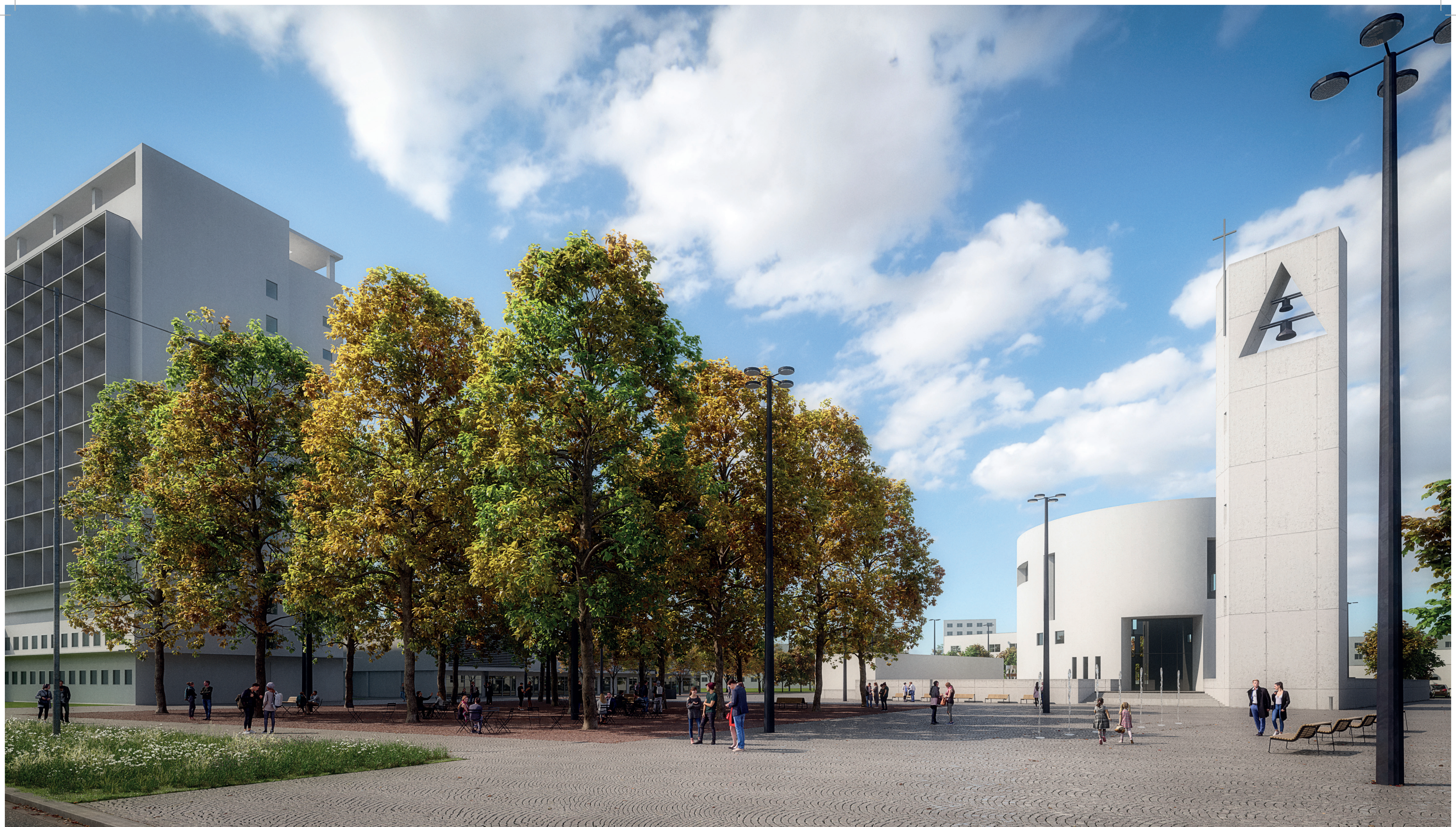
↗ perspektivní pohled od ulice Výchkovická ↘ situace, 1:500