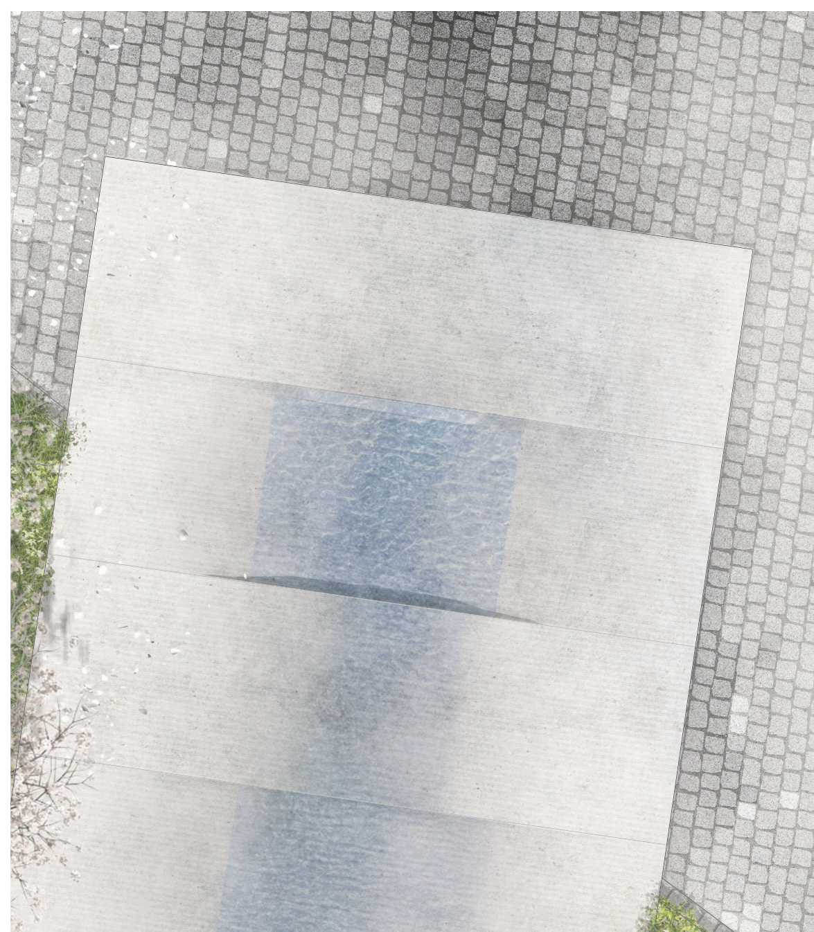
SITUCE ŠIRŠÍCH VZTAHŮ