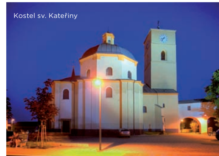
Kostel sv. Kateřiny

✉ Lidická 1, 742 83 Klimkovice 📍 49°47'10.83"N, 18°7'49.18"E 🕒 celoročně (čt, so)