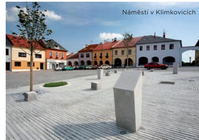
Náměstí v Klimkovicích

A HISTORICKÉ JÁDRO MĚSTA tvoří čtvercové náměstí, na jehož jižní straně se zachovalo u 14 domů historicky cenné podlažní. V centru náměstí uvidíte zrestaurovanou sochu sv. Šebestiána z roku 1760.