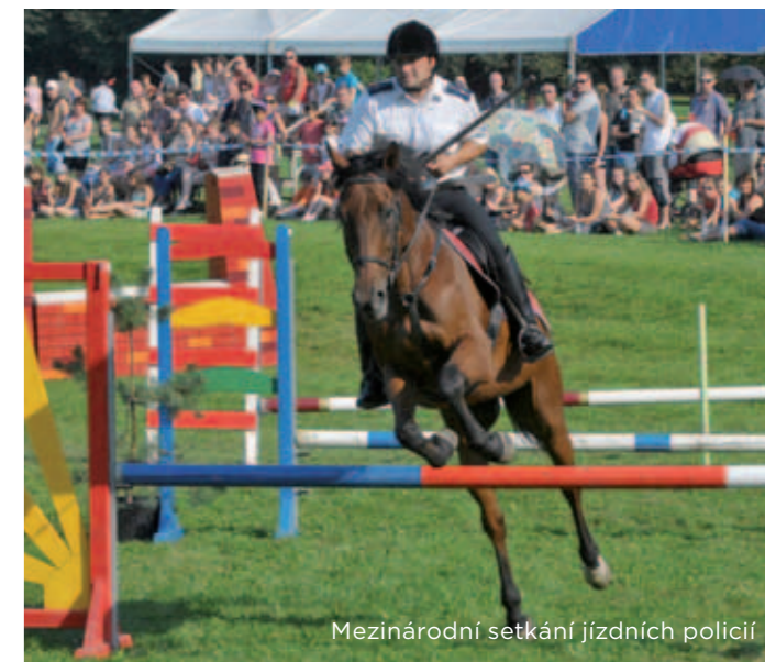
Mezinárodní setkání jízdních policí

Zástupci jízdních policí z celé České republiky i ze zahraničí se každoročně setkávají v Ostravě, aby předvedli své jezdecké dovednosti. Veřejnost má tak možnost seznámit se blíže s prací strážníků a policistů na koních. Parkurové skákání, zrcadlové skákání a policejní parkur, přitahují každoročně stovky diváků.