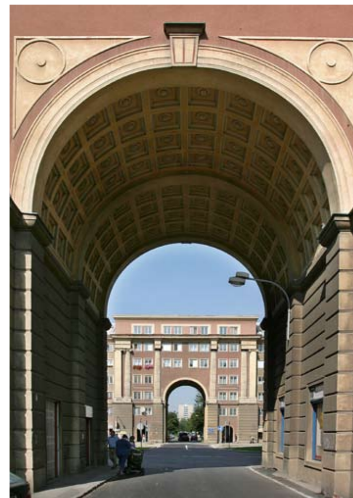
Typická architektura 50. let minulého století

Oblast kultury zahrnuje též architekturu. I přes bývalý průmyslový charakter si město uchovává klenoty architektury počátku 20. století, díla věhlasných architektů jakými byli Sitte, Gočár, Deininger a další. Také funkcionalistické stavby tohoto období patří dnes k památkově chráněným.