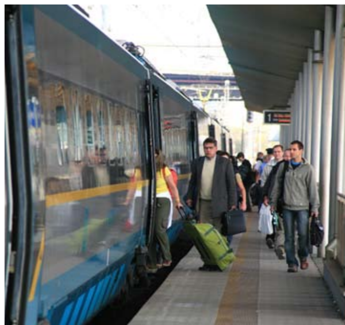
Moderní nádraží v Ostravě-Svinově

Desítky soukromých firem a společností pracujících na moderních projektech a výzkumu dnes sídlí ve vyhledávaných průmyslových zónách a vědecko-technickém parku. Město samotné přijalo tzv. Integrovaný plán rozvoje, jehož jednotlivé etapy obohatí tuto metropoli o další nové aktivity a v neposlední řadě přispějí k estetizaci města.