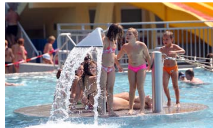
Koupaliště a krytý bazén Vodní svět SAREZA

Jméno Ostrava znají sportovní příznivci po celém světě. Televizní přenosy ze světových šampionátů v hokeji, atletice juniorů, volejbalu, florbalu, futsalu, z tradičního mezinárodního atletického mítinku Zlatá tretra, tenisových turnajů nebo zápasů Davisova poháru proslavily Ostravu jako město sportu. Nesmírně populární je také klub FC Baník Ostrava. Fanoušci fotbalu se mohou těšit na zbrusu nový, moderní stadion, jehož výstavba se připravuje. Vysokou mezinárodní úroveň mají sportovní letiště a golfová hřiště, která svou kvalitou a poskytovanými službami přitahují i cizince. Blízkost pohoří Beskyd a Jeseníků dává šanci na kvalitní vyžití v zimních sportech. Lidé, pro které je sport koníčkem, říkají, že moravskoslezská metropole v centru Evropy se širokou škálou klubů a sportovišť nabízí vyžití snad ve všech sportovních disciplínách.