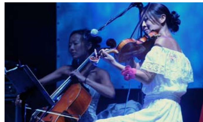
Multižánrový festival Colours of Ostrava

Ostrava nikdy nebyla popelkou v oblasti kultury. Značná migrace pracovníků v 19. a 20. století, kdy se město rychle rozšiřovalo a díky průmyslu rostlo, představovala také příliv nových kultur. Pět stálých divadelních scén vysoké úrovně, desítky galerií a klubů, kina, muzea na velké technické i tématické úrovni, knihovny a další zařízení nabízejí denně tolik pozoruhodných událostí, že je milovník umění a kultury těžko může obsáhnout. Ostrava je též městem festivalů, většinou mezinárodní úrovně. Skvělý hudební festival Janáčkův máj, Ostravské dny nové hudby, Janáčkovy Hukvaldy, Svatováclavský festival, Letní shakespearovské slavnosti, další divadelní festivaly, včetně mezinárodního klání loutkových divadel Spectaculo Interesse, folklorní festivaly a jiné významné akce jsou pestrou každodenní nabídkou, bez které si obyvatelé své město neumějí představit. Z Ostravy už více než půlstoletí vysílají regionální studia Českého rozhlasu a České televize.