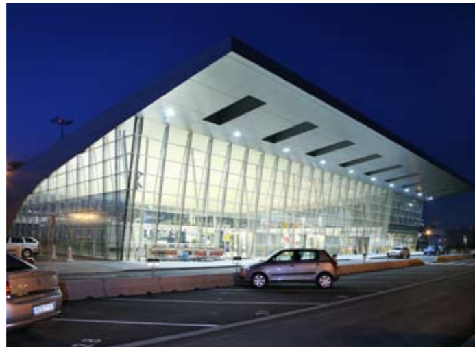
Letiště Leoše Janáčka Ostrava

Významnou hodnotu každé lokality představuje doprava. Ostrava má dobře fungující systém městské a příměstské dopravy, je důležitým železničním uzlem ve střední Evropě a disponuje rovněž kvalitním mezinárodním letištěm, které nese jméno světoznámého hudebního skladatele a místního rodáka Leoše Janáčka.