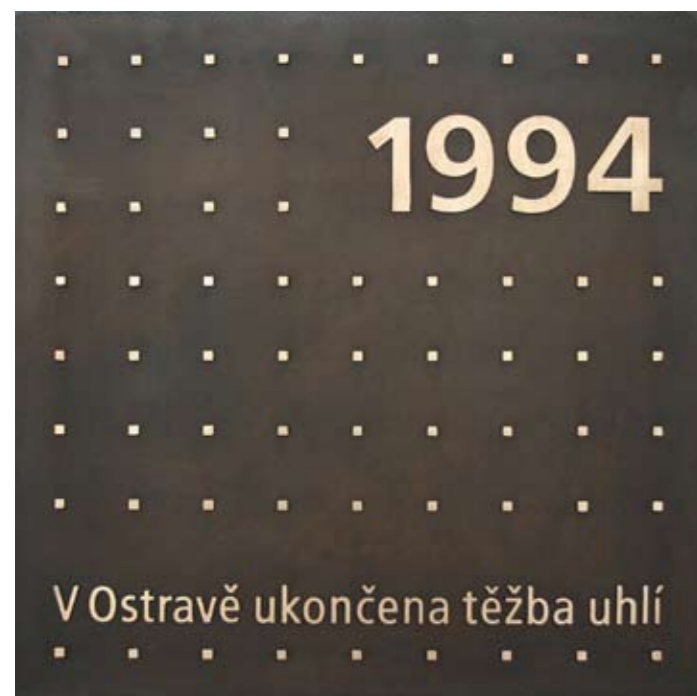
Pamětní deska na Masarykově náměstí připomíná historii těžby uhlí od roku 1787

Moravskoslezská metropole Ostrava je třetím největším městem České republiky s přibližně 315 tisíci obyvateli. V posledních dvaceti letech prodělává výraznou změnu – z ryze průmyslového města se mění v centrum moderních technologií, obchodu, kultury a sportu.