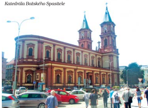
Katedrála Božského Spasitele

Ostrava, která je rozdělena do 23 městských obvodů, je pro mnohé z nás symbolem průmyslu, obchodu, vzdělanosti a především bývalých dolů, kde se ještě donedávna těžilo uhlí a vyrábělo železo. Z dolů jsou vytvořena muzea, kde můžete na vlastní kůži poznat hornické prostředí. Začnu ale po pořádku – jako správný turista – prohlídkou historického jádra. Město Ostrava, to nejsou jen těžní věže, ale především historické Masarykovo náměstí se starou radnicí, kde je mnoho architektonických skvostů, evangelický kostel, obrovská katedrála Božského