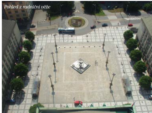
Pohled z radniční věže

ho Spasitele s kapacitou až 4 000 věřících a s unikátním dřevěným kazetovým stropem a kostel sv. Václava z 13. století zasvěcený patronu Čech, svatému Václavovi. My jsme ukončili naši prohlídku před rozsáhlou budovou nové radnice s vyhlídkovou věží vysokou 85,6 metru, ze které je jedinečný panoramatický pohled na celé město plné parků a zeleně. Viděli jsme Slezsko, Beskydy, Poodří i do Polska. Věřte mi, že po prvním dnu obhlídky místních pamětihodností jsem zjistil, že můj odhad, kolik dní je třeba na poznání Ostravy, byl správný.