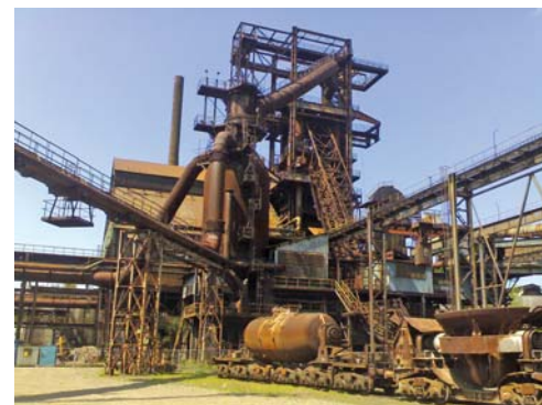
Dolní oblast Vítkovice

Nezapomeňte určitě navštívit DOLNÍ OBLAST VÍTKOVICE , kde byla v roce 1998 – po 170 letech – ukončena činnost výroby surového železa. V roce 2002 byl areál dolu Hlubina, koksovny a vysokých pecí prohlášen za národ-