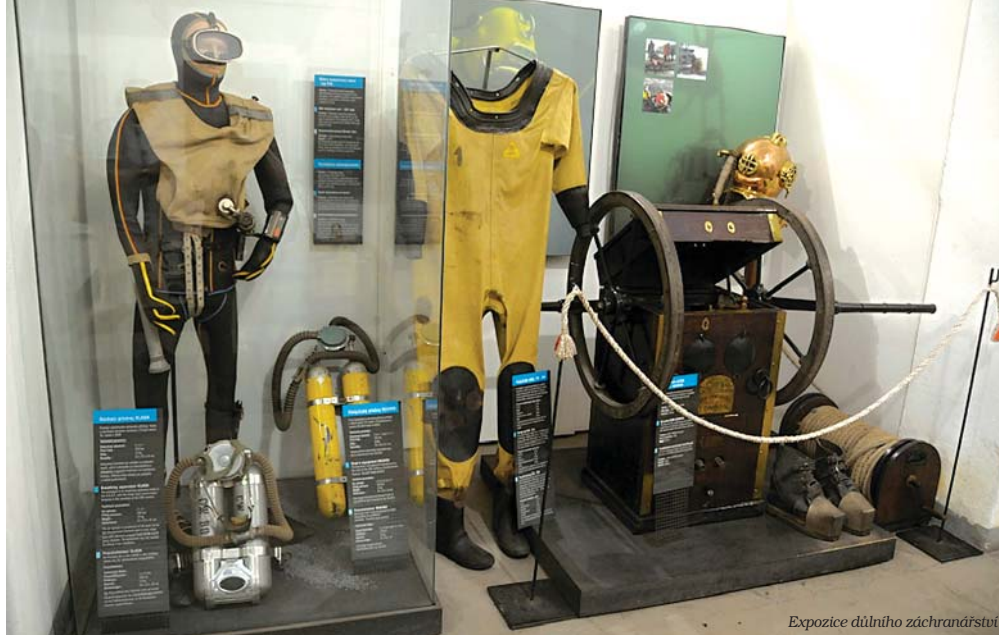
Expozice důlního záchranářství