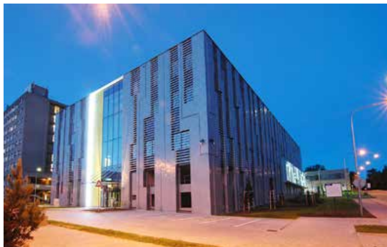
Národní superpočítačové centrum v budově IT4Innovations v Technologické ulici v Ostravě-Porubě.