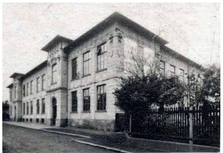
Někdejší obecná škola chlapecká a dívčí v Hlubinské ulici. V současnosti budovu využívá městská policie.