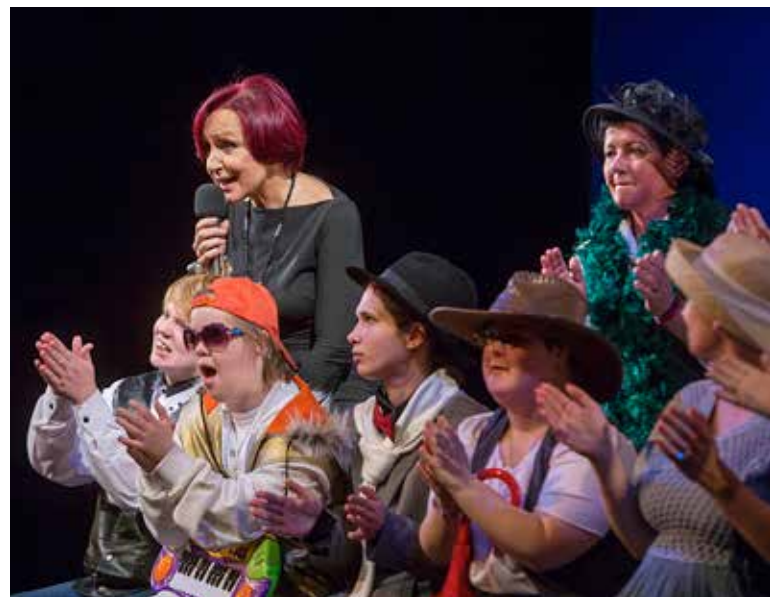
Ostravská Lidová konzervatoř a Múzičká škola je pravidelným spolupořadatelem koncertu Všechny barvy duhy, kde vystupují hendikepovaní z centra Čtyřlístek se známými umělci. Snímek zachycuje loňské vystoupení, kde byla hostem Petra Janů. Letos dětem zazpívá Ewa Farna, koncert se tradičně uskuteční v Divadle A. Dvořáka, a to 29. září v 18 hodin. Akci významně podporuje město Ostrava.

Výchovné a vzdělávací procesy zvolené školou jsou dnes již uznávány a přijímány jako průkopnické a uplatňují se teoreticky i názorně na mezinárodních konferencích a v zahraničních studijních projektech. Ostravská Múzičká škola je dnes jedinečná nejen v Ostravě, ale i v celé ČR. Dále hledá a objevuje potřebné a nové postupy a nabízí k následování to dobré a osvědčené. Informace získáte na www.lko.cz . (ms)