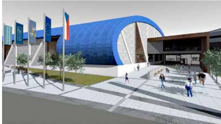
Vizualizace budoucí ostravské atletické haly

ČEZ Arény. Pod střechou budou ovál s šesti drahami v délce 200 metrů, osm přímých 60metrových drah, sektory pro skok do výšky, do dálky, o tyči a vrh koulí. (bk)