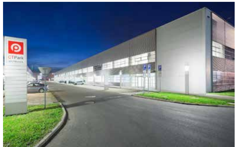
Průmyslová zóna CTPark v Hrabové je už deset let jedním z nejvýznamnějších zaměstnavatelů v Ostravě.

Kromě parku v Hrabové CTP v Ostravě provozuje administrativní komplex IQ u náměstí