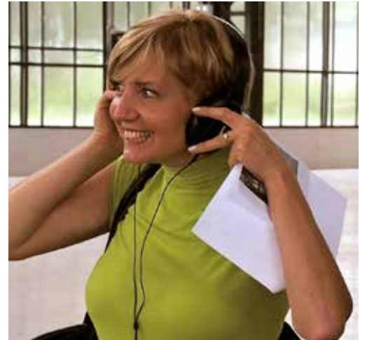
Obří výstavní hala a v ní posluchači neobvyklých zvukových prezentací, taková je současná náplň nového prostoru v Trojhalí na Nové Karolině.