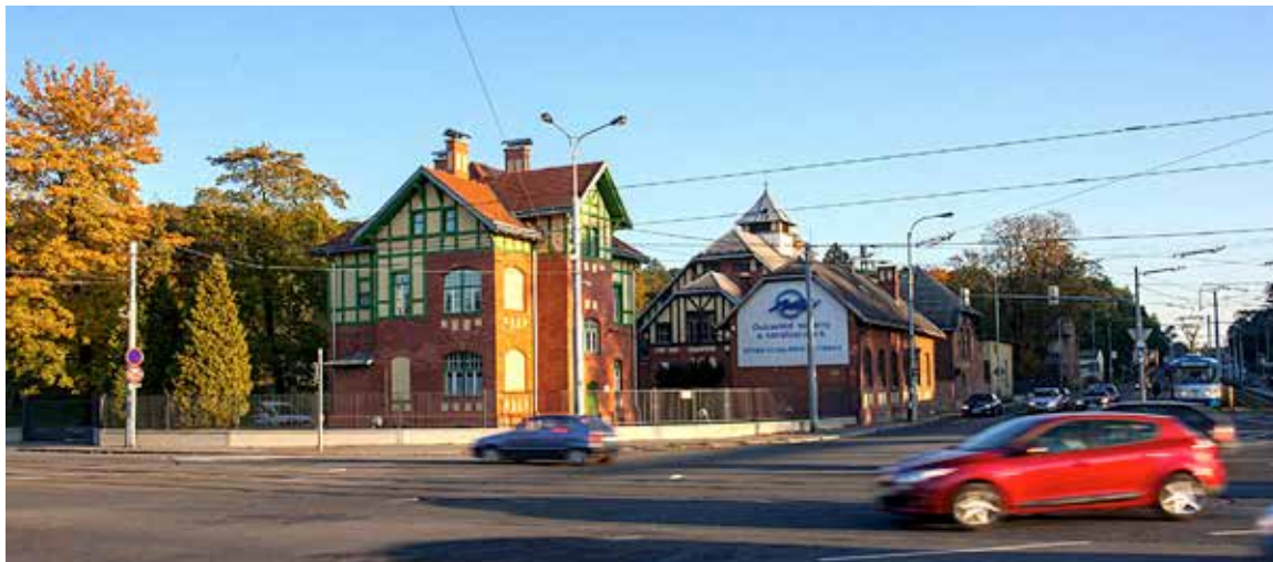
Jedním ze symbolů vodárenství v Ostravě je historická budova vodárny v Nové Vsi z roku 1908

„My vodaři, a jak vyplývá z průzkumu i většina veřejnosti, na to máme jasný názor. Pití kohoutkové vody je výrazně levnější ve srovnání s vodou balenou a neexistuje objektivní důvod, proč by se jí měl člověk obávat. Některé vodárenské společnosti podporují pití kohoutkové vody projekty zaměřenými primárně na majitele restaurací. My jdeme trochu jinou cestou a osvětu šíříme prostřednictvím významných společenských akcí a přímé komunikace se zákazníky. V tomto směru pro nás byla významná účast na letošním ročníku Colours of Ostrava, kdy jsme kromě osvěžení prostřednictvím sprchových bran podávali návštěvníkům chlazenou kohoutkovou vodu z našeho vodobaru. A vypilo se jí neuvěřitelných 9 tisíc litrů, za zhruba 1 haléř za skleničku!“