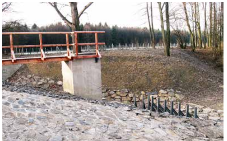
Část hráze suché nádrže v Antošovících

Lesy ČR ve Slezské Ostravě plánují ještě další významné protipovodňové opatření. Zvýšením průtokové kapacity koryta Koblavského potoka se docílí snížení rizika lokálních záplav v Koblavě. Zahájení prací zatím brání komplikace v jednání s vlastníky pozemků, kterých by se úpravy částečně dotkly. (liv)