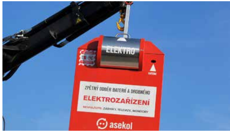
Červené kontejnery jsou určeny pro odložení drobných elektrospotřebičů

Roadshow s názvem Najdi červený kontejner se uskuteční v úterý 23. září od 9 do 17 hodin. Společnost OZO Ostrava vytvoří na Nové Karolině mimořádné sběrné místo s barevnými nádobami na třídění odpadu. A chybět nebude také červený