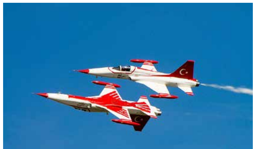
Letecká akrobacie v podání stíhačů letky Turecké hvězdy

Do Mošnova mohou diváci autem, ale také kyvadlovou autobusovou dopravou z Ostravy, vlakem, na kole i pěšky. Vstup je bezplatný. (vi)