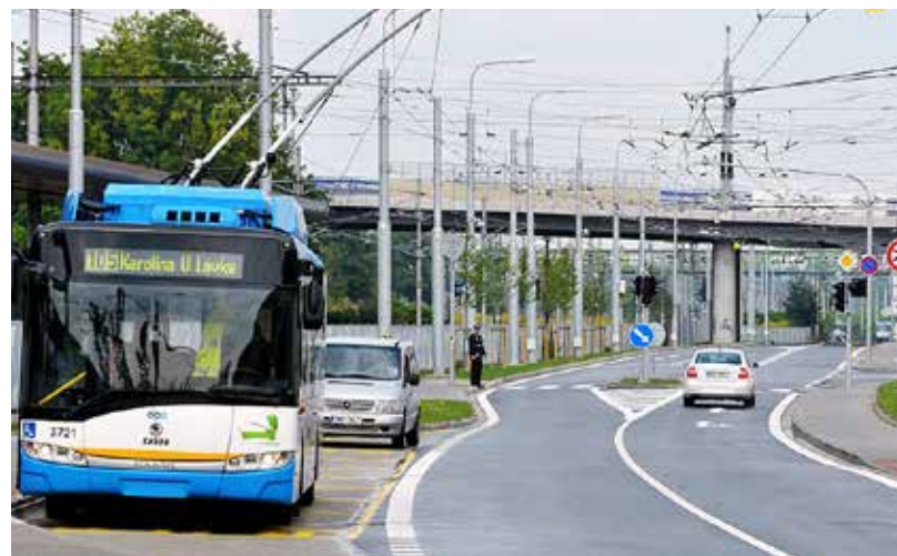
Nová Porážková ulice přivedla automobilovou a trolejbusovou dopravu ke Stodolní ulici, železniční zastávce i na Novou Karolinu.