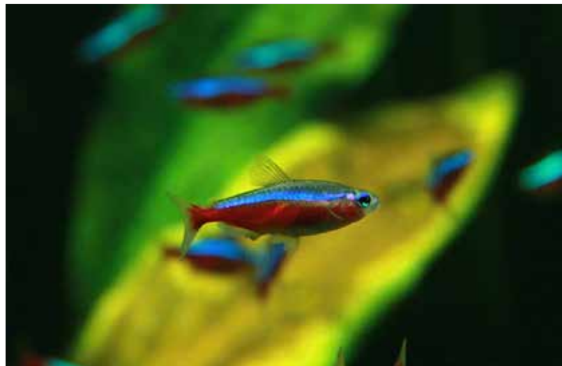
Neonky jsou ozdobami akvárií

Ve výběhu Indie zblízka, který bezprostředně navazuje na terasu nové restaurace Saola, jsou k vidění dvě mláďata samičky axisů indických. Už bývají často vidět venku společně s ostatními členy stáda. Tak jako u většiny zástupců jelenovitých zůstávají totiž mláďata axisů několik dní po narození oddělená od stáda a choulí se v trávě, jejich matky se zdržují opodál a pravidelně je přicházejí nakrmit. Pokud se na mláďata nejpestřeji zbarvených jelenů přijdou návštěvníci podívat nejpozději do konce září, mohou se zapojit do soutěže Putování s nejkačkou a získat hodnotné ceny. Do soutěže je zahrnuto celkem 20 míst v Moravskoslezském kraji, která byla podpořena penězi z EU a která lze v rámci soutěže navštívit. V Zoo Ostrava byl z evropských peněz financován právě projekt výstavby Návštěvníckého centra s restaurací, jehož součástí byla