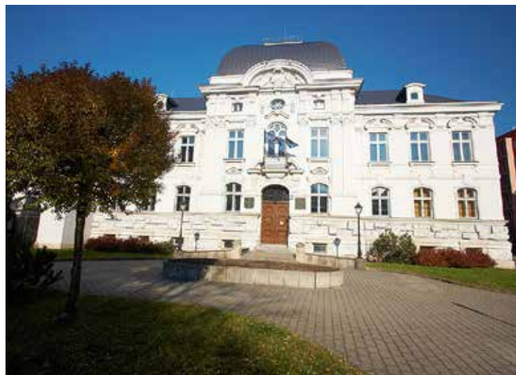
Archiv města Ostravy v Přívoze patří k nejlépe fungujícím organizacím města. Vybaven moderní technikou patří dnes k nevyhledávanějším institucím, které nabízejí cenná fakta z historie.

Na své pomyslné cestě prošel archiv několika nepříliš ideálními lokalitami, než v roce 1960 našel důstojné sídlo v budově bývalé přívozké radnice. Ale až výstavbou nového depotního bloku v roce 1996 byly vytvořeny odpovídající podmínky k trvalému a bezpečnému uložení dokumentů. Na své restaurování a konzervování čeká však stále ještě mnoho cenných archiválií. (d)