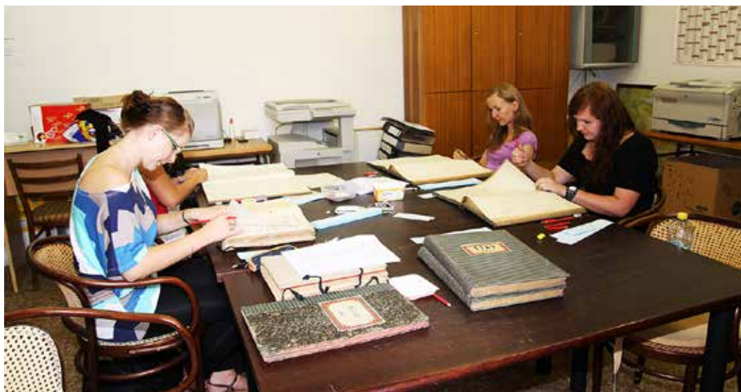
Stránkování úředních knih vybraných k digitalizaci v Archivu města Ostravy

Aby mohl archiv v této věci učinit skutečně významný pokrok, bylo rozhodnuto ucházet se o přidělení finančních prostředků z Integrovaného operačního programu „Zajištění přenosu dat a informací v územní samosprávě“, v rámci aktivity „Digitalizace archivů a problematika správy dokumentů“. Projekt byl nazván „Digitalizace Archivu města Ostravy“ a jeho realizační fáze, která se blíží ke svému závěru, byla zahájena v srpnu 2012. Cílem je digitalizace archiválií v objemu 1 600 000 stran, a to konkrétně úředních knih. Do této skupiny patří mj. zápisy ze zasedání samosprávných orgánů města i desítek dalších obcí, které se v minulosti staly