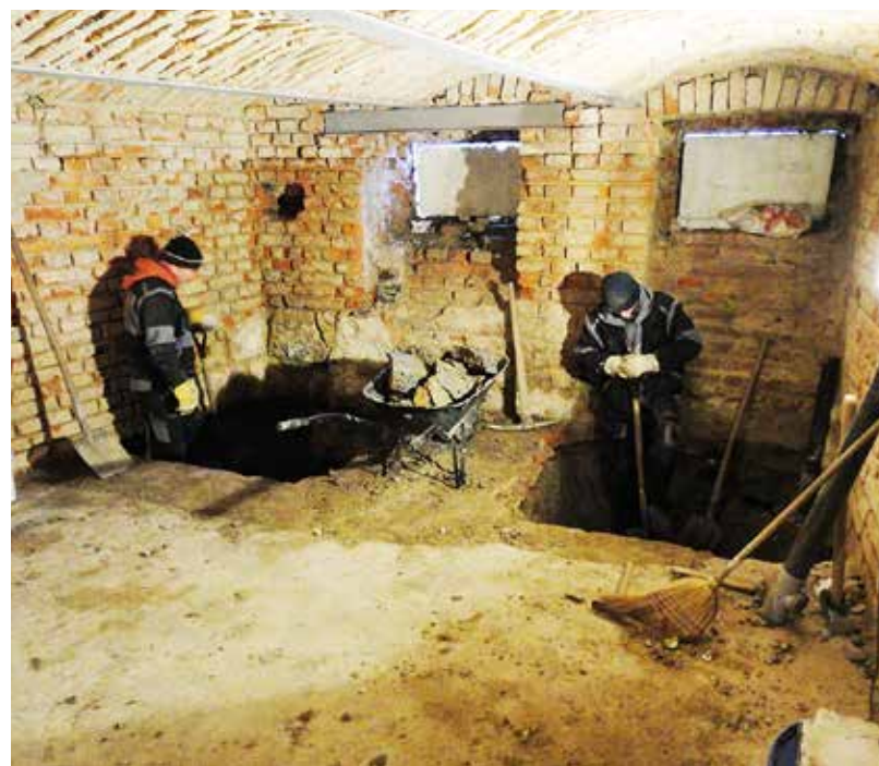
Rekonstrukce prostor v objektu v Cihelní ulici přinese klientům Renarkonu další aktivity pro naplnění volného času.

opravdu potřebuje a zaměstnanec je svým zájmem motivován práci vykonávat. V současnosti běží dva rekvalifikační kurzy. „Do programu jsou zařazeni jen ti klienti, kteří opravdu mají zájem o pracovní místo. Za ty roky ale víme, že kontinuita na trhu práce je problém. Proto jsme za-