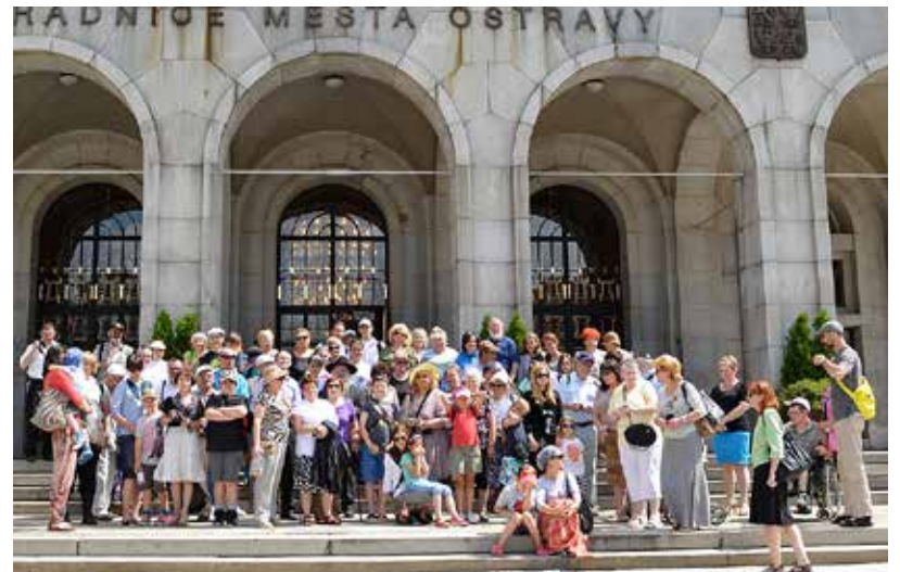
...a ještě snímek před ostravskou Novou radnicí na památku.

v Ostravě, ale také jejich potomci. Všichni odešli v různých vlnách emigrace z Československa do Anglie, USA, Německa či Palestiny. (ph)