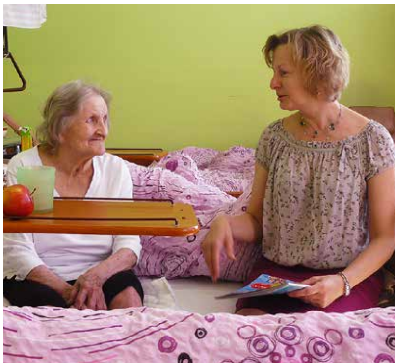
Dobrovolníci docházejí za lidmi v zařízeních nebo v domácnosti a snaží se seniorům zaplnit čas.

mohou zajímat lidé bez ohledu na věk. Charita Ostrava má v současnosti 40 stálých dobrovolníků, dokonce i mladou rodinu, která pomáhá v domově pro seniory. Dobrovolníci přicházejí za klienty v charitních střediscích, chodí