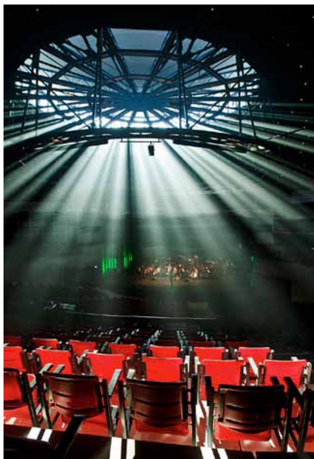
Koncertní sál Gong z přebudovaného plynojemu, autorem projektu je architekt Josef Pleskot.