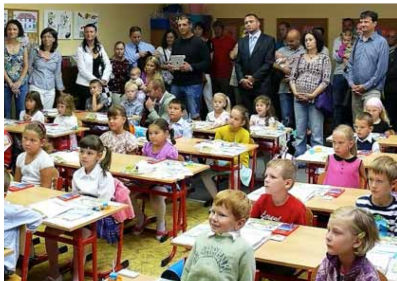
Poprvé usedlo do lavic také třicet žáků 1.A třídy v základní škole na ul. 30. dubna v Moravské Ostravě.

a tělovýchovy použije ušetřené finance pro plnění vládního programu na posílení platů pedagogů v regionálním školství v rámci úsporných opatření vlády. (vk)