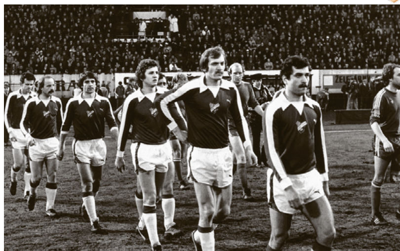
Baník-Bayern Mnichov (2:4) ve čtvrtfinále Poháru mistrů (1981)