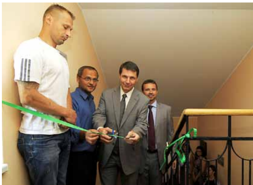
Ze slavnostního otevření nových prostor Doléčovacího centra Renarkon.