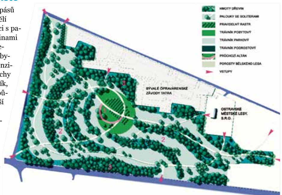
1 – Centrální parková část, 2 – Lesopark, 3 – Clonné porosty.

náklady ve výši 50 mil. korun se začne stavět v roce 2012, dokončen má být v roce 2014. Pro investora Ostravské městské lesy a zeleně, s.r.o., dokumentaci pro územní řízení zpracoval ateliér Ing. Pavel Šimek – FLORART. (vi)