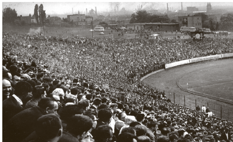
30 tisíc diváků na vyprodaných Bazalech (60. léta)