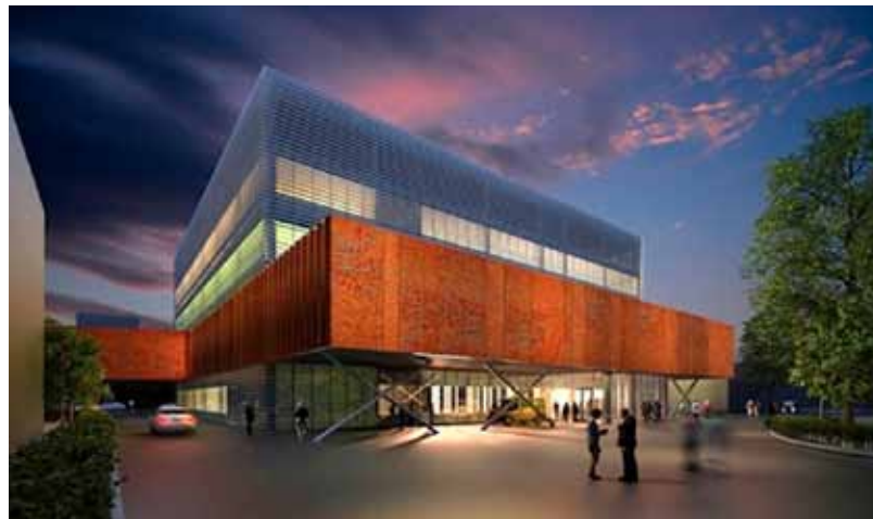
Plánované Centrum operačních oborů

V září bude na základě ankety mezi pacienty spuštěn projekt „Nemocnice, která nejen léčí“. V rámci projektu budou moci pacienti navštěvovat v průběhu hospitalizace besedy a další programy. (g)