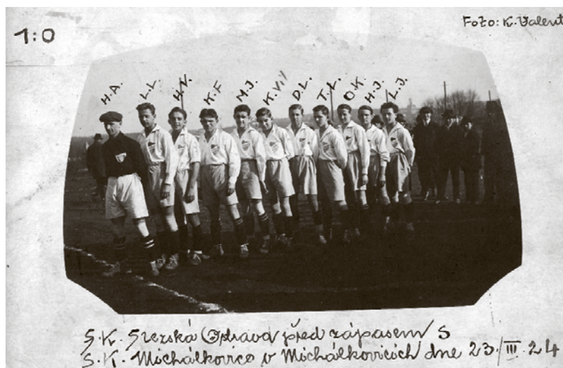
S.K. Slezská Ostrava před zápasem s S.K. Michálkovice v Michálkovicích dne 23./III. 24