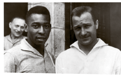
Tomáš Pospíchal a Pelé, nejlepší fotbalista světa. (1962)