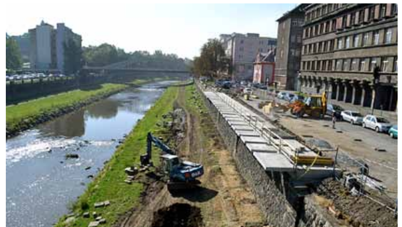
Úprava břehů Ostravice před krajským soudem v Ostravě

600 milionů korun. Město počítá u některých s plným financováním ze strany Ministerstva financí ČR v celkové výši 380 milionů korun. Vybudování rekreačních prvků včetně cyklostezek by mělo stát 220 milionů korun, z toho až 85 % (187 mil.) získají projekty řeky z ROP Moravskoslezsko. Ze svého rozpočtu počítá město Ostrava s vynaloženou částkou okolo 30 milionů korun. Město výrazně spojí finance prostřednictvím výběrových řízení na dodavatele stavebních prací u všech projektů revitalizace řeky Ostravice. (mh, vk)