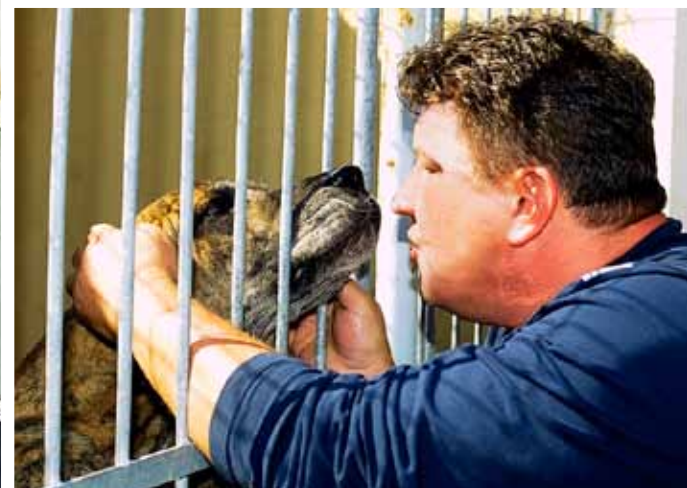
Tahle doga působí hrozně, ale i ona přátelsky vítá vedoucího útulku a dožaduje se pohlázení.

Součástí útulku je odchyťová služba, pracuje v ní osm lidí. Všichni pak spadají pod Městskou policii Ostrava. Odchyťáři volají lidi nejen k toulavým psům, „klienty“ se stávají ptáci, kočky, lišky, velcí pavouci,