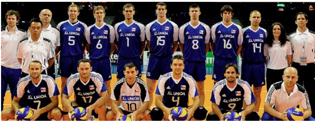
Reprezentace České republiky, účastník kvalifikace o postup na na mistrovství Evropy 2013 v Dánsku a Polsku