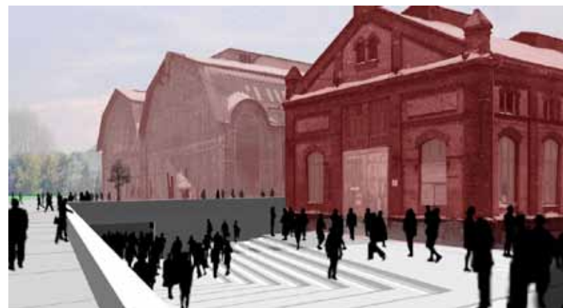
Z Trojhalí se má stát pozoruhodný stánek kultury a společenské zábavy. Dvouhalu bývalé elektrocentrály už před několika lety „testoval“ Jarek Nohavica svým megakoncertem.

zpřístupněn. Ve čtvrti Nová Karolina se současně také rozhoduje o jménech pro další dvě ulice a jedno náměstí (mezi Trojhalím a obchodním centrem). Rozhoduje se mezi názvy náměstí Karla Kryla nebo náměstí Karolina. Ve čtvrti už jsou pojmenovány ulice Jantarová, K Trojhalí, K Šalamounu a Těžařská, lávka na ÚAN nese název Karolinská. Další dvě nové ulice v bytovém komplexu mají nést názvy Šumná a Fajná. (g)