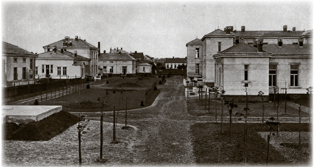
Pohled na nádvoří zábřežské nemocnice od severu. (Snímek z roku 1912)

Teprve v roce 1910 došlo k dohodě mezi obcí Zábřehem a městem Vítkovicemi o stavbě společné epidemické nemocnice a byl podepsán program jejího zřízení, organizace a správy. Vypracováním projektu byl pověřen architekt Ludvík Fiala z Vítkovic, stavět se začalo v roce 1911 a slavnostní otevření epidemické nemocnice se uskutečnilo 14. srpna 1912 za účasti místodržitele markrabství moravského Oktaviana barona