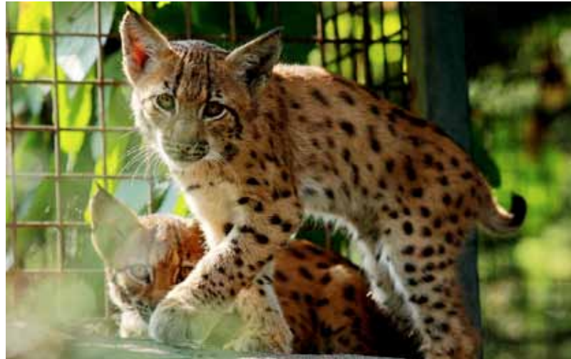
Mláďata rysa karpatského

K záplavě mláďat přibyla mláďata dvou kočkovitých šelem – jedno mládě kočky divoké a dvě mláďata rysa karpatského. Většina kočkovitých šelem patří mezi samotářská zvířata. Samec se se samicí potkává pouze v době říje, kdy dojde k páření, a poté se oba opět rozcházejí. Péče o mláďata pak zajišťuje výhradně samice. Dlouholeté chovatelské zkušenosti Zoo Ostrava však ukazují, že u některých druhů malých kočkovitých šelem nejenže fungují páry společně mimo období péče o mláďata, ale dokonce i v době odchovu mláďat. (k)