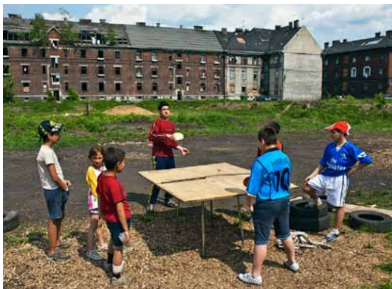
Z přívozkého Přednádraží.

kdy společnost OVAK a. s. zastavila dodávku pitné vody z důvodu dlužné částky neuhrazené vlastníkem domů. Také uvedla, že vnitřní rozvody budov jsou v havarijním stavu a odpadní vody se pravděpodobně dostávají mimo vnitřní kanalizaci. Stavební odbor zjistil, že v místě chybějí trubky, které by tyto splašky odváděly do vnější kanalizace, místo toho tečou do vnitřních prostor budov.