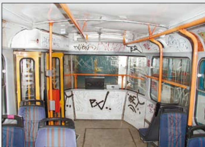
Co dodat... Snad jen: Kdo to zaplatí?

Stejnou radost a přibližně ve stejné době způsobila záchrana mladé srny ze čtyři metry hlubokého kanálu v Ostravě-Petřkovicích. (d)