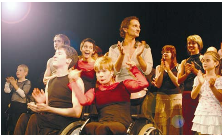
Taneční vystoupení handicapovaných bývají plná nadšení

Divadlo loutek uvede na festivalu premiéru pohádky Princezna Majolenska. (k)