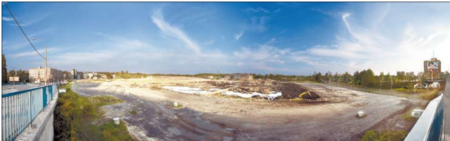
Takto vypadá staveniště Nové Karolíny na začátku září