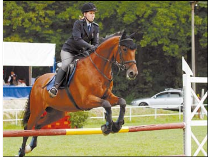
Milovníci koní se na setkání jízdních policí mají na co dívat