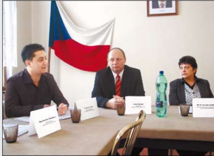
Ministryně Džamila Stehlíková přijela do Ostravy zahájit projekt Lokálního partnerství Agentury pro sociální začleňování v romských lokalitách.