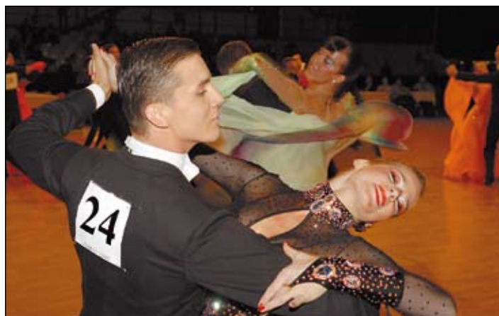
Ve standardu i latině se v ČEZ Aréně představí špičkové taneční páry

Třebaže je nejstaršímu členovi souboru třiaosmdesát a nejmladší má šedesát, i takováto zdařilá akce a aktivní podpora města dokázaly seniorům nalít novou sílu do žil. Chtějí připravit mnohá další vystoupení. Asi je jim vlastní myšlenka francouzského básníka, spisovatele a filozofa Voltaira: „Nebýt ničím zaměstnán a neexistovat je pro člověka totéž.“ (vš)