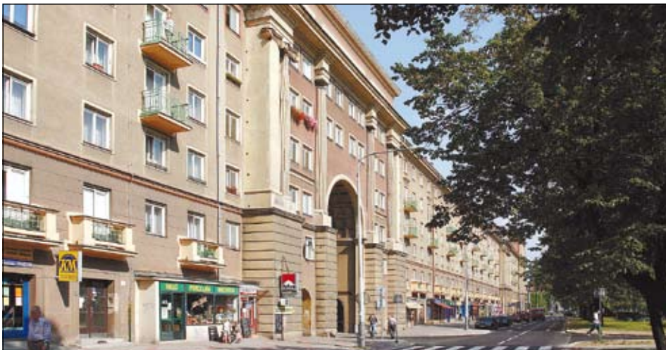
V městském obvodu Ostrava-Poruba vlastní RPG šest a půl tisíce bytů

RPG vlastní 44 tisíc bytů, jen v Ostravě jich je přes 15 tisíc. Nejvíce šest a půl tisíc v Porubě. Další jsou hlavně v Karviné, Havířově a Orlové.