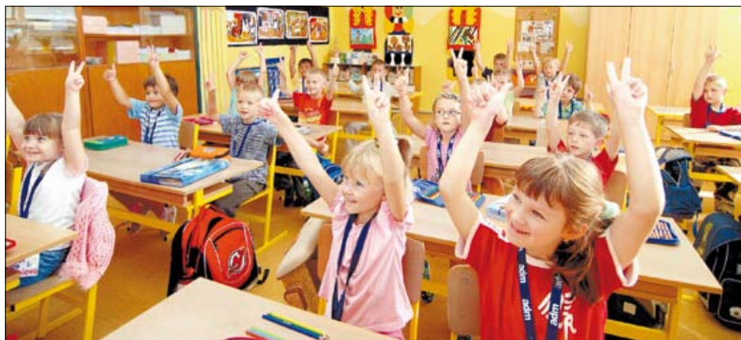
Tisíce prvňáčků si první školní den opravdu vychutnaly

Slavnostně přivítali školní rok 2008-2009 studenti a pedagogové