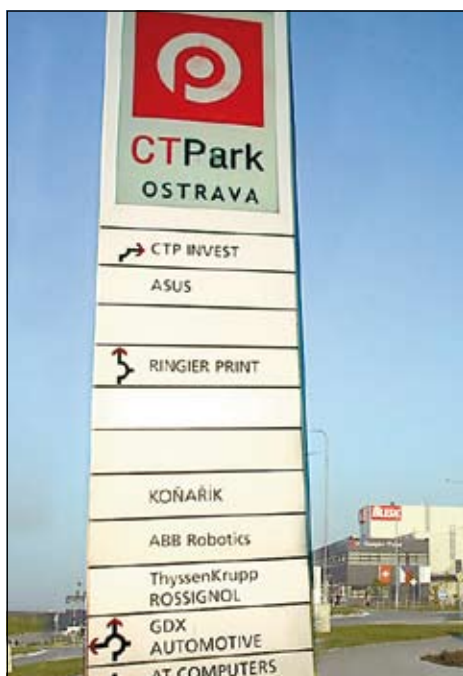
Průmyslová zóna Hrabová

Snažíme se snižovat provozní náklady, ale tak, aby se úspory neprojevovaly na kvalitě služeb. Podařilo se nám například zorganizovat nákup elektriny pro všechny městské organizace, asi pět set odběrných míst, a na internetové aukci jsme ušetřili na padesáti milionech asi deset procent. V rozpočtu města to není bůhvíco, pracujeme však na dalších věcech, určitě se nám ještě něco podaří. (mb)