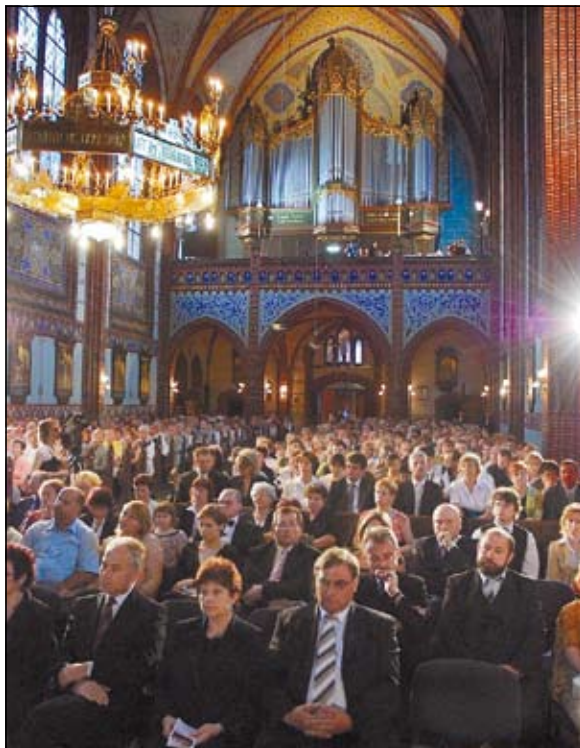
(č) Koncerty v kostelích bývají vždy vyprodané

Další koncerty v rámci tohoto pozoruhodného hudebního svátku se konají na mnoha místech. Například v havířovském kostele sv. Anny, v kostelech ve Staré Bělé, Třinci, Kozlovicích, Štramberku, evangelickém kostele v Ostravě, v Karviné, Hlučíně, Bruntále, Opavě, Krnově a dalších moravskoslezských městech. Měsíční program představuje dohromady 33 kvalitních koncertů, některé se zahraničními sólisty. Koncerty podporují města i obce i mnohé podnikatelské subjekty. Podrobný program a informace o vstupenkách nabízí adresa www.shf.cz . (č)