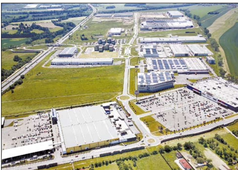
Letecký snímek průmyslové zóny Hrabová