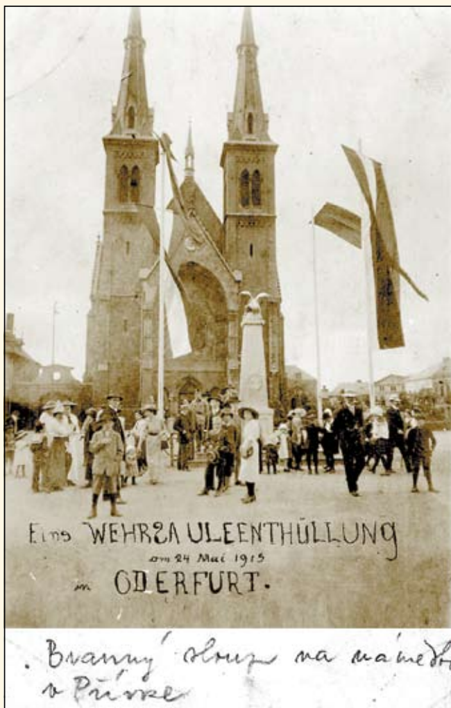
Válečný památník vztyčený na náměstí v Přívoze

Dobová pozvánka na císařskou slavnost dýchá starými časy