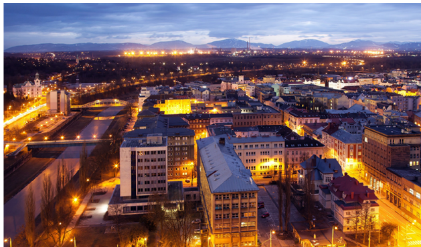
Pohled z radniční věže, v pozadí panorama Beskyd

2023 a dále. Ostrava připravuje ambiciózní plán, který přinese prosperitu a vylepší vnímání města v očích jeho obyvatel, návštěvníků, sousedů i ve světě. (osr)