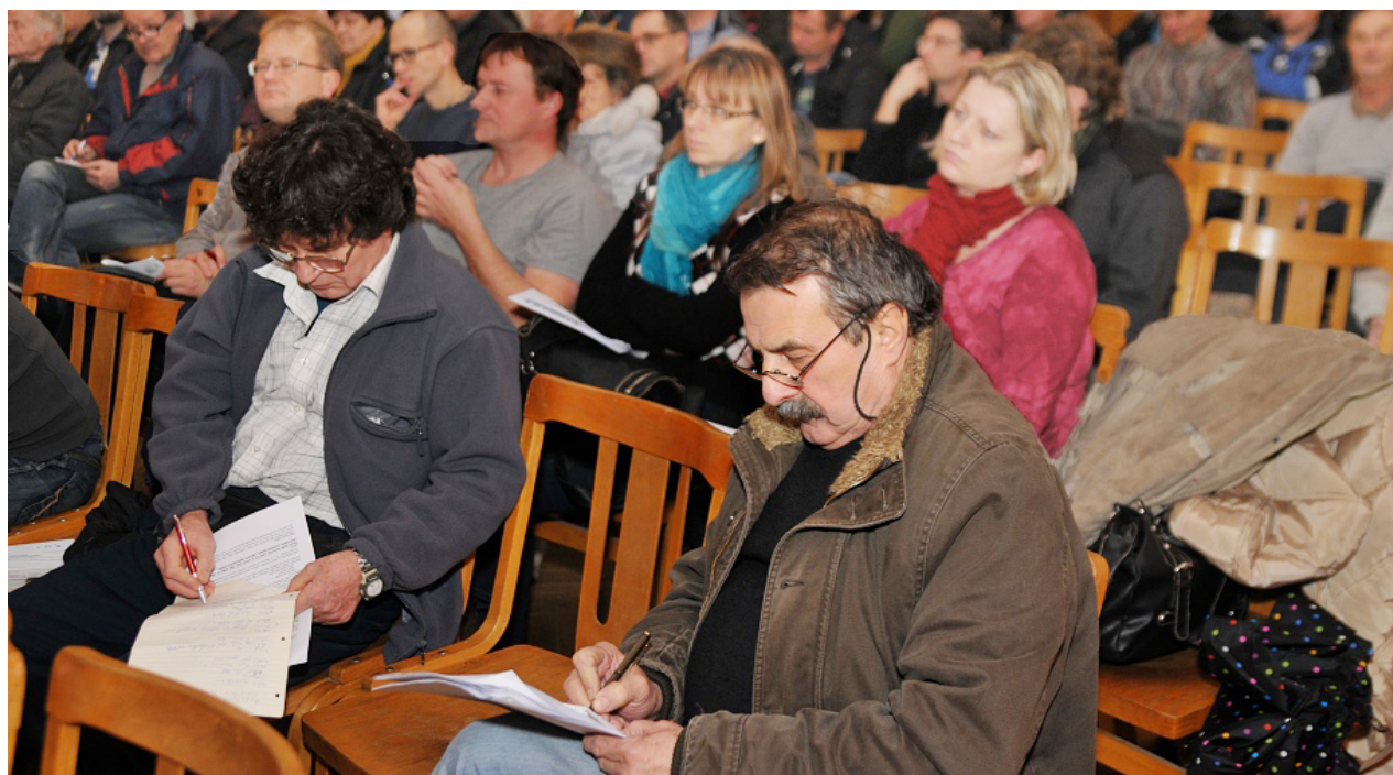
Zájemci o dotace na semináři ve Staré Bělé