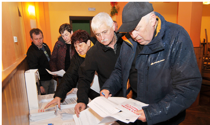
V ostravských městských obvodech probíhají semináře pro zájemce o výměnu kotlů. Snímek je ze Staré Bělé.

Podrobnosti ke kotlíkovým dotacím čtete v dnešním vydání Ostravské radnice na stranách 8 a 9. (bk)