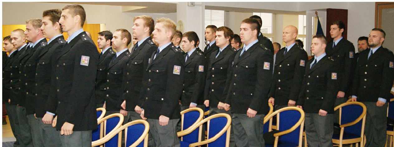
Nováčci při slavnostním nástupu k Policii ČR

Písemná žádost doručená na personální pracoviště, občanství ČR, věk nad 18 let, bezúhonnost, minimálně střední vzdělání s maturitní zkouškou, fyzická, zdravotní a osobnostní způsobilost k výkonu služby. Uchazeč nesmí být členem politické strany nebo politického hnutí. Kontakt: Krajské ředitelství policie MS kraje, ul. 30. dubna 24, 728 99 Ostrava, tel. č. 974 722 409, e-mail: krpt.op.vyber@pccr.cz . (liv)