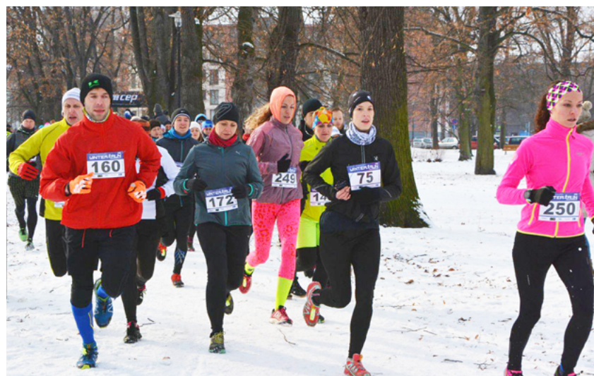
Kondiční běh a Komenského sady patří k sobě