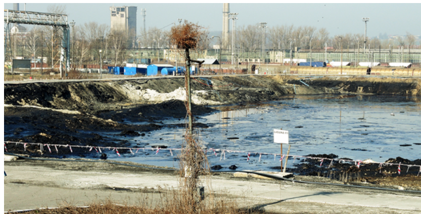
Z ropných lagun Ostramo zbývá vytěžít přes 90 tisíc tun kalů