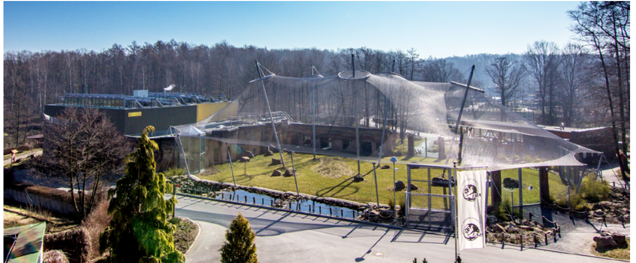
Pavilon evoluce, největší investice v historii Zoo Ostrava

V areálu zahrady se podařilo komplexně zateplit několik velkých objektů,