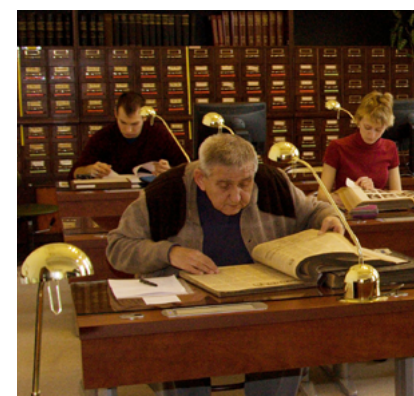
Ve studovně Archivu města Ostravy

Richtra, vzhledem k již stanovenému obsahu článků pro rok 2016, jsme zařadili do roku 2017.“ (vi)