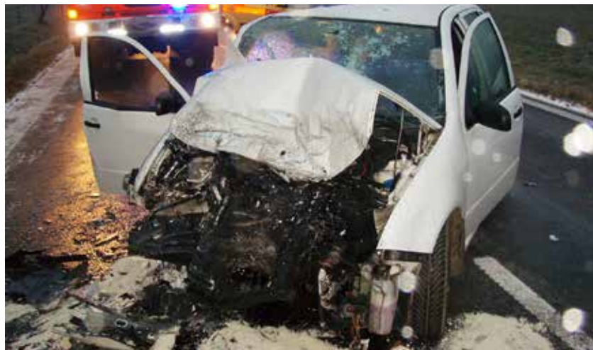
Archiv snímků dopravních nehod je více než výmluvný – řidiči často přeceňují své schopnosti, zejména v zimě.

nedisciplinovaní, netolerantní a bezohlední, jak ukazují čísla. V této oblasti – zavinění lidským faktorem – je ještě hodně co zlepšovat. (p)