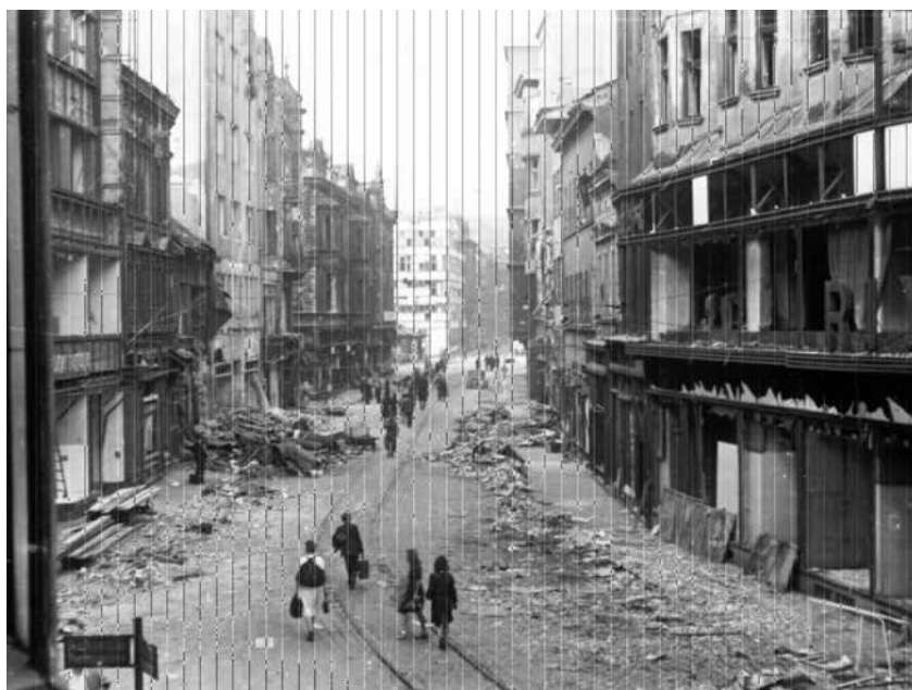
Ulice 28. října ve směru k Masarykovu náměstí po náletu Spojenců v srpnu roku 1944