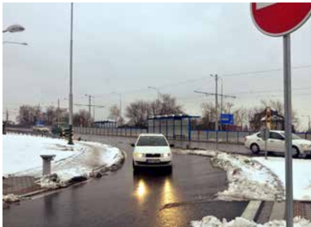
Propojení ulic Plzeňské a Pavlovovy urychluje cestování mezi Zábřehem a Hrabůvkou. Podchody pro chodce v kombinaci s cyklostezkou přispívají k vyšší bezpečnosti dopravy.

V těchto dnech byla celá dopravní stavba dotovaná z evropských fondů prostřednictvím ROP Moravskoslezsko kompletně dokončena. Propojení do nedávna slepé Pavlovovy ulice s dopravní tepnou Plzeňskou přispělo k zjednodušení provozu a uklidnění situace v ulicích Čujkovově a Výškovické. Výstavba mimoúrovňového podchodu pod ulicí Plzeňskou,