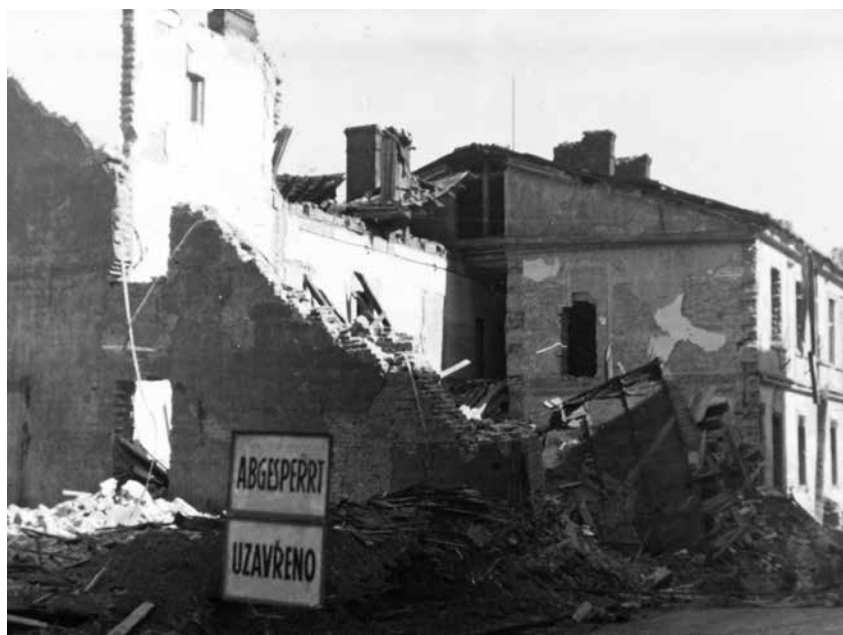
Uzavření zničených ulic po spojeneckém náletu v roce 1944