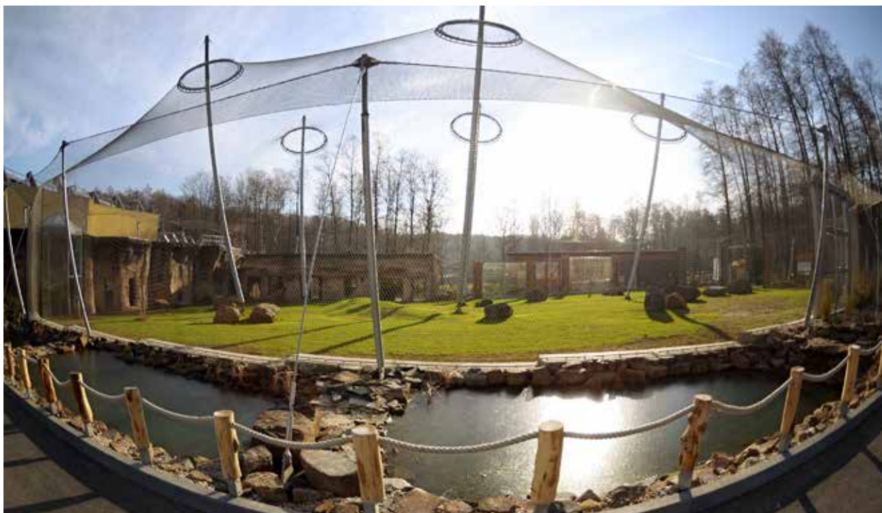
Pokračování na str. 14 V Pavilonu evoluce zatím bydlí jen šimpanzi. Celkem patnáct jich tady má najít nový domov.

Pavilon evoluce je v historii ostravské zoo nejdražší projekt. Celkově si vyžádal 143 milionů korun.