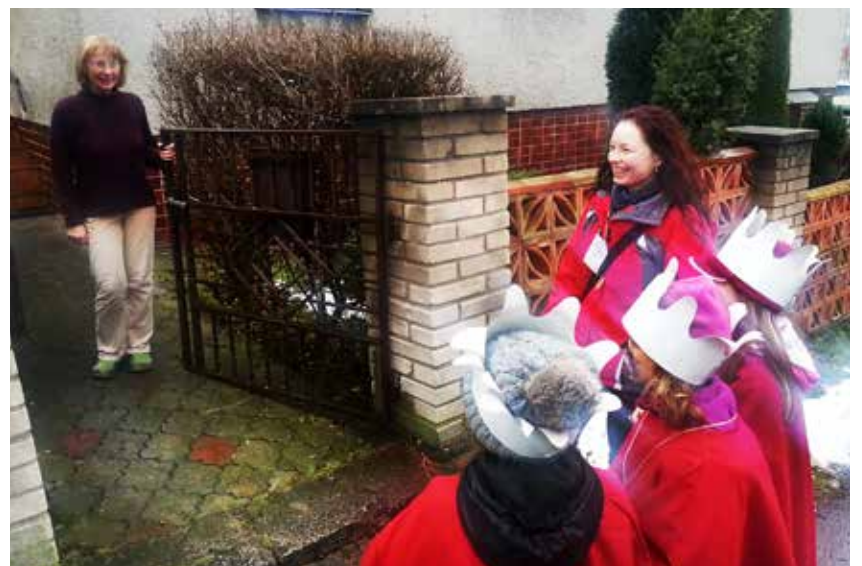
Také v Ostravě-Petřkovicích zvonili koledníci u každého domu, většinou se jim dostalo milého přivítání.

Kolem nového roku se infekce v útulku rozšířila nakažou zřejmě od štěňat do útulku přijatých. Do odvolání tak zařízení nepřijímá nové psy a zájemci si žádného pejska momentálně nemohou ani osvojit. Na zatoulané psy mohou lidé zavolat městské strážníky, kteří zjistí majitele podle případného čipu, neoznačené a toulavé psy může policie dočasně umístit v útulcích v Opavě, Havířově nebo Frýdku-Místku, pokud pes nebude ohrožovat bezpečnost lidí. (k)