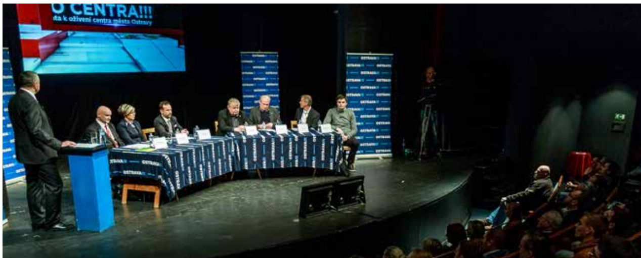
Na jevišti divadla loutek se odehrála debata o budoucnosti centra Ostravy. Radnice chce podobně otevřít i další ožehavá témata.

Bydlení, první ze čtyř témat diskuse, je důležitým předpokladem oživení centra. Velice dobře si to uvědomují představitelé města. Obvod Moravská Ostrava a Přívoz v centru vlastní 119 bytů, což je pouze 8 procent bytového fondu ve městě. Nájemné v nově ob- sazovaných bytech se pohybuje kolem