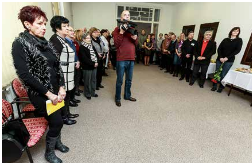
Účastníci křtu kalendária v budově Archivu města Ostravy

Kalendárium nabízí na 103 stranách informace o politických, společenských, kulturních a sportovních událostech v Ostravě nebo s městem spojených. Texty a fotografie připomínají 120. výročí otevření Národního domu (dnes Divadlo Jiřího Myrona), 120 let městské hromadné dopravy nebo 90 let od založení vítkovické atletiky. Rok 2014, kdy byla Ostrava Evropským městem sportu, dokumentuje fotografie na obálce z druhého ročníku Českého běhu ženu. Chybět nemůže tenisový Davis Cup Česká republika–Nizozemsko, atletický mítink Zlatá tretra, ale také řada sportovních akcí pro veřejnost.