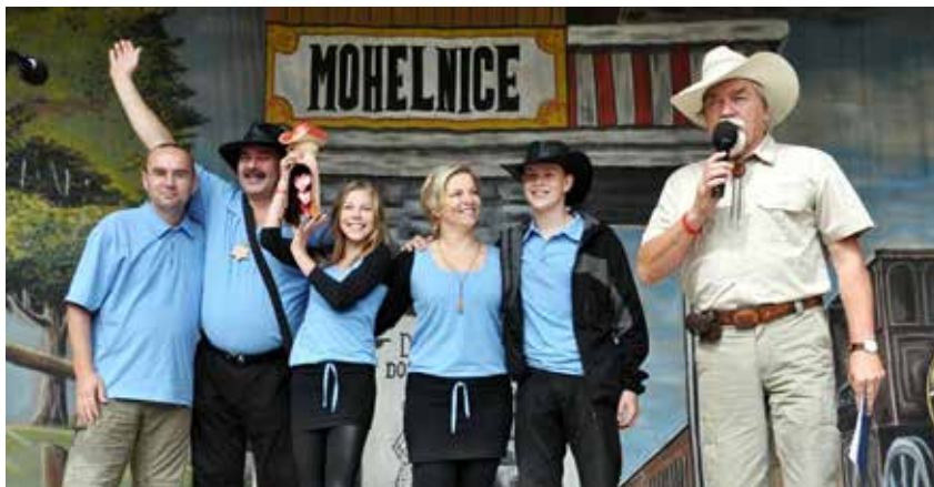
Skupina Marod na Mohelnickém dostavníku