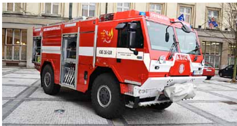
Tatra pro hasiče z Ostravy-Zábřehu.

bude pomáhat v plnění nelehkých úkolů hasičského sboru a že nebude posledním vozem financovaným z prostředků města. Připomněl chystanou novelu zákona o rozpočtovém určení daní, kvůli které by Ostrava mohla přijít až o miliardu z rozpočtu. Dodal, že moravskoslezští hasiči patří k nejlepším v republice. (ph)