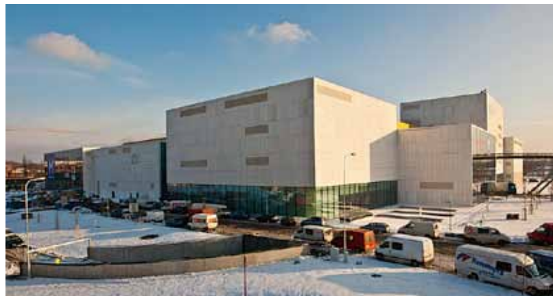
Na stavbě panuje čilý ruch, firmy, které budou v obchodním centru sídlit, už zařizují své pronajaté prostory.