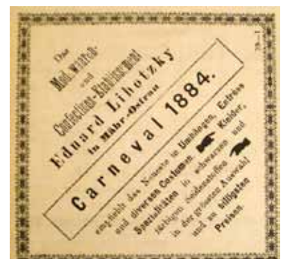
Inzerce plesového oblečení (1884).