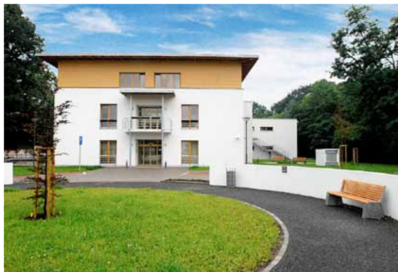
Hospic sv. Lukáše je moderní zařízení, vyrostl uprostřed zeleně.

Na dlouhé životní pouti každého člověka by měl právě její závěr, pokud to jen trochu jde, být smířeným a klidným pozastavením v blízkosti dobrých lidí. Hospic sv. Lukáše tohle přání každého z nás sto procentně napl-