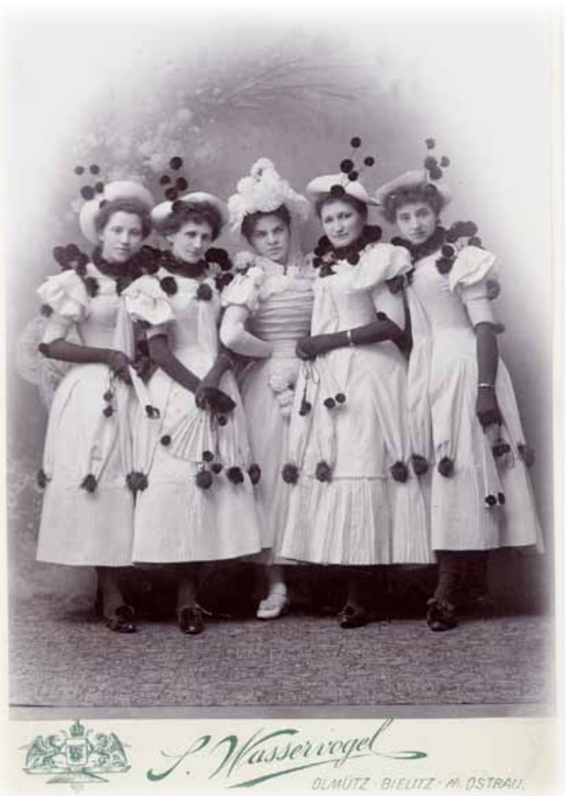
Účastnice maškarního plesu, počátek 20. století.

Vtipně vymyšlená maska mohla své nositelce např. na „Monstrozním maškarním plese“ 10. února 1884 přinést nemalou pozornost, a to výhru v podobě dvou zlatých prstenů. Nejoriginálnější maska bez rozdílu