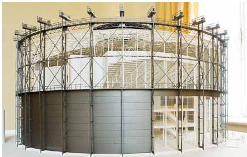
Takto by měla vypadat konečná podoba přeměny plynojemu na multifunkční halu.

Od 1. února už lze vstupenky na festival zmluvit v objednávkovém systému přímo na sekretariátu Janáčkovy máje (telefonicky, faxem, e-mailem), od 2. dubna začíná volný prodej vstupenek v domě kultury, Ostravském informačním servisu a v informačních centrech v Havířově, Frýdku-Místku, Orlové, Kopřivnici, Frýdlantu. Za největší lahůdku v letošním programu festivalu lze považovat klavíristu Rudolfa Buchbindera a italskou pěveckou hvězdu basistu Ferruccio Furlanetta. (o)