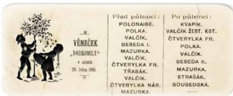
Taneční pořádek plesu Dobromily v roce 1906.