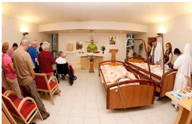
Do kaple hospice na mši pomůže personál imobilním lidem i s lůžkem.

Lidé se zdravotním postižením a senioři potřebují kompenzační pomůcky pro každodenní život. Chodítka, invalidní vozíky, toaletní židle, odsávačky, koncentrátory kyslíku, lineární dávkovač, infuzní pumpy aj. či dokonce polohovací postele lze za úhradu zapůjčit domů v Hospici sv. Lukáše ve Výškovicích. Podrobnosti na tel. čísle 599 508 505 nebo 731 625 768 nebo na stránkách www.ostrava.charita.cz .