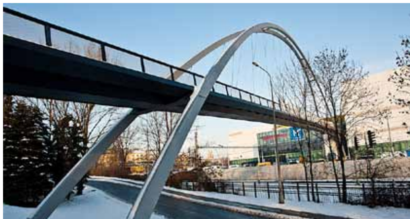
Druhá polovina lávky z autobusového nádraží do obchodního centra bude zprovozněna při otevření tohoto objektu.

lávky z ÚAN. Město pokračuje ve stavbě Prodloužená Porážková, tato ulice vedoucí od Bauhausu podél železniční trati pod Frýdlantskými mosty zpřístupní Novou Karolinu z jiné strany, než je křižovatka ulic 28. října a Poděbradova – dosavadní jediný přístup do budované čtvrti. Za budovaným obchodním centrem bude provizorní zastávka autobusové linky, která bude mít trasu ze zastávky od Domu umění. Umožní přístup návštěvníků Nové Karoliny na další linky MHD do doby vybudování nové tramvajové zastávky v ulici 28. října (u finančního úřadu). Do budoucna se počítá s prodloužením trolejbusové linky po ulici Porážkové až do nové čtvrti. Součástí první etapy výstavby Nové Karoliny je rovněž výsadba zeleně. (ok)