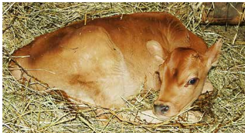
Telátko jerseykého skotu působí jako každé mládě – živá plyšová hračka.

Svůj vztah ke zvířatům mohou vyjádřit děti i dospělí, když se zapojí do tradiční podzimní sbírky plodů, kterými se zpestřuje jídelníček zvířat. Sbírat a dobře odděleně usušit lze šípky, jeřabiny a žaludy výhradně z divokých, nikoli parkových keřů a stromů. Předání a slavnostní vážení nasbíraných plodů se uskuteční 2. listopadu přímo v zoo. Pro nejlepší sběrače jsou připraveny ceny – dárkový poukaz na návštěvu horského lanového centra Tarzanie v Ráztoce pod Pustevnami (za žaludy) a také návštěva zákulisí pavilonu afrických zvířat v ostravské zoo (za sběr šípků a jeřebin). (g)