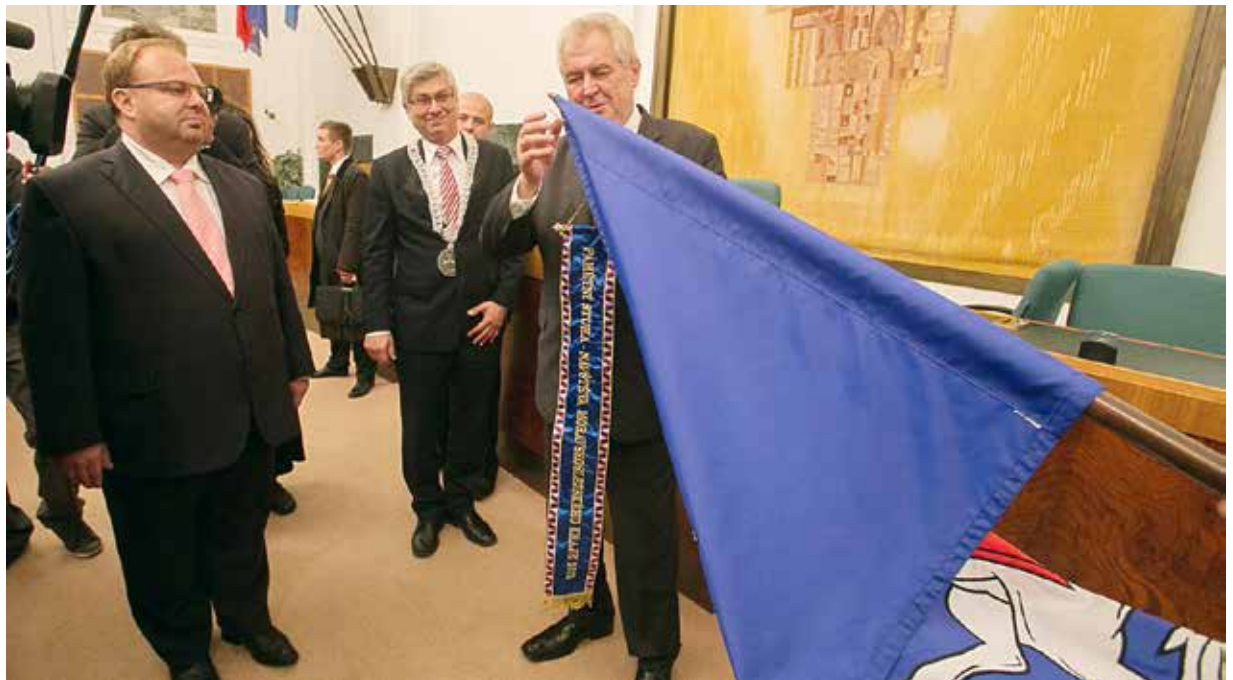
Miloš Zeman dekoroval na závěr své návštěvy Nové radnice prapor statutárního města Ostravy čestnou stuhou prezidenta republiky