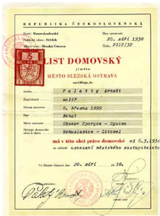
Domovský list vydaný městem Slezská Ostrava. Byl důležitý pro získání průkazu o státním občanství a dalších osobních dokladů.