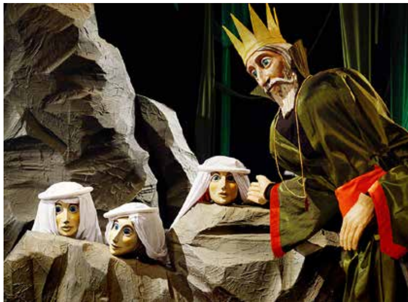
Klasické loutky se představily v premiéře známé pohádky Zlatovláska