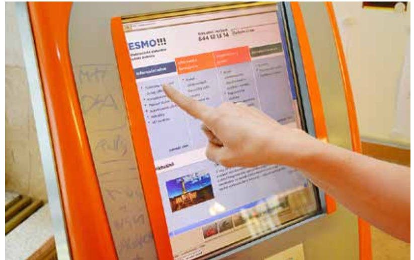
Ilustrační foto: MMO

Ve druhé etapě projektu byl v průběhu září lokální agendový systém města rozšířen o napojení na celostátní informační systém základních registrů veřejné správy. Z modulů informačního systému, jako je např. evidence