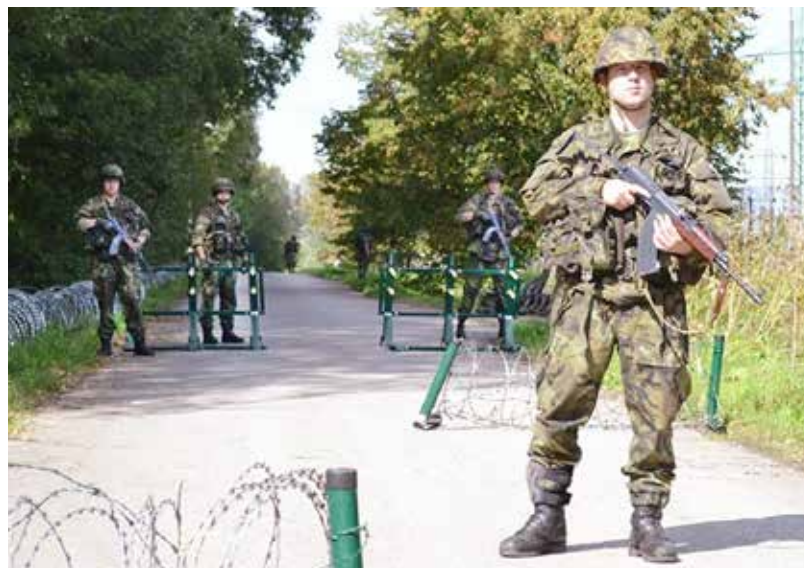
Kontrolně propouštěcí stanoviště při zářijovém cvičení aktivních záloh.

sdělí na pracovišti Krajského vojenského velitelství Ostrava, Nádražní 119, tel. č. 973 487 770. Podrobnosti o činnosti aktivní zálohy lze najít na www.kvv-ostrava.army.cz . (ro)