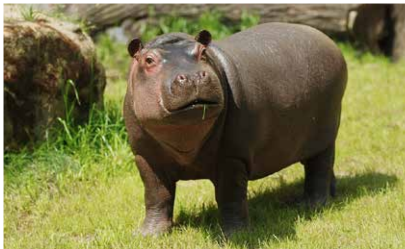
Hroší kluk Kvido rozhodně svou velikostí a vahou miminko nepřipomíná.

V radostném očekávání je slonice Vishesh, vyšetření ultrazvukem odborníky z berlínského Leibnizova institutu potvrdilo, že mládě je teď asi 50 cm velké, hýbe se a je v pořádku.