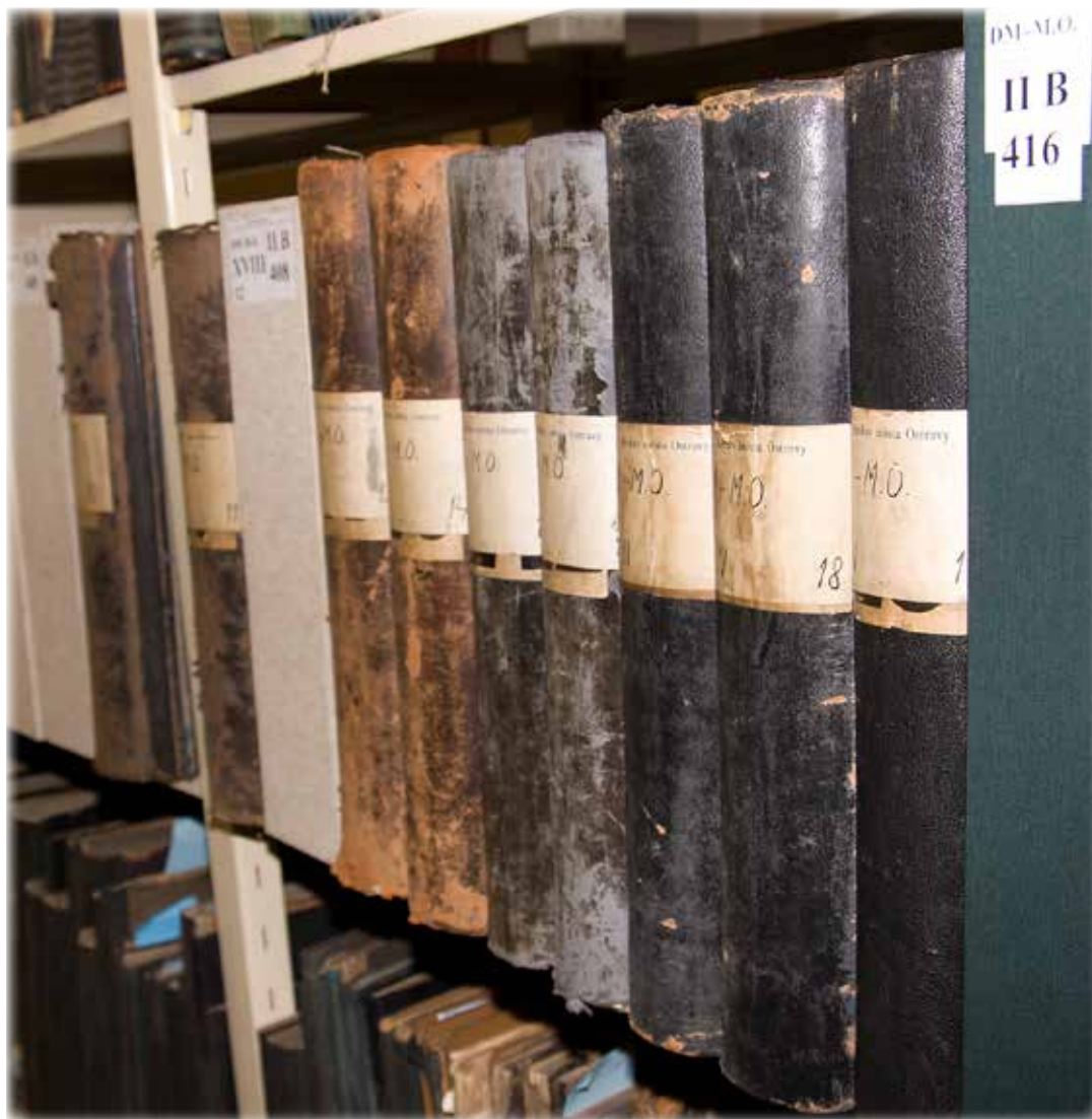
Uložení matričních knih v depozitáři Archivu města Ostravy