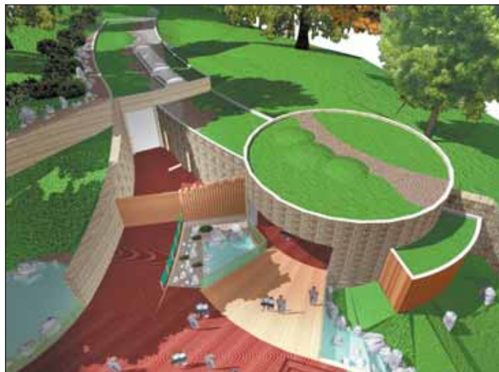
Návrh projektu nového pavilónu pro medvědy a hulmany v ostravské zoo.