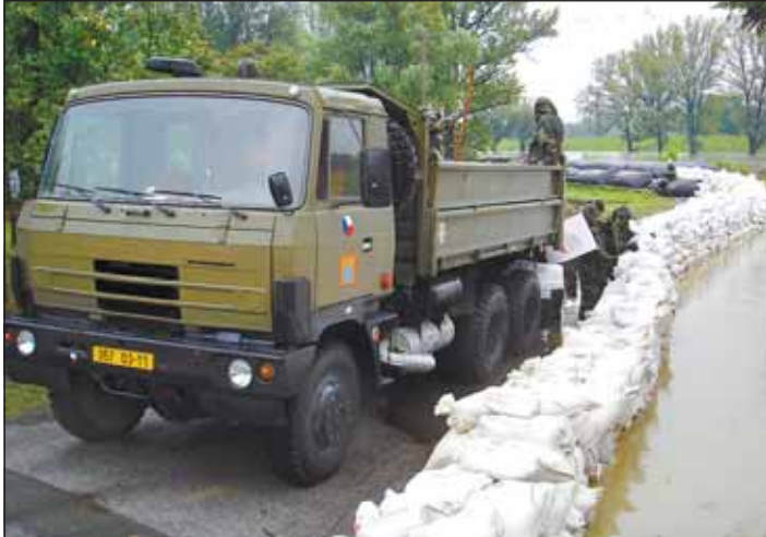
Tahat pytle s pískem a stavět hráze je velmi namáhavá práce