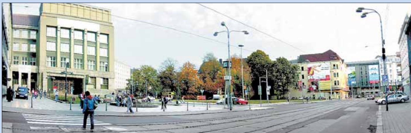
Náměstí Dr. E. Beneše v centru Ostravy, kde mohou vyrůst nové objekty

Nerad bych teď řekl přesné datum. Není možné jej stanovit, protože zákon o obcích nám ukládá, že záměr prodeje i prodej samotný musí vždy schválit zastupitelstvo, které se musí s každým projektem seznámit. Také kupující musí mít dostatek času, aby vůbec stihli připravit kvalitní nabídky. Na druhé straně bych ale chtěl říci, že není naším záměrem procesy prodeje neuměrně protahovat. Moc dobře si totiž uvědomujeme, že by se pak zájem investičních skupin a developérů mohl velmi rychle přesunout jinač. (K)