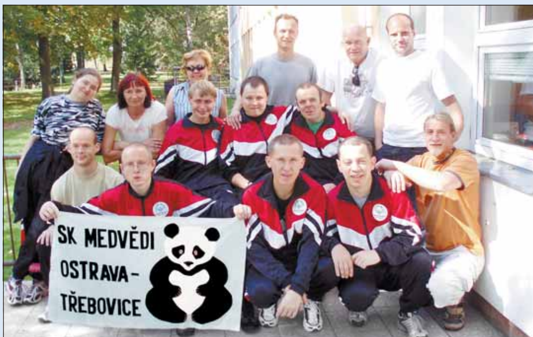
Fotbalový tým „Medvědi“ z centra Čtyřlístek si dovezli bronzovou medaili.