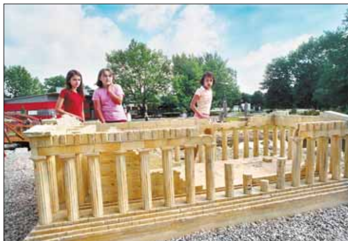
Také výstaviště Černá louka a Miniuni se má díky novým projektům změnit.

Celý projekt zaručuje vyšší šance při čerpání finančních prostředků z operačních programů nejen pro město, ale také pro další subjekty na území města, jejichž projekty budou do IPRM zahrnuty.