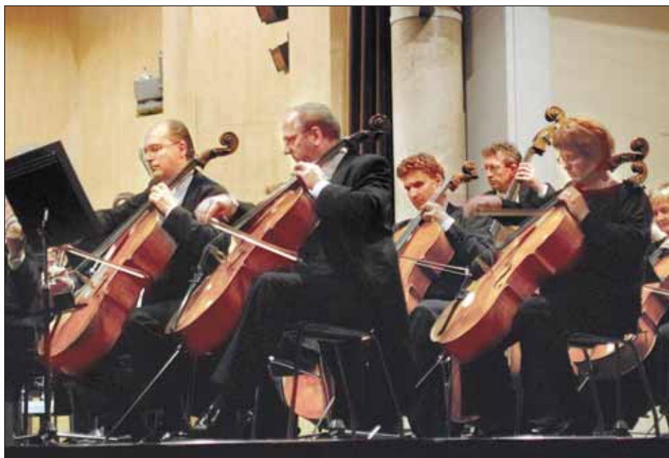
Janáčková filharmonie Ostrava na prvním zahajovacím koncertu nové sezóny