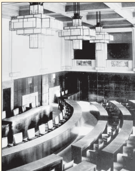
Sál zastupitelstva v Nové radnici v roce 1930