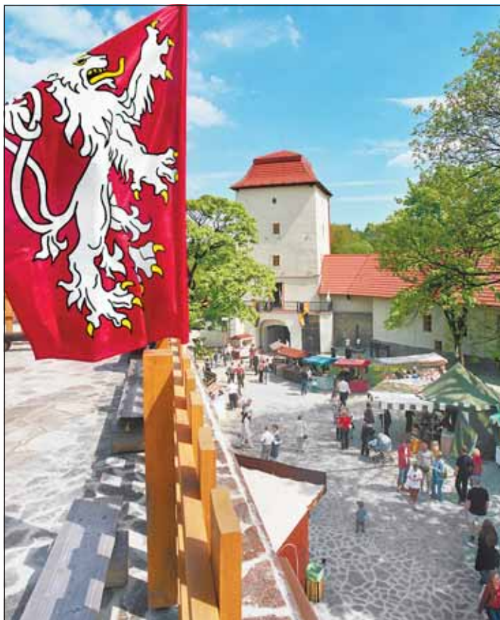
Slezskoostravský hrad je se svým programem hojně navštěvovaný. I ten se má do budoucna rozšířit pro pořádání mnoha zábavných akcí