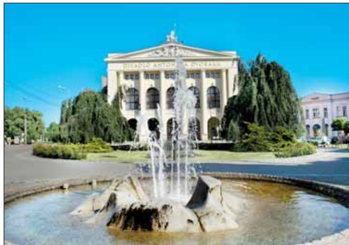
Současná podoba Divadla Antonína Dvořáka

Příznivci divadelní kultury oslavují s divadlem jeho výročí už od září. Divadlo potěší své návštěvníky mimo jiné 10. listopadu premiérou hry Přelet nad kukaččím hníz-