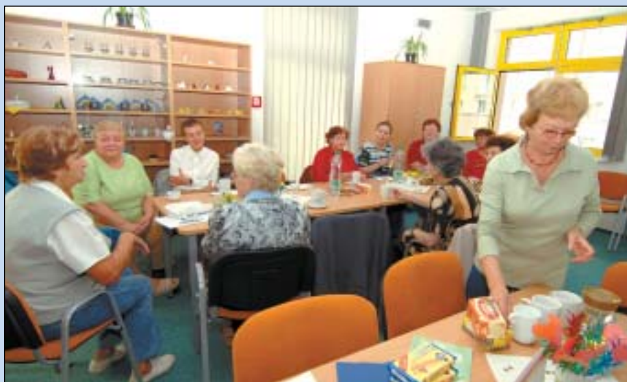
Občané Ostravy-Jih mohou trávit volný čas v novém G-centru, do jehož výstavby investoval městský obvod 47 milionů korun.