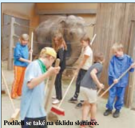
Podíleli se také na úklidu slonince.