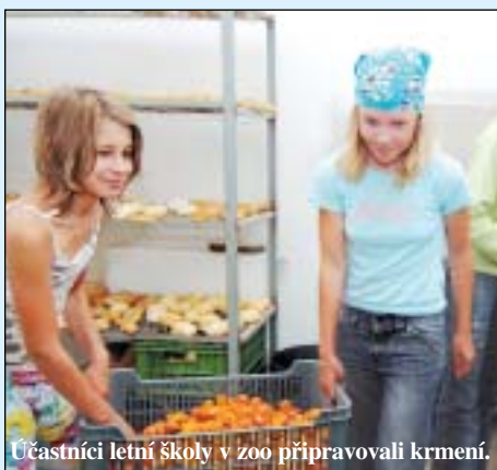
Účastníci letní školy v zoo připravovali krmení.