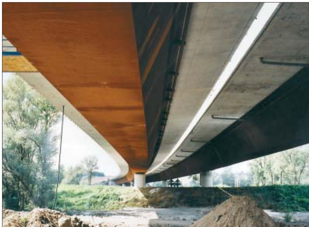
Most přes řeku Odru v délce zhruba 400 m.

Na listopad je plánováno zahájení šestikilometrové trasy přes Ostravu. Finanční nabídku na tuto stavbu prvního úseku dálnice D47 předlo-