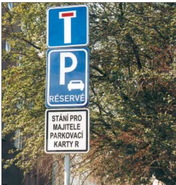
Majitelé parkovacích karet R (obyvatelé) mohou na vymezených plochách parkovat za 600 Kč ročně.

Obyvatelé (karta R - rezidenti) mohou na vymezených plochách parkovat za 600 korun ročně, zaměstnanci firem (karta A - abonentní) za 12 tisíc ročně. Za každé další auto podnikatelé zaplatí 16 800 Kč. Náměstek primátora připomíná, že abonentní ani rezidentní karta v žádném případě řidiči neposkytuje právní nárok na dané místo, ale dává mu pouze možnost zaparkovat ve vyznačené zóně, aniž by se dopustil dopravního přestupku. Řidičům jsou samozřejmě k dispozici v centrální části města ještě placená hlídaná parkoviště a garáže na Černé louce a pod Prokešovým náměstím. Celodenní parkování na záchytných parkovištích stojí od 35 do 60 korun, krátkodobé parkování s automaty přijde na 20 korun za hodinu. (M)