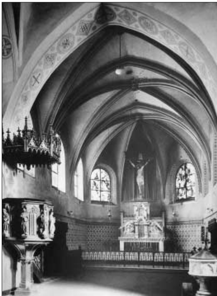
Překrásný interiér nejstarší církevní stavby v Moravské Ostravě.

Tajemství báně - to je název právě probíhající výstavy, kterou připravilo a instalovalo ve svých právě rekonstruovaných prostorech Ostravské muzeum spolu s městským archivem. Jak už sám název napovídá, návštěvníci si mohou prohlédnout a seznámit se do konce tohoto roku s obsahem takzvaných schránek na věčnou paměť uložených ve věži kostela sv. Václava v Moravské Ostravě.