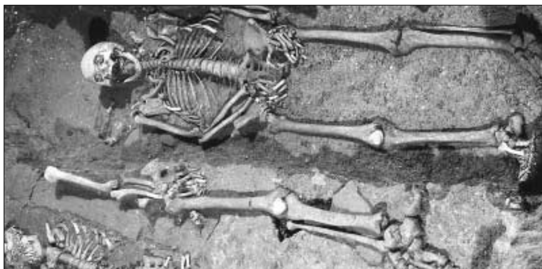
Nejen věž ukrývala svědectví minulosti (archeologické vykopávky v šedesátých letech minulého století).

Trvalo déle než půl století, než byly tyto materiály z věže vyňaty. To bylo roku 1966. Až po pěti dalších letech putovaly tubusy zpět. Ovšem už s novým obsahem - fotografie řemeslníků provádějících opravy, pamětní zápis o rekonstrukci, záruční list s třicetiletou lhůtou, noviny Rudé právo, Nová svoboda, Lidová demokracie, ale i Katolické noviny české i slovenské. Nescházela samozřejmě zpráva o moravskoostrovské farnosti a brožura o ostravských kostelech. Do jedné ze schránek byl vložen také výtisk faksimilové edice Závět biskupa Bruna z roku 1267. (MaB)