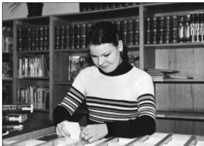
Jednou z organizací, která využívá práci stážistek úřadu práce, je také Knihovna města Ostravy.

Do loňského podzimu měl náš úřad práce, stejně jako dalších 76 úřadů práce v republice, jediný hlavní účinný nástroj, jak absolventům škol pomoci: Mohli jsme zaměstnavatelům, kteří se rozhodli absolventa školy zaměstnat na půl roku až devět měsíců (podmínky se podle jednotlivých úřadů liší), dotovat podstatnou část jeho mzdy. Ostravský úřad práce uzavírá na dotovanou absolventskou praxi v průměru ročně kolem 650 smluv. Od konce loňského roku, na základě usnesení vlády č. 325, jsme vedle absolventské praxe zavedli pro mladé další účinný nástroj, a to rekvalifikaci - stáž. Stážisté nejsou zaměstnanci organizace, u které pracují, a nemohou pobírat mzdu ani jinou odměnu. Po dobu stáže dostávají od úřadu práce hmotné zabezpečení v takové výši, jako v rekvalifikaci. Úřad práce jim také uhradí pojištění pro případ úrazu či způsobení nějaké škody. Po ukončení stáže dostanou absolventi o-