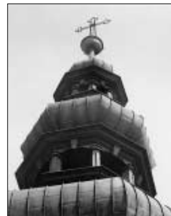
Renesanční věž s barokní kopulí.