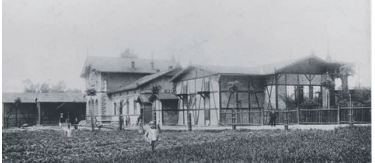
Budova hostince Nová stělnice (v místech dnešní Nové radnice a Komenského sadů), za níž cirkusová představení proběhla

Připomeňme, že Moravská Ostrava měla v roce 1900 něco přes 30 tisíc obyvatel. Tramvaje přepravily do města 18 tisíc osob, což byl do té doby největší počet cestujících, kteří využili hromadné dopravy v jediný den. Mnohé podniky poskytly volno svým zaměstnancům, školy žactvu a dokonce i městská kancelář úředníkům. Velkolepou podívanou si na prostranství za novou stělnicí (za radnicí v dnešních Komenského sadech)