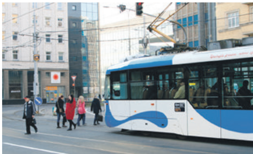
Po tramvajích se na Nádražní ulici vrátí i automobily

S úpravami dalších částí komunikace směrem k hlavnímu nádraží město v současné době nepočítá. (bk)