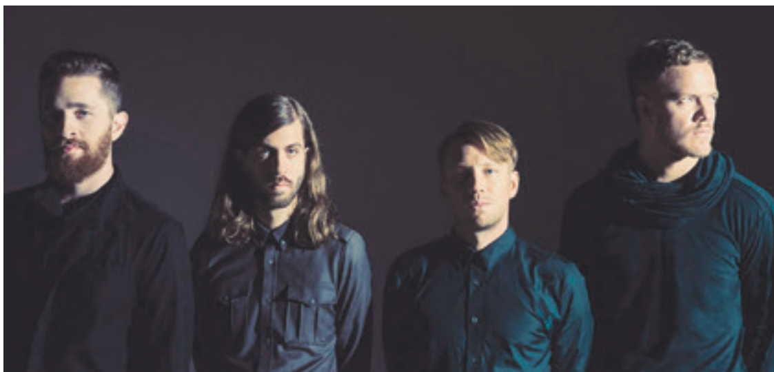
Americká kapela Imagine Dragons, hlavní hvězda příštího ročníku festivalu

Po uzávěrci: Norah Jonesová! Americká zpěvačka, devítinásobná držitelka cen Grammy, je další potvrzenou hvězdou, která v červenci přijede do Ostravy.