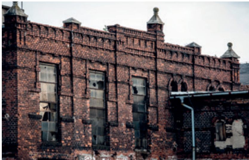
Historická městská jatka v současné podobě