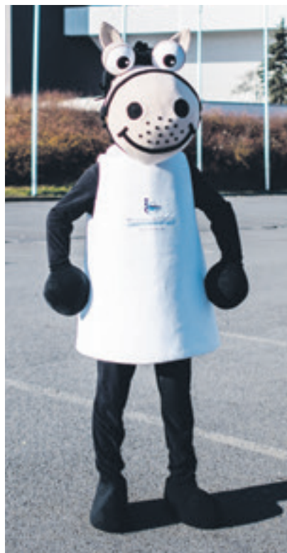
Maskot lednového mistrovství Evropy Axel pózuje před Ostravar Arénou.

Arény, v síti Ticketportal, resp. prostřednictvím internetových stránek ( www.ticketportal.cz nebo www.ostrava2017.eu/vstupenky ). (vi)