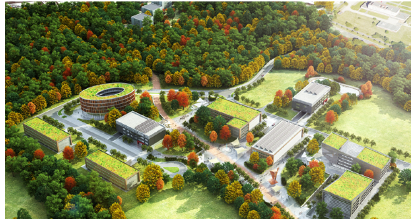
Vizualizace rozšíření VTP v Porubě

„Rozšíření VTP je pro Ostravu mimořádně důležité. Proto usiluji o to, aby