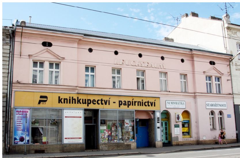
Současný stav domu s nápisem I. Buchsbaum v Nádražní ulici v ostravské čtvrti Přívoz