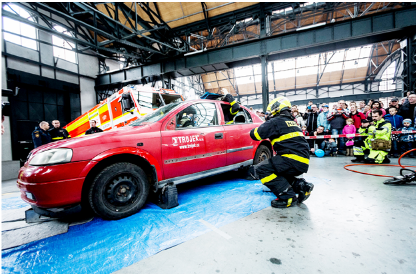
Jednou z atrakcí byly ukázky vyprošťování zraněného z havarovaného automobilu

Program výročních oslav byl bohatý a nabitý atrakcemi. V sobotu pozvala Ostravany do „krytého náměstí“ Trojhalí na Nové Karolině kolona čtyř desítek moderních i historických hasičských cisteren a speciální hasičské techniky, která projela městem. Vedle řady akcí pro děti i dospělé byly připraveny dynamické ukázky vyprošťování obětí nehody z havarovaného auta a slaňování se zraněným ze stropu haly. V neděli oslavy pokračovaly dnem otevřených dveří ve všech šesti ostravských hasičských stanicích HZS MSK. Vstup zdarma nabízelo Hasičské muzeum města Ostravy. (bk)