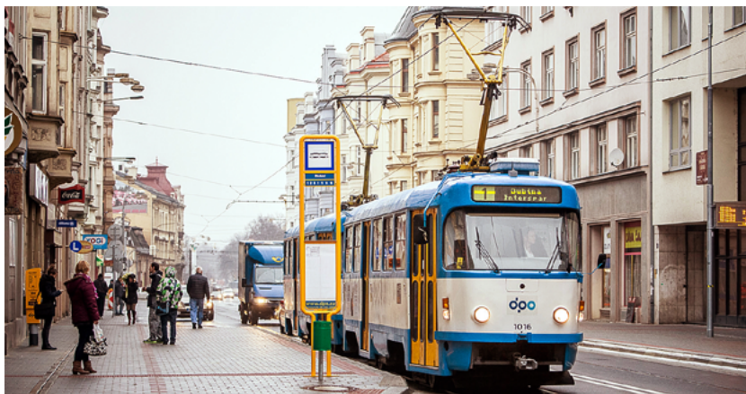
První etapa rekonstrukce Nádražní mezi zastávkou Stodolní a ulicí 30. dubna skončila

Cílem projektu je modernizace inženýrských sítí, zkvalitnění povrchu vozovky a chodníků, které byly v důsledku