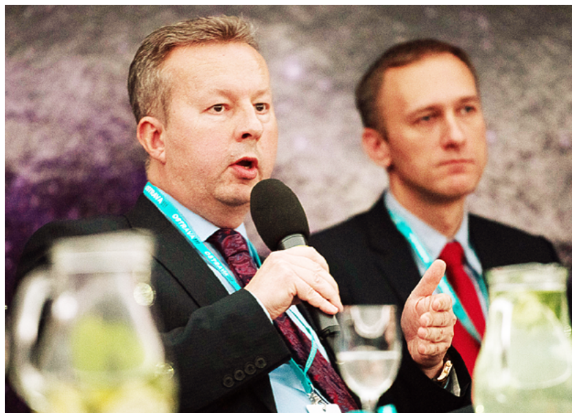
Ministr Richard Brabec při diskusi s účastníky konference