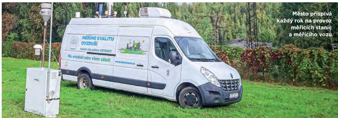
Město přispívá každý rok na provoz měřících stanic a měřícího vozu

Kromě Cen města uděluje Zastupitelstvo města Ostravy jako nejvyšší formu ocenění Čestné občanství statutárního města Ostravy. MS