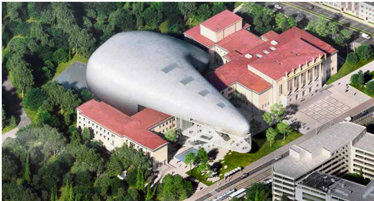
Návrh koncertní haly od studií Steven Holl Architects plus Architecture Acts.

Dvoukolové architektonické soutěže se účastnilo 34 studií z celého světa. Z nich porota vybrala šest studií a do druhého kola postoupila čtyři studia.