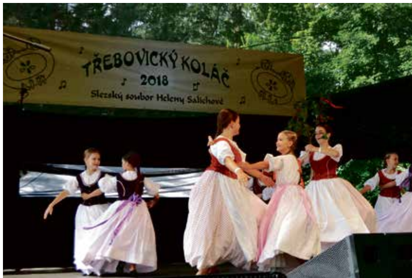
Taneční vystoupení na Třebovickém koláči.

Nedělní program bude zahájen v 10 hodin mší svatou. Program bude pokračovat cimbálovou muzikou Lipka, zahraje Prague Cello Quartet nebo zatančí Slezský soubor Heleny Salichové.