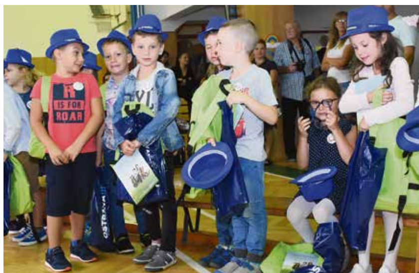
Prvnáci ze Základní školy Březinova.