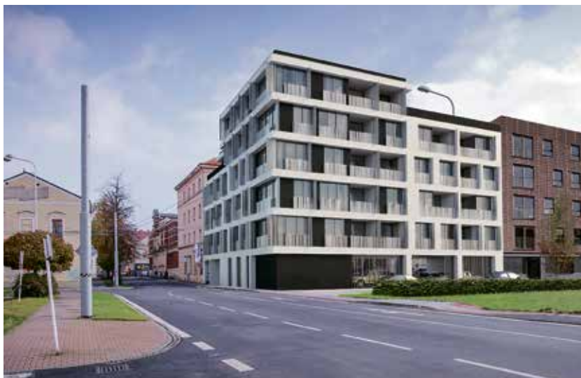
Vizualizace domu s nájemními byty v Janáčkově ulici.

V současné době probíhá rekonstrukce domu v Husově ulici, ve kterém byly kanceláře. Po rekonstrukci v něm město získá 23 nájemních bytů. (rs)