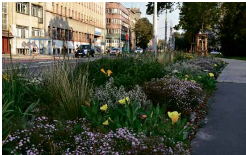
Záhon z trvalek v Sokolské třídě.

Záhony budou vysazeny v Moravské Ostravě a Přívozu, Slezské Ostravě, Mariánských Horách a Hulvákách, Os-