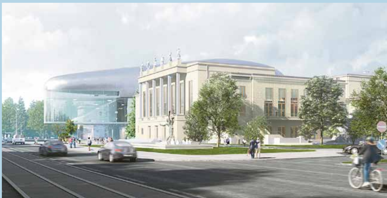
Vítězný návrh ostravské koncertní haly.