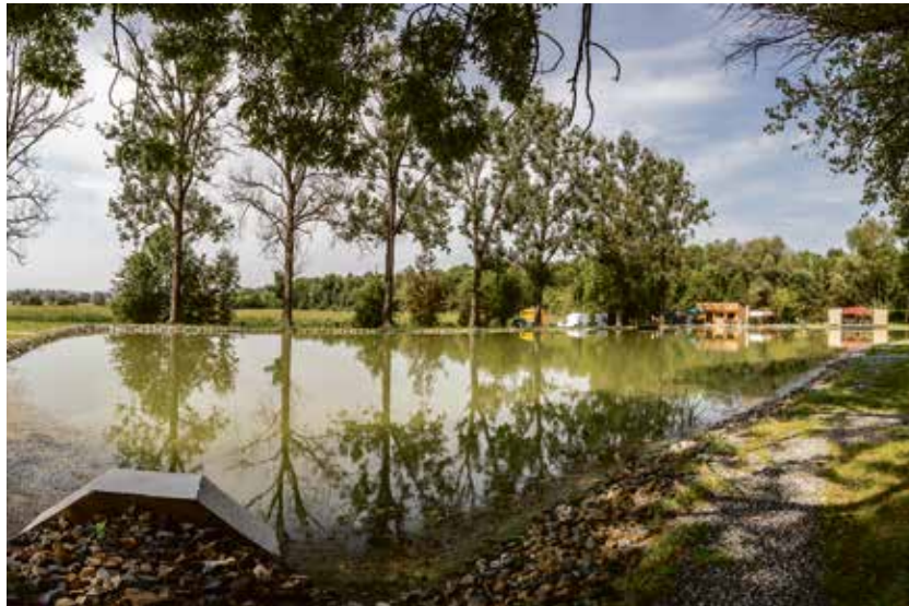
Rybníky pod Bedříškou v ostravském obvodu Nová Ves.

Rybníky získaly nové téměř kilometrové odtokové potrubí, byly odbahněny a zpevněny. Musely být opraveny vtoky a výpustě. Kolem rybníků vedou nové chodníky, prostředí zpříjemnilo 30 nově vysazených listnatých stromů a více než 100 keřů. Aby se v místě mohly konat akce, musela se nechat opravit rybářská bouda a zřídit posezení.