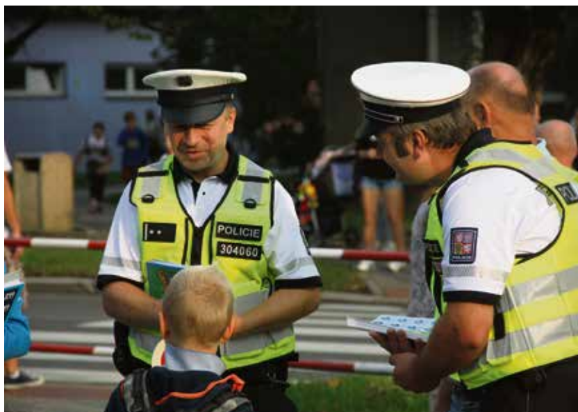
Děti by měly zvládnout bezpečný pohyb v silničním provozu.

Dítě musí vědět, že nesmí vstupovat do vozovky před tím, než se pořádně rozhlédne na obě strany a přesvědčí se, že je přejít bezpečné. V případě příjezdu vozidla by mělo dítě s řidičem navázat oční kontakt a až se ubezpečí, že jej řidič skutečně pouští, rychle přejít na druhou stranu. Naučte