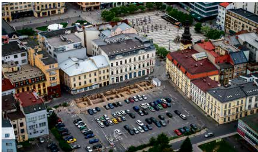
Pohled na proluku s parkovištěm, kterou prozkoumají archeologové.

Archeologové zatím prozkoumali přední část u Velké ulice, nyní je čeká zbývající část proluky, kde byly domky, studny a dvorky. „Těšíme se, až odkryjeme tuto část. Očekáváme tam nejzajímavější nálezy,“ uvedl ředitel Národního památkového ústavu Milan Zezula. Plocha Nových laubů je po Masarykově náměstí nejvýznamnější ostravskou archeologickou lokalitou. (rs)