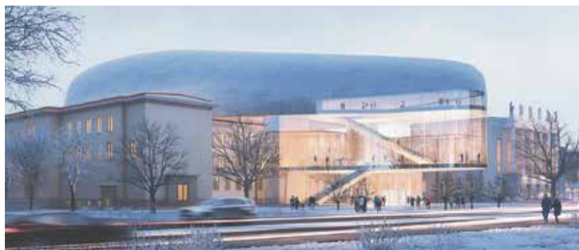
Další z vizualizací ostravské koncertní haly.