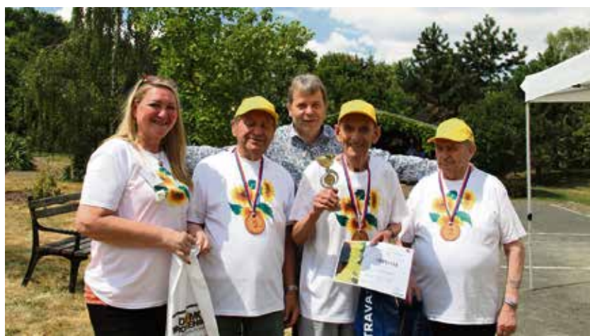
Stříbrný tým Domova Slunečnice obsadil druhé místo.

Turnaj ovládl tým Domova Bílá Opava před domácím Domovem Slunečnice a Domovem Na zámku z Kyjovic. Všechna tři družstva postoupila do moravského kola Pétanque Morava Cup, které se konalo 22. srpna ve Zlíně. A soutěžící z Domova Slunečnice podali skvělý výkon a skončili druzí za Brnem. (rs)