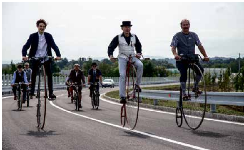
Jako první si silnici vyzkoušeli cyklisté z Klubu českých velopedistů v Hrabové.

„Každé dopravní odlehčení ve městě je velmi vítané nejen pro řidiče, ale také pro obyvatele. Ostrava přispěla