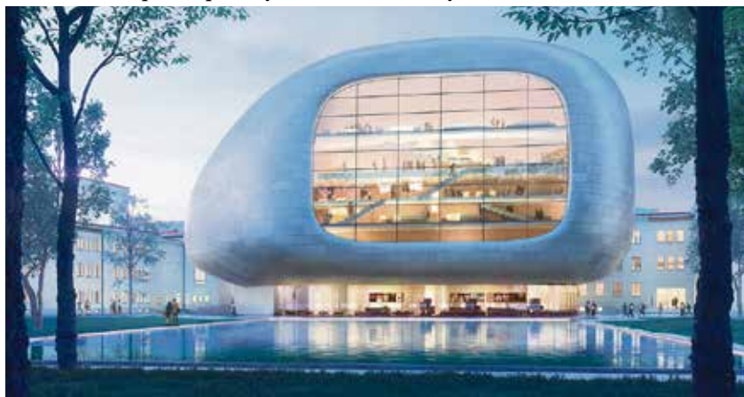
Pohled na koncertní halu ze sadu Dr. Milady Horákové.

V toto směru není zanedbatelný ani ekonomický přínos pro město související s vyššími tržbami od návštěvníků koncertů anebo větším vytížením ubytovacích kapacit. Dá se očekávat, že mimoostavští návštěvníci si prohlédnou i další ostravské atrakce, jako Dolní oblast Vítkovice, vyhlídkovou věž Nové radnice či galerie. (rs)