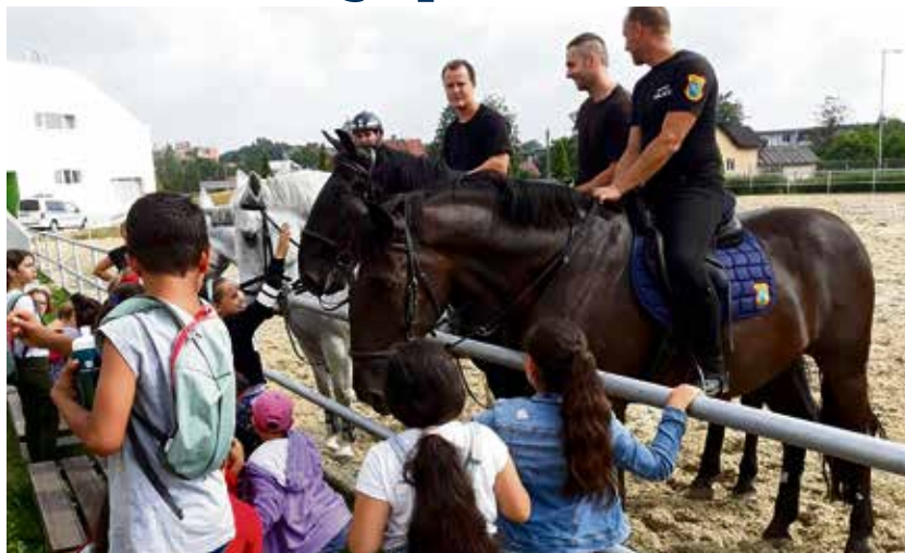
Hipologie patří k nejoblíbenějším zájmovým oblastem táborníků.

Strážníci a asistenti prevence kriminality se snažili zvýšit u dětí právní vědomí, prohloubit osobní zodpovědnost, zmírnit napětí mezi majoritou a minoritou i získat důvěru v uniformu. „Příměšťák“ byl realizován díky finanční podpoře poskytnuté městem Ostrava. Činnost asistentů prevence kriminality je financována v rámci realizace projektu „Posílení prevence