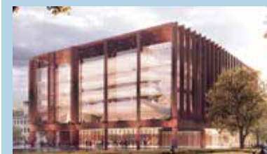
4. místo: Konior Studio.