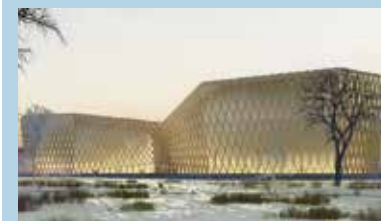
3. místo: Architecture Studio.