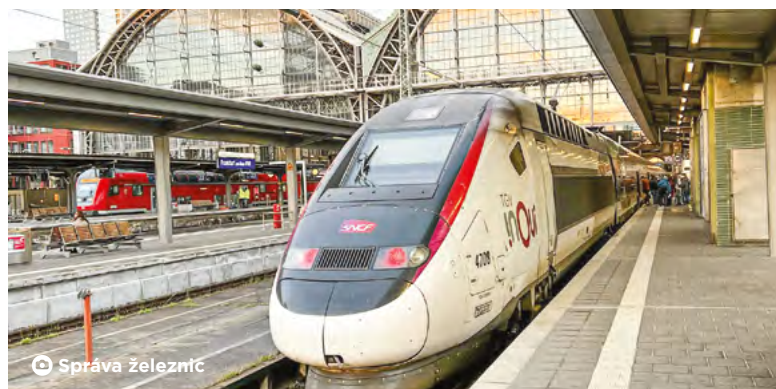
Vlaky na vysokorychlostních tratích vyvinou rychlost až 320 kilometrů za hodinu po vzoru francouzských TGV.