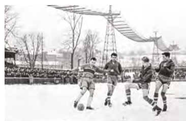
▲ Fotbalové utkání Baník Ostrava - White Star Brusel (Belgie) 20. dubna 1951 na Staré střílnici. Nad hlavami hráčů průmyslová lanovka dopravující uhlí z dolu Trojice na koksovnu Karolina.