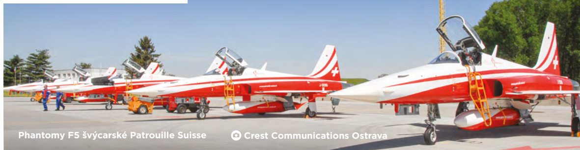
Phantom F5 švýcarské Patrouille Suisse

Mezi nejočekávanější události jistě patří premiérová účast brazilského transportního letounu C-390 Millennium. Vůbec poprvé nad Ostravou předvedou své dechberoucí pilotní umění letci ze švýcarské Patrouille Suisse