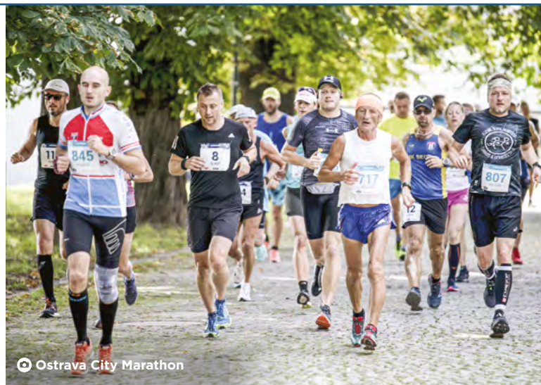
Ostrava City Marathon

Tradicí běhu jsou účastnické medaile, novinkou je naopak řazení do koridorů. Chybět nebude ani dobrá