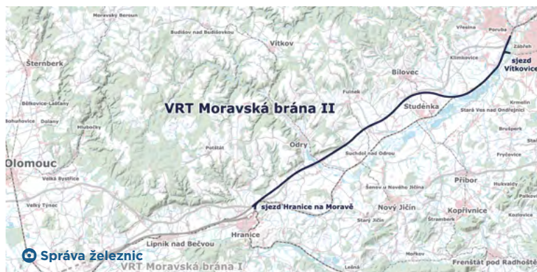
Pod Svinovem je plánován sjezd na Vítkovice, aby vysokorychlostní vlaky obsloužily další části regionu.