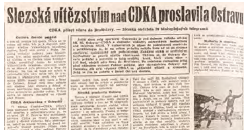
▲ Ohlas na vítězství SK Slezské Ostravy nad CDKA Moskva. Deník Nová svoboda 7. listopadu 1947.