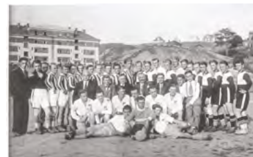
▲ Mužstvo SK Slezská Ostrava na svém hřišti na Kamenci, 20. léta 20. století.

Mistrem Československa se klub už jako Baník Ostrava stal v letech 1976, 1980 a 1981, mistrem ČR byl v roce 2004. Československý nebo Český pohár vyhrál v letech 1973, 1978, 1979, 1991 a 2005. V roce 1979 se probjoval do semifinále Poháru vítězů pohárů, o dva roky později byl ve čtvrtfinále Poháru mistrů evropských zemí, v roce 1974 hrál čtvrtfinále Poháru UEFA.