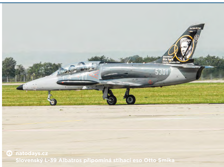
natodays.cz Slovenský L-39 Albatros připomíná stíhací eso Otto Smika

Veškeré informace naleznete na www.natodays.cz . MS