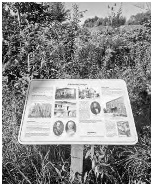
Informační panel a místo, kde stával koblovský mlýn.