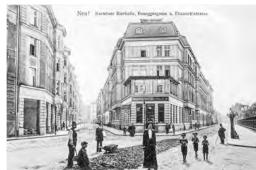
Karvinská pivnice se nacházela v domě č. p. 692 na rohu dnešních ulic Českoobrabské a Chelčického.

ských pivovarů. Snad jen jejich druhová skladba nebyla tak pestrá, na jakou jsme zvyklí dnes. Nejčastěji se tehdy pily ležáky, včetně břežňáků a kozlů, slabší výčepní piva a tmavá piva. Jen výjimečně se na nápojovém lístku objevila specialita typu anglického portera.