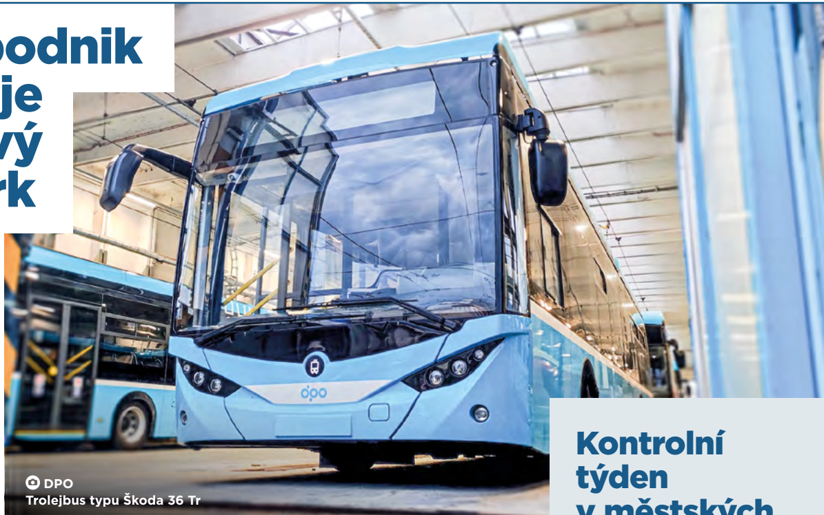
DPO Trolejbus typu Škoda 36 Tr

„DPO má 66 trolejbusů, všechny nízkopodlažní. Po dodání aktuálně poptávaných vozů bude polovina