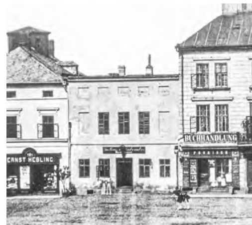
Takto vypadal původní hostinec radvanického pivovaru na Hlavním náměstí v osmdesátých letech 19. století.