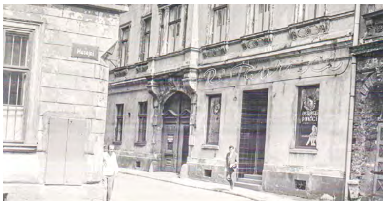
Pivovarská pivnice měšťanského, respektive Strassmannova pivovaru fungovala nepřetržitě od výstavby pivovaru v roce 1843 až do jeho likvidace v polovině šedesátých let 20. století.