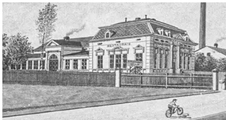
Slavnostní otevření Pivovarské restaurace Českého akciového pivovaru na Cihelní ulici se konalo v neděli 6. srpna 1899.