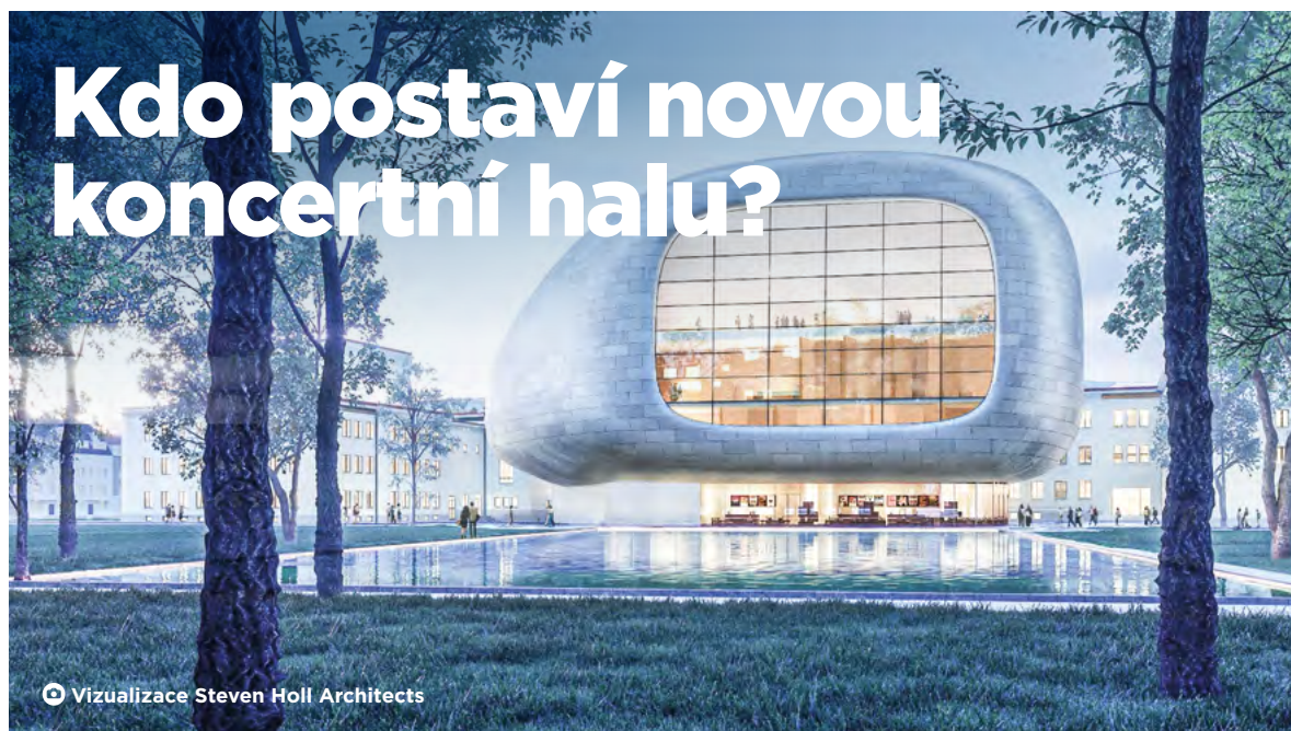
Vizualizace Steven Holl Architects

S prvním listopadovým dnem uplynula lhůta pro podání nabídek stanovená v rámci zadávacího řízení veřejné zakázky projektu „Koncertní hala města Ostravy – výběr zhotovitele stavby – fáze 2“, tedy rekonstrukce Domu kultury města Ostravy a přístavby koncertního sálu