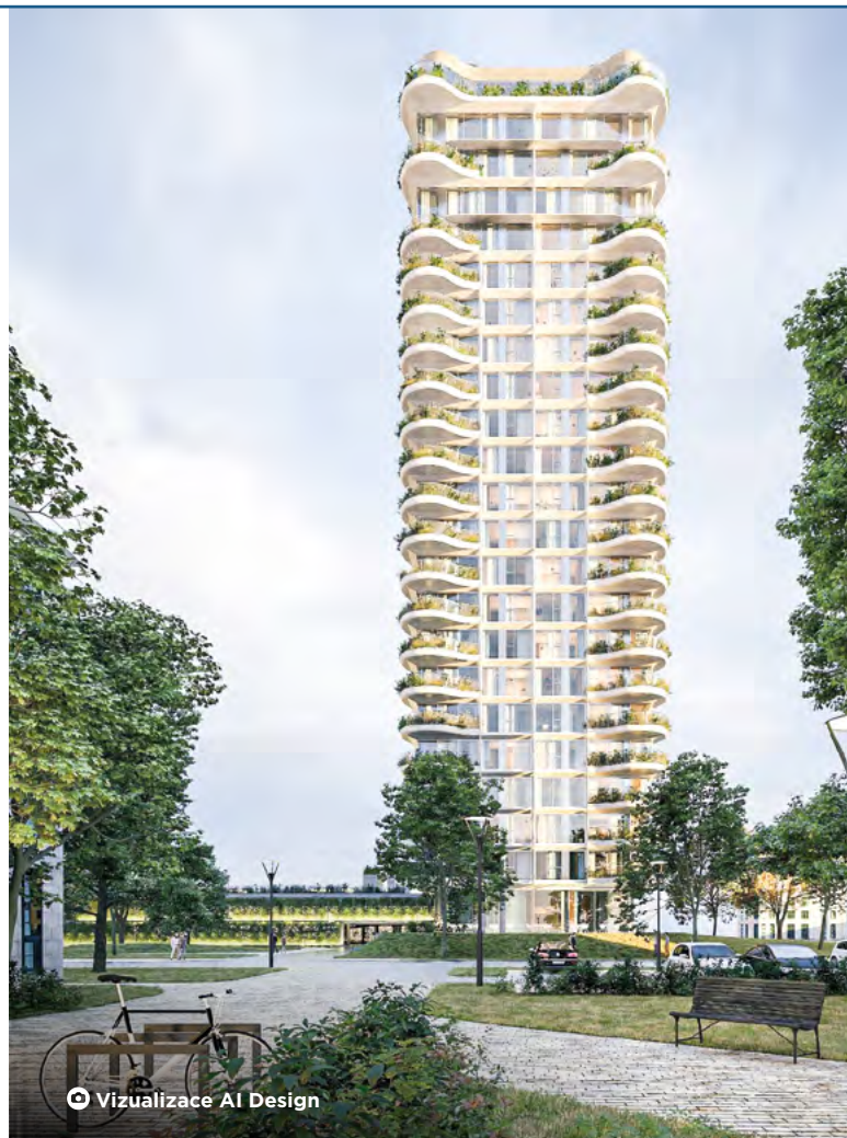
Vizualizace AI Design

Architektonický návrh řešení „ostravského mrakodrapu“ pochází z let 2020–2021. MS