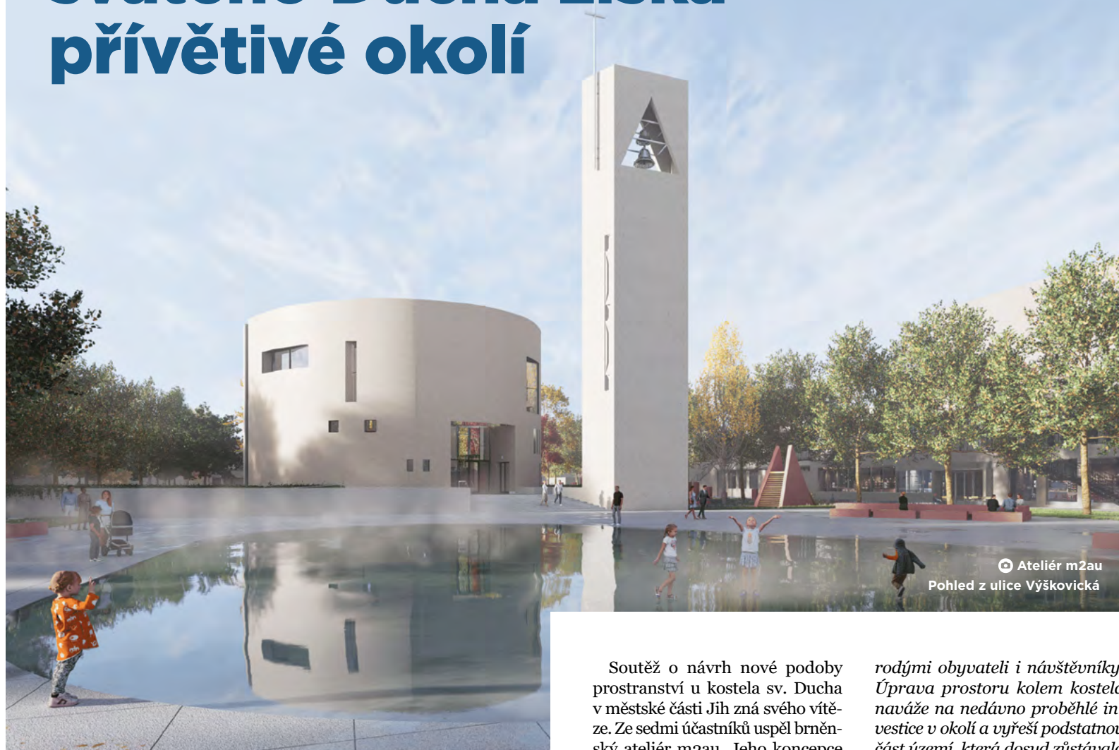
Ateliér m2au Pohled z ulice Výškovická