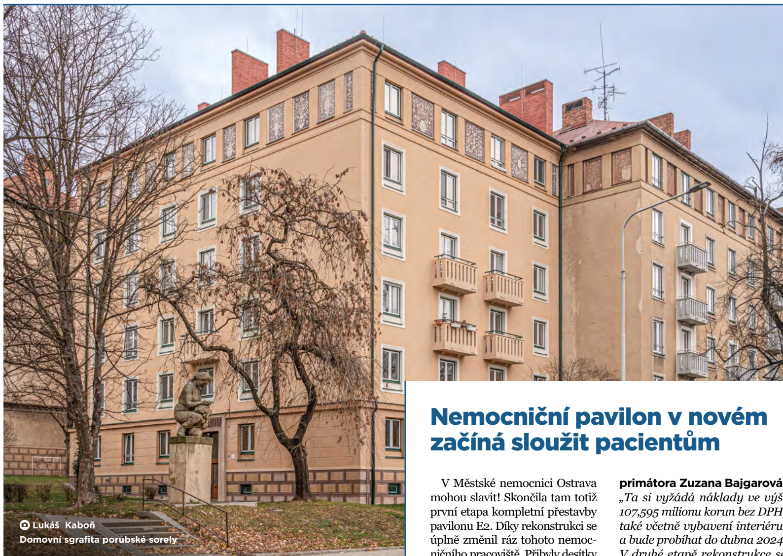
📍 Lukáš Kaboň Domovní sgrafita porubské sorely