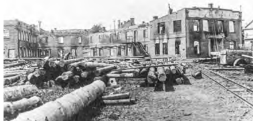
Areál firmy po osvobození v roce 1945