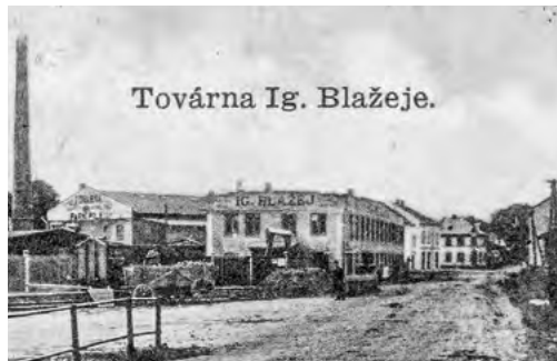
Továrna na nábytek v meziválečném období