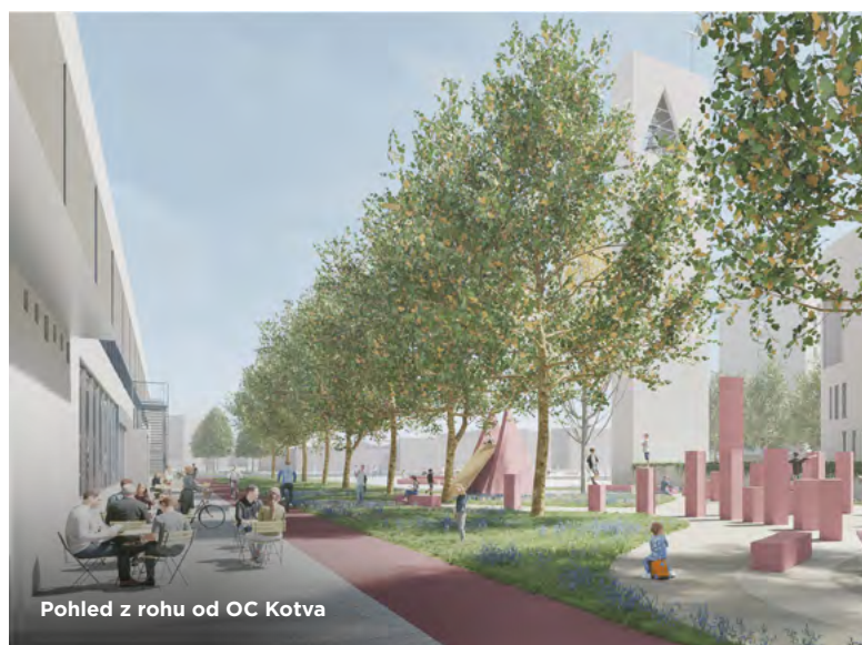
Pohled z rohu od OC Kotva

Soutěž o návrh nové podoby prostranství u kostela sv. Ducha v městské části Jih zná svého vítěze. Ze sedmi účastníků uspěl brněnský ateliér m2au. Jeho koncepce zvýrazňuje chrám coby místní dominantu a počítá s nápaditou proměnou veřejného prostoru, který k němu přiléhá.