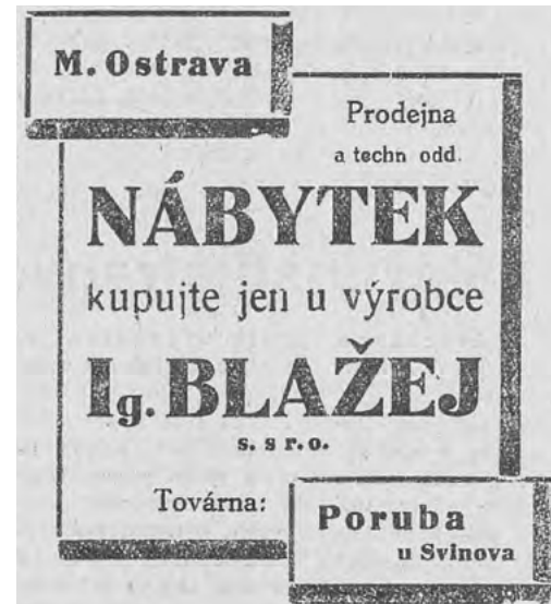
Reklama firmy Blažej z roku 1931