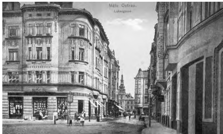
Otto Blüh bydlel s rodiči v rohovém domě (druhý zleva) na dnešní Poštovní ulici v centru Ostravy. V pozadí stará radnice (dnes Ostravské muzeum) na Masarykově náměstí.