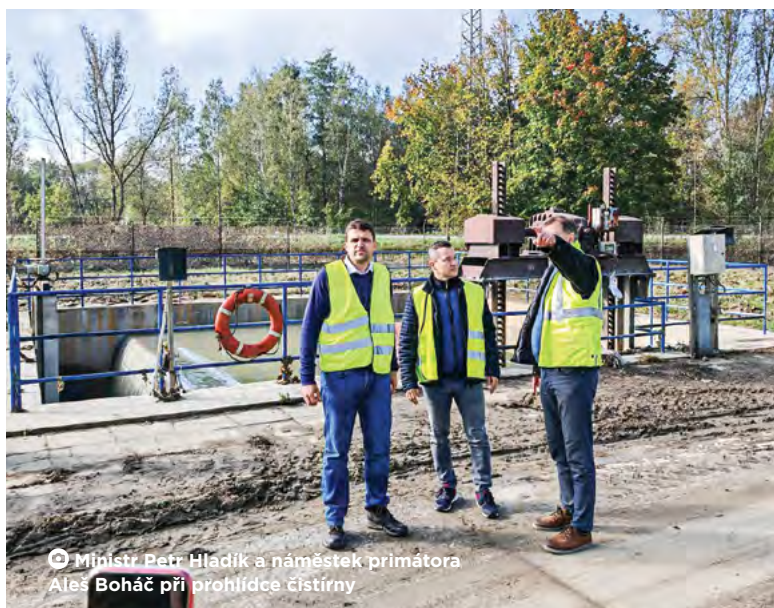
© Ministr Petr Hladík a náměstek primátora Aleš Boháč při prohlídce čistírny

Záříjové povodně těžce poškodily Ústřední čistírnu odpadních vod v Přívoze, největší svého druhu v kraji a třetí největší v rámci ČR. Finanční výše škod dosahuje bezmála 600 milionů korun. Vlastník čističky město Ostrava již požádalo o dotaci na jejich likvidaci. Zároveň apeluje na všechny, aby do odpadu neházeli, co do něj nepatří, a respektovali pravidla kanalizačního řádu.