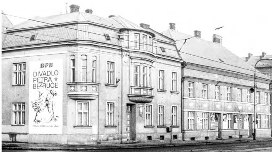
Pohled na správní budovy Divadla Petra Bezruče, 1976, divadlu sloužila i budova č. p. 1509 (na fotografii vlevo), budova Blaníku č. p. 1701 (na fotografii vpravo) byla v tomto období správní budovou divadla, představení probíhala v Domě kultury.