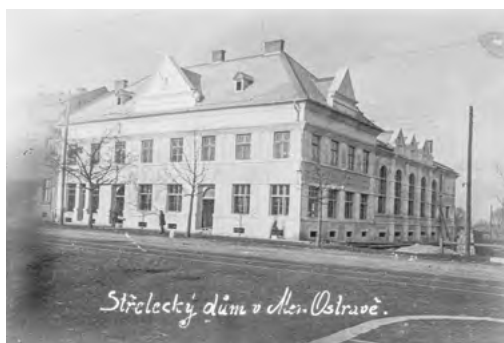
Střelecký dům, 2. polovina 20. let 20. století.

V květnu 1924 zažádal spolek První jednota českých střelců v Moravské Ostravě o povolení stavby spolkového domu u tehdejší Palackého třídy (dnes 28. října) nedaleko městského hřbitova. Ve spolkovém domě se kromě střelnice umístěné v suterénu měly nacházet v přízemí obchodní prostory, velký společenský sál s jevištěm a galerií, počítalo se zde i s restaurací a společenskými místnostmi, v patře byly byty. Dům byl v prosinci 1924 pod č. p. 1701 zkolaudován, náklad na stavbu dosáhl 1 milionu korun a byl hrazen pomocí hypotéky. Spolek rovněž požádal o povolení hostinské a výčepnické koncese, která měla zajišťovat obsluhu při schůzích a zábavách ve střeleckém domě pořádaných jednotou nebo při pronájmu místností jiným spolkům.