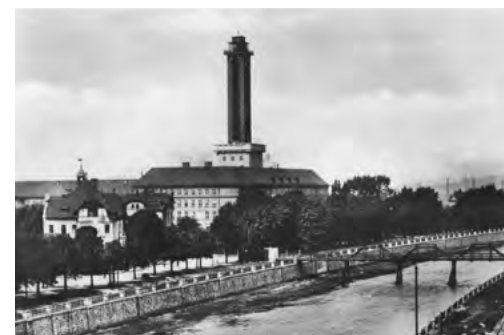
Pohled na nábřeží Ostravice s vilovou čtvrtí (vlevo) ve 30. letech 20. století ještě před výstavbou tzv. Jubilejního mostu na místě původní dřevěné lávky.