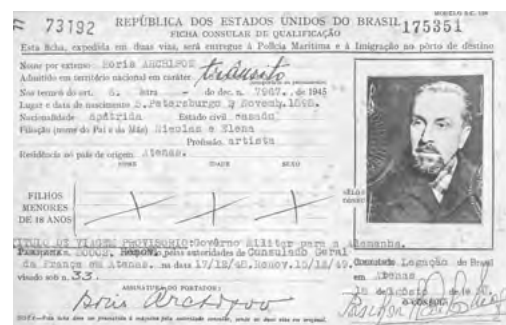
Imigrační formulář brazilského velvyslanectví v Aténách, 1950