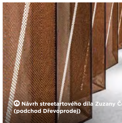
© Návrh streetartového díla Zuzany Černocké (podchod Dřevoprodej)

Další běh událostí popisuje tehdejší náměstkyně primátora Zuzana Bajgarová: „Pracovní