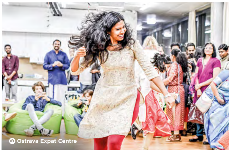
Ostrava Expat Centre

Do konce května si můžeme v muzeu Futura v Dolních Vítkovicích prohlédnout jedinečnou výstavu „Expats and Locals. Together“. Expozice nás seznámí s tvorbou deseti místních tvůrců a stejným počtem jejich zahraničních kolegů, kteří žijí v Ostravě nebo na jiných místech Moravskoslezského kraje. Kulturní a uměleckou sešlost pořádá Ostrava Expat Centre.