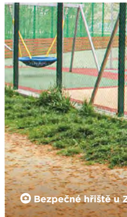
Bezpečné hřiště u ZŠ V. Košaře

„Bezpečná hřiště využívají denně stovky Ostravanů. Jde o rodiny s dětmi nebo i skupinky vesměs