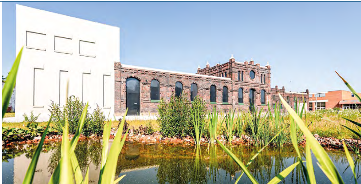
Rekonstruovaná historická jatka

Noviny jsou ke stažení v pdf na www.ostrava.cz/radnice .