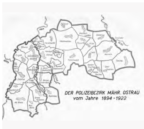
Obvod Policejního komisařství v Moravské Ostravě zahrnoval v letech 1894-1922 nejen větší část dnešních ostravských obcí, ale sahál na východě až k řece Olši po Doubravu, Stonavu a dnes již zaniklé město Karvinná (nyní městská část Karvinná-Doly).