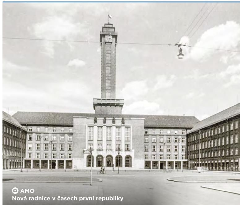
AMO Nová radnice v časech první republiky