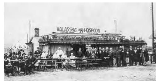
Návštěvnost byla také podpořena širokou nabídkou občerstvení, kaváren, vináren a restaurací. Na snímku hojně navštěvovaná Valašská hospoda.