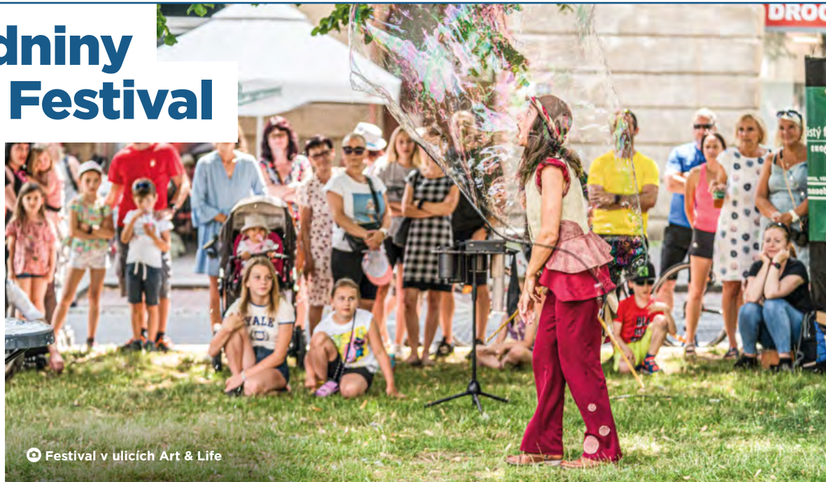
Festival v ulicích Art & Life

Hudební zážitky zprostředkuje více než dvacítku interpretů z celého světa. Mezi největší lákadla patří například kubáňští Los Pipos, němečtí jazzma-