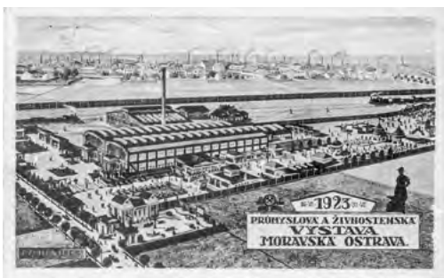
Pohlednice vydaná u příležitosti konání výstavy, 1923.

Průmyslová a živnostenská výstava v roce 1923 zůstala dodnes nepřekonána. Žádný další ostravský výstavní podnik se jejímu tehdejšímu významu ani šíři a rozsahu nedokázal přiblížit.