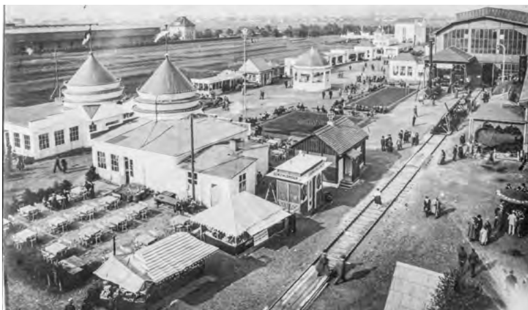
Celkový pohled na areál Průmyslové a živnostenské výstavy v Moravské Ostravě 1923.

Sto let od Průmyslové a živnostenské výstavy v Ostravě 1923