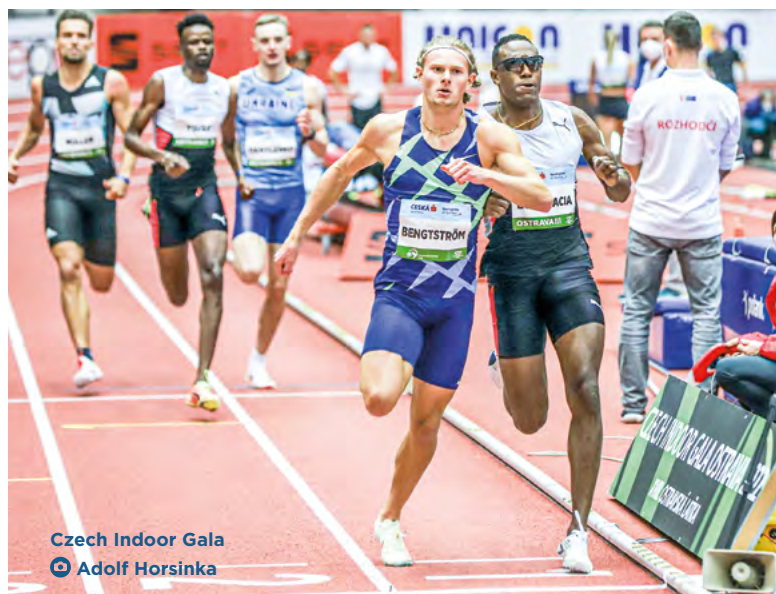
Czech Indoor Gala

Významných sportovních klání se Ostrava dočká také po letních prázdninách. MS