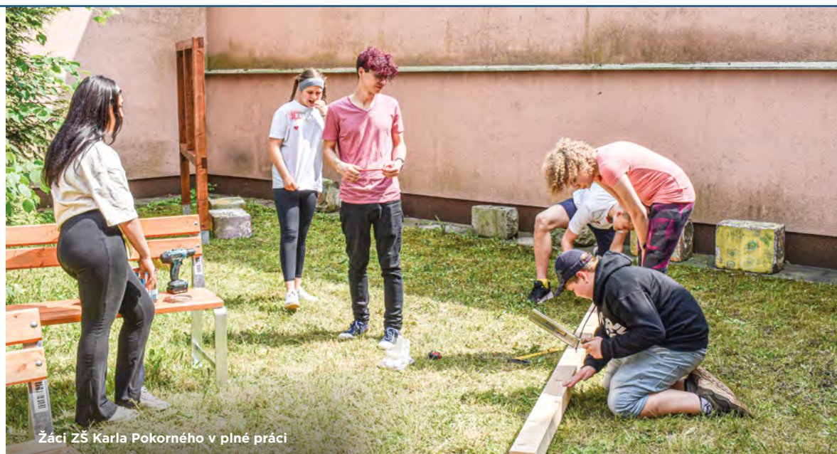
Žáci ZŠ Karla Pokorného v plné práci

Zástupci 35 škol se následně v rámci tohoto projektu zúčastnili tematického semináře, který jim poradil s úskalími sestavování participativního rozpočtu či rozvojem příslušných kompetencí a zaměřil se rovněž na související vzdělávací aktivity. Cílem bylo, aby si děti přes školní parlament navrhly, vytvořily a zrealizovaly vlastní projekty. Tak nakonec učinilo 19 škol. Odborná komise vybrala 9 žádostí, jejichž autorům ostravský magistrát rozdělil k uskutečnění projektu 100 tisíc ko-