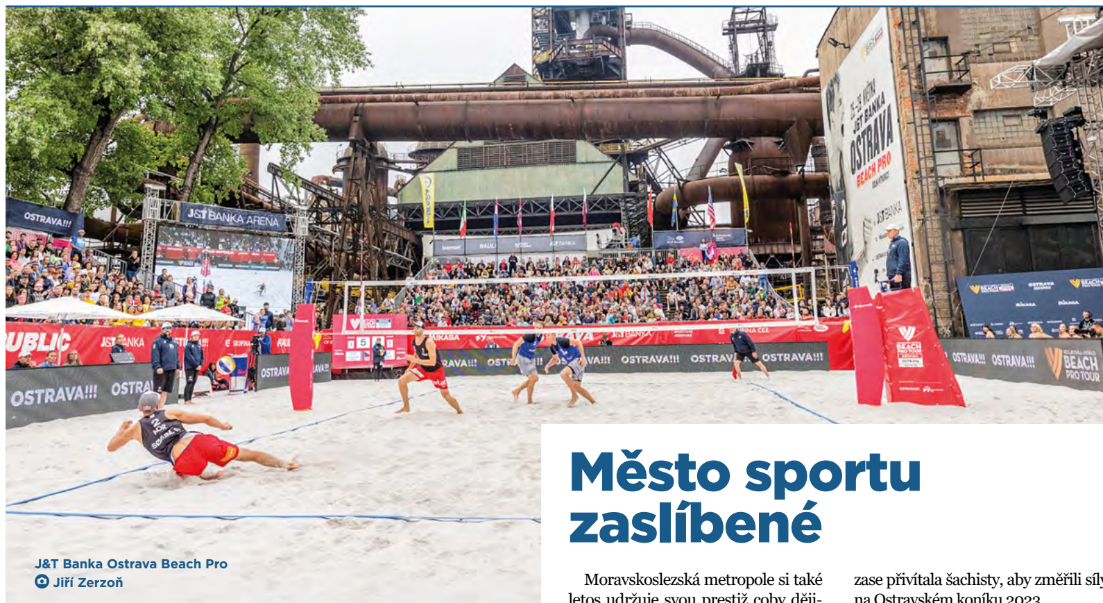
J&T Banka Ostrava Beach Pro