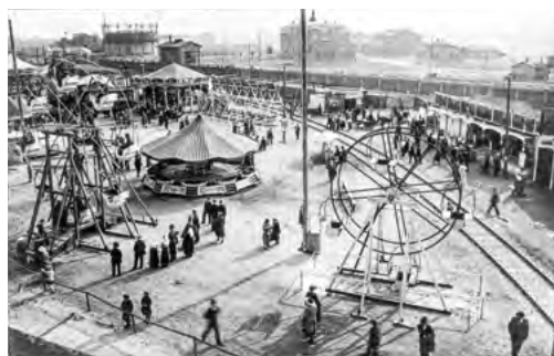
Odpočinková a zábavní část výstaviště.