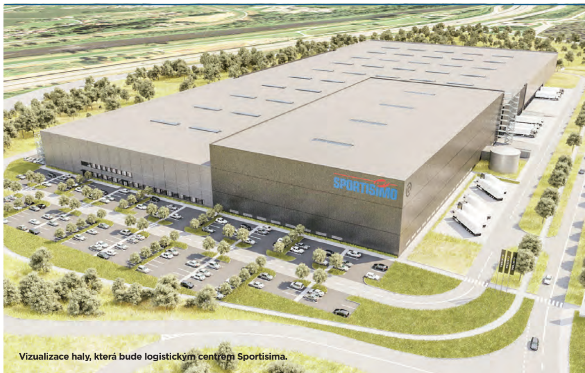
Vizualizace haly, která bude logistickým centrem Sportisima.