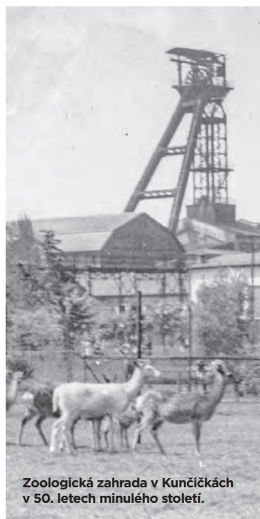
Zoologická zahrada v Kunčičkách v 50. letech minulého století.