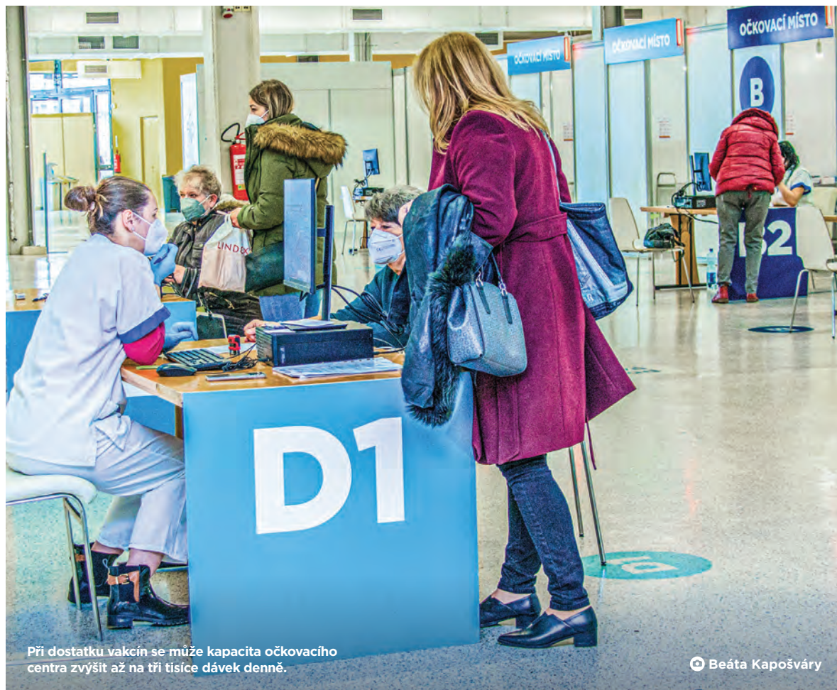
Při dostatku vakcín se může kapacita očkovacího centra zvýšit až na tři tisíce dávek denně.