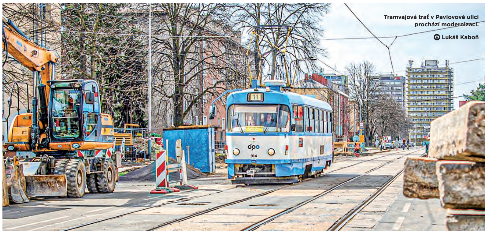
Tramvajová trať v Pavlovově ulici prochází modernizací.