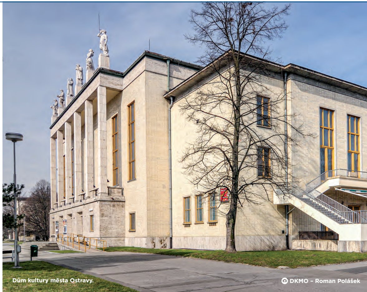
Dům kultury města Ostravy.