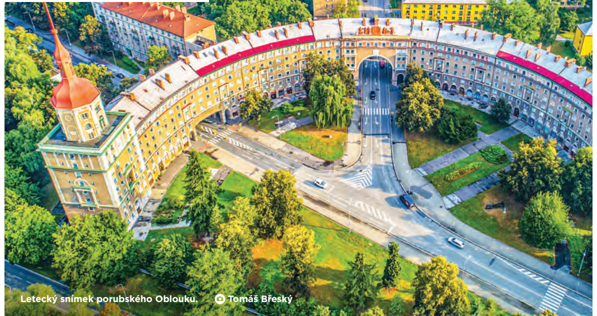
Letecký snímek porubského Oblouku.

Novu fasádu získá 11 vchodů, které jsou majetkem Poruby. Poslední dvánáctý vlastní bytové družstvo, které na členské schůzi odmítlo opravy, i když existoval dotační titul. Takže tento vchod s věžičkou se opravovat nebude. Plechovou střechu nahradí tašky, půdy budou zatepleny, musí být provedena hydroizolace budovy,