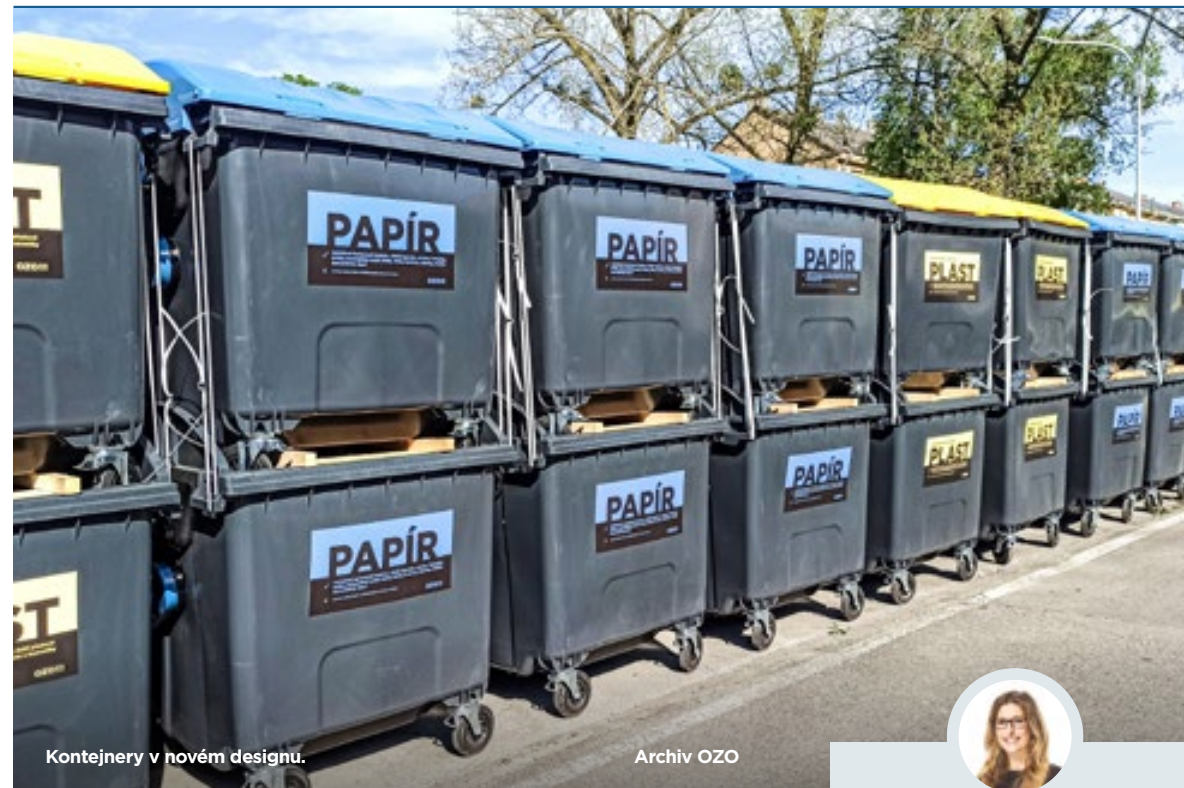
Kontejnery v novém designu.