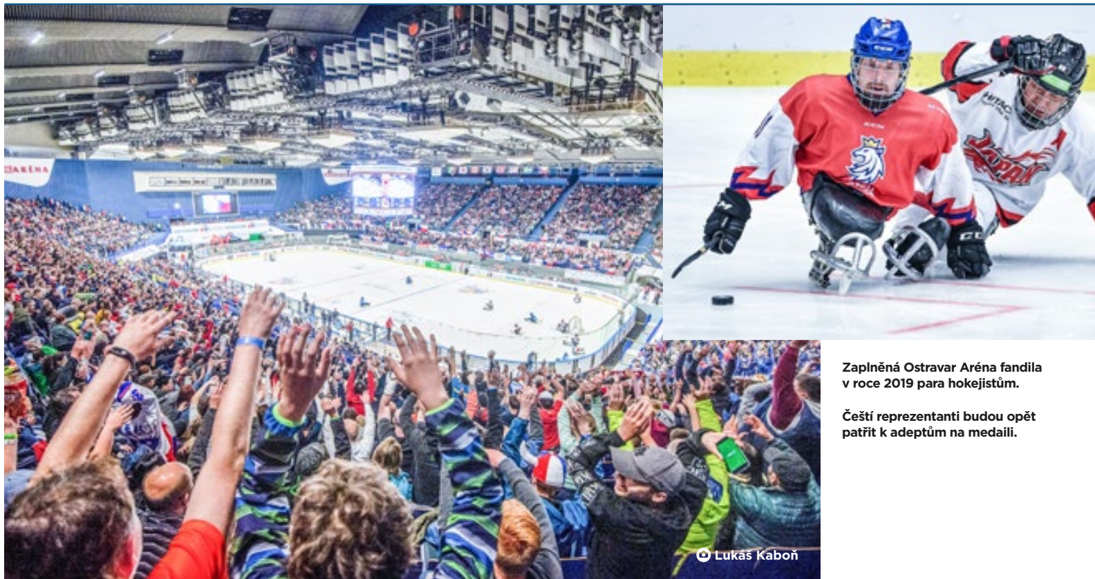
Zaplňená Ostravar Aréna fandila v roce 2019 para hokejistům.

Čeští reprezentanti budou opět patřit k adeptům na medaili.