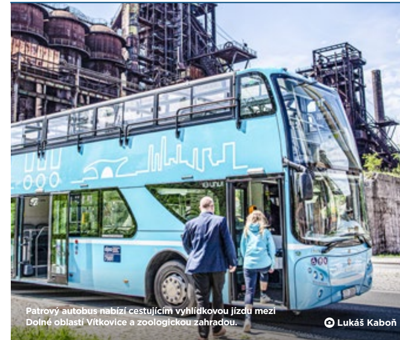
Patrový autobus nabízí cestujícím vyhlídkovou jízdu mezi Dolní oblastí Vítkovice a zoologickou zahradou.

Výuka na dětských dopravních hřištích je v současné době podle našich zkušeností nejúčinnější formou dopravní výchovy dětí a osvědčenou prevencí bezpečnosti silničního provozu. Proto jsme se rozhodli zajišťovat ji nejen pro žáky třetích a pátých ročníků základních škol, ale opět ji i v letošním roce rozšířit také pro děti z mateřských škol, ze speciálních mateřských škol a z prvních a druhých tříd základních škol. K dopravní výchově se žáci i předškoláci dostávají poté, co se v souvislosti s vládním rozvoňováním postupně vrátí do lavic nebo školek.“ Náměstek primátora pro dopravu Vladimír Cigánek.