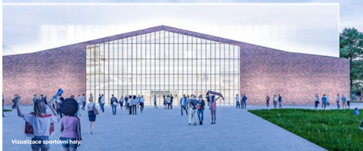
Vizualizace sportovní haly.

Příprava nové multifunkční sportovní haly na Fifejdách je v plném proudu. Vznikne v prostoru bývalého autobusového depa. Návrh architekti počítá s kombinací částí původní průmyslové architektury a moderních prvků. Halu postaví a bude provozovat Spolek na podporu sportu, dětí a mládeže. Jeho členy jsou statutární město Ostrava, Moravskoslezský kraj a společnost ČSAD Ostrava. Stavba začne v příštím roce a hala bude dokončena v roce 2024.