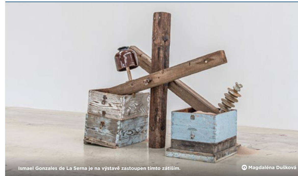
Ismael Gonzales de La Serna je na výstavě zastoupen tímto zátiším.

Muzeum, které sídlí v budově ČSAD za autobusovým nádražím, je otevřeno denně od 9 do 17 hodin. RS