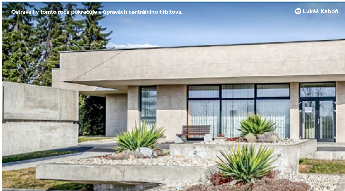
Ostrava i v tomto roce pokračuje v úpravách centrálního hřbitova.