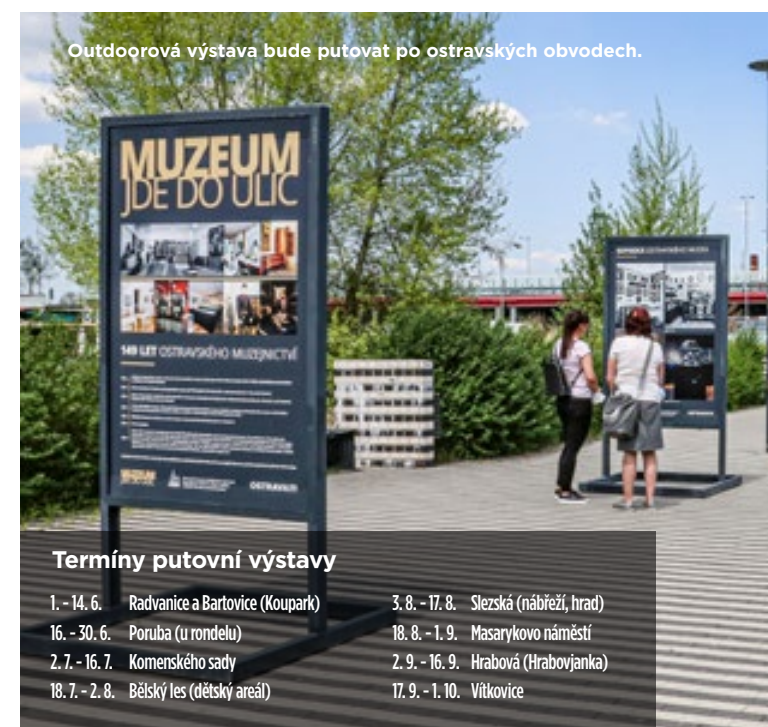
Outdoorová výstava bude putovat po ostravských obvodech.