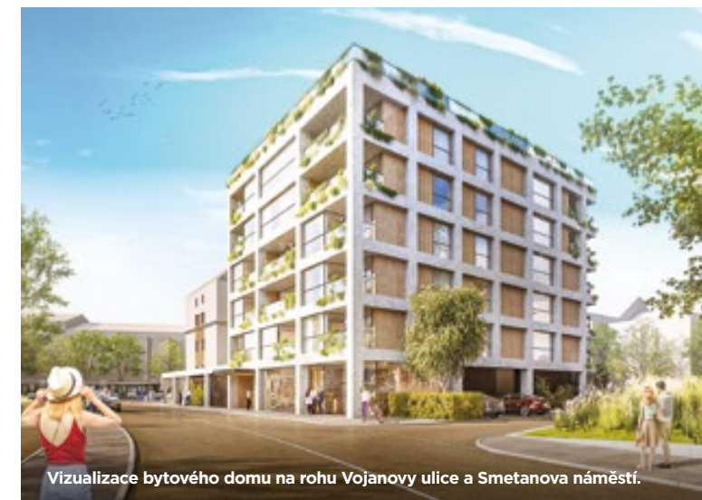
Vizualizace bytového domu na rohu Vojanovy ulice a Smetanova náměstí.

Bytový dům s komfortním bydlením v centru města vyroste na nároží Vojanovy ulice a Smetanova náměstí v Moravské Ostravě na pozemku, jehož prodej soukromému investoři – společnosti Promet, schválili zastupitelé na květnovém zasedání.