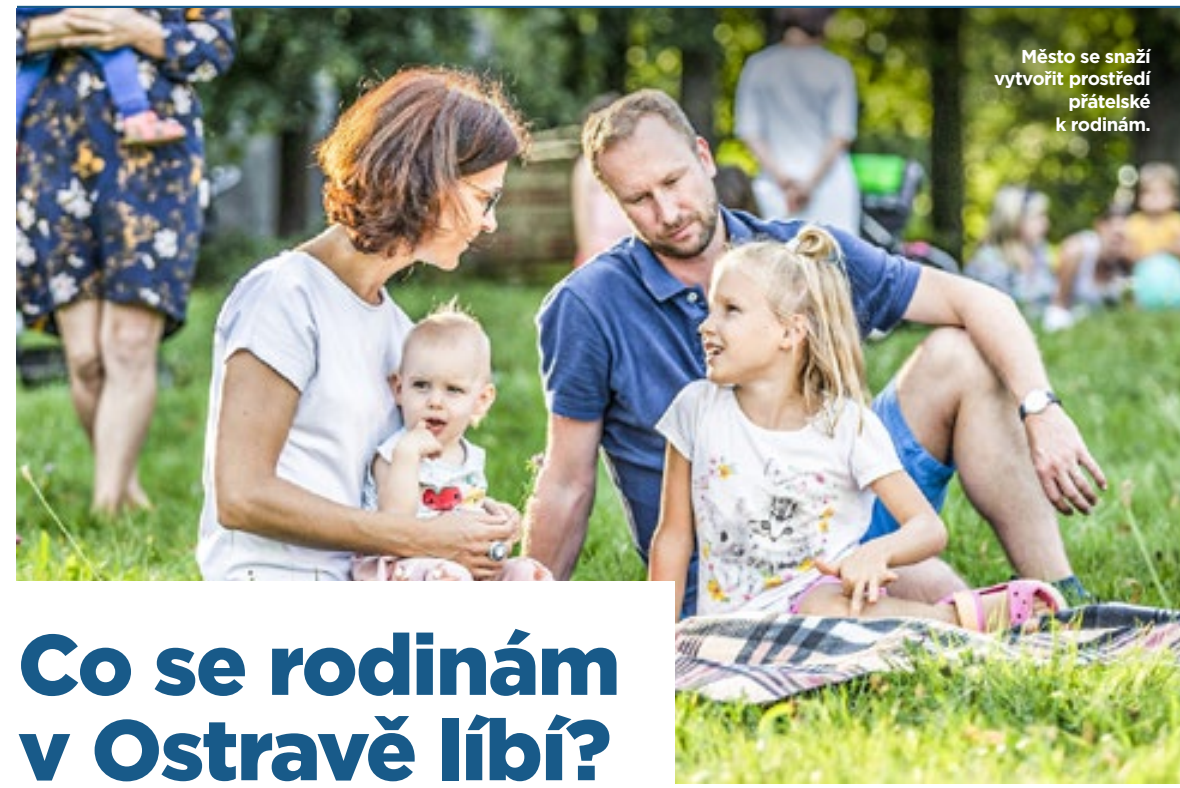
Město se snaží vytvořit prostředí přátelské k rodinám.

Rodinné a komunitní centrum Chaloupka ožije v neděli 20. června centrum Ostravy akcí Táta Fest 2021, která oslavuje všechny tatínky v rámci Dne otců. Letošní ročník je jubilejní 10., a proto si dává záležet na kvalitním programu pro rodiny s dětmi. Oblíbené jsou vždy společné aktivity pro táty a jejich děti. Bohatý program začne ve 14 hodin na Masarykově náměstí. HO