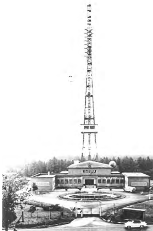
Televizní středisko Ostrava bylo prvním vysílacím střediskem u nás postavené v roce 1955 na „zelené louce“. Na věži ve výšce 30 metrů byla umístěna retranslační kabina s příhradovým zábradlím pro připevnění parabolických antén.