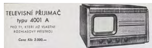
Televizor 4001 A byl prvním sériově vyráběným v letech 1953–1957 v Tesle Strašnice. Po vyrobení první série se čekalo, zda o televizi bude vůbec mezi občany zájem, a teprve po jeho vyprodání výroba pokračovala.