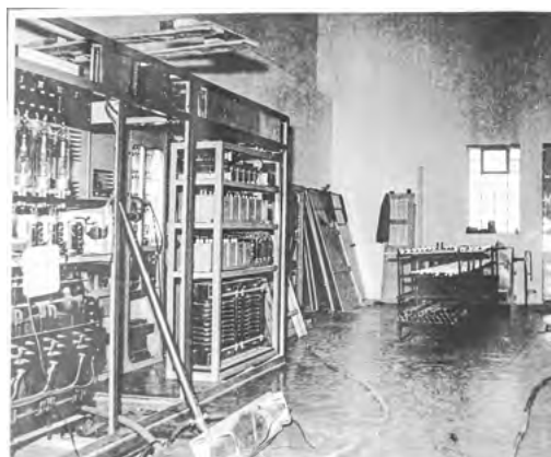
Vysílač obrazu v době montáže v budově televizního střediska. Obrazové a zvukové zařízení vlastního vysílače sestavil tým odborníků hloubětínské Tesly. Část techniků pak instalovala na anténní věži ve stometrové výšce odrazové stěny a zářiče.