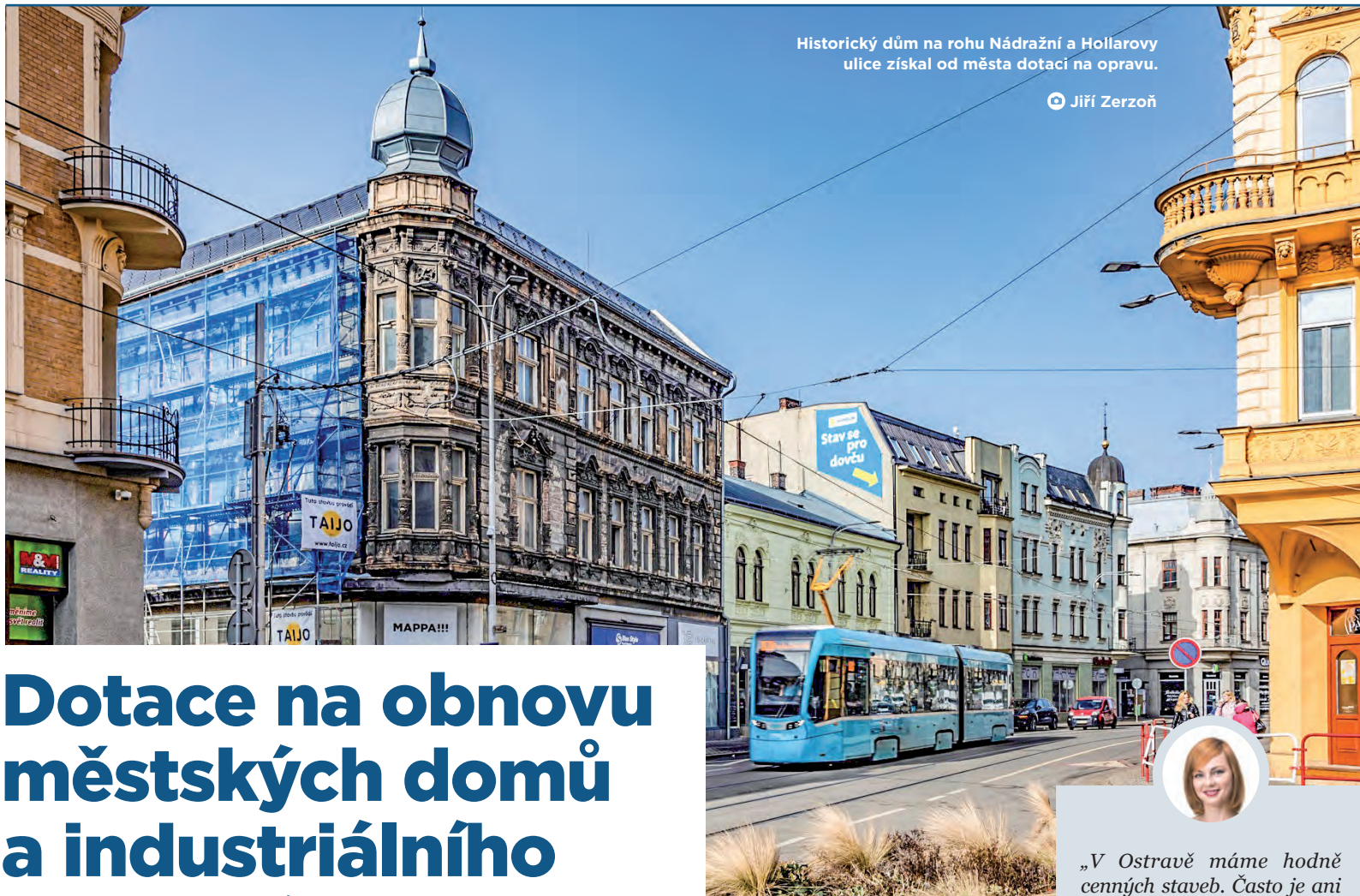
Historický dům na rohu Nádražní a Hollarovy ulice získal od města dotaci na opravu.