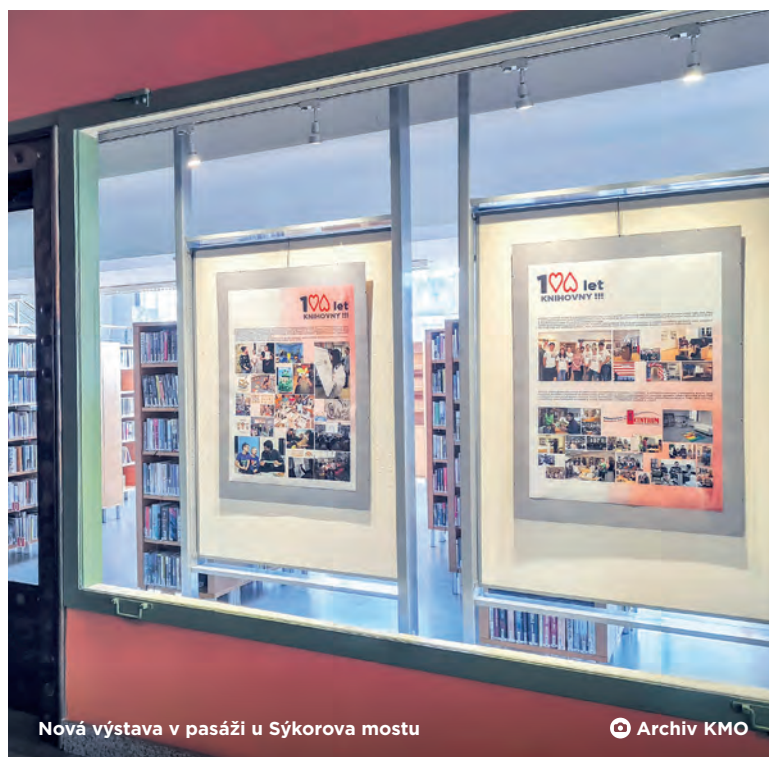
Nová výstava v pasáži u Sýkora mostu