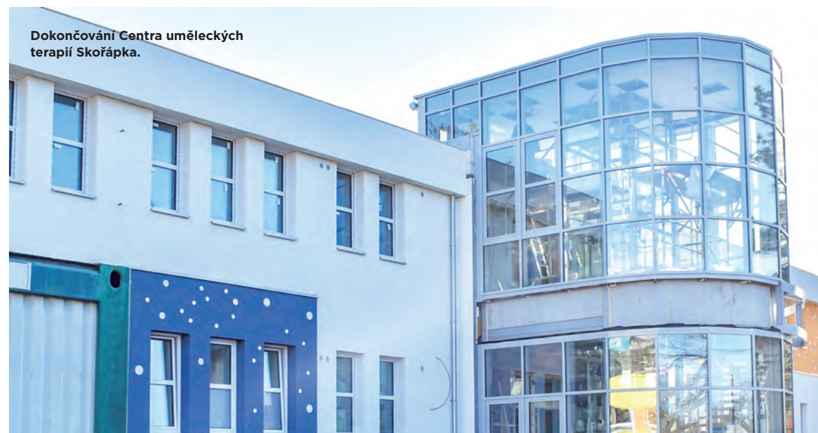
Dokončování Centra uměleckých terapií Skořápka.

Před obchodním centrem Bohemia vznikne kvalitní předprostor s posezením, hodinami a vodním prvkem.