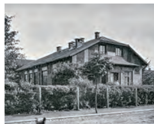
Děti a jejich hračky v mateřské škole na Karolínské ulici v Moravské Ostravě. (50. léta 20. století)

Budova mateřské školy v Šalomounské kolonii č. p. 1510.