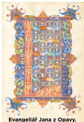
Evangeliář Jana z Opavy.

pěti částí cyklu Ó a ach, krása, ruina a strach. Kresby návštěvníci najdou kromě webových stránek Plato Ostrava také na plakátech a dalších vizuálních materiálech galerie v průběhu konání cyklu, tedy až do přestěhování galerie do zrekonstruovaných bývalých městských jatek v květnu 2022. HO