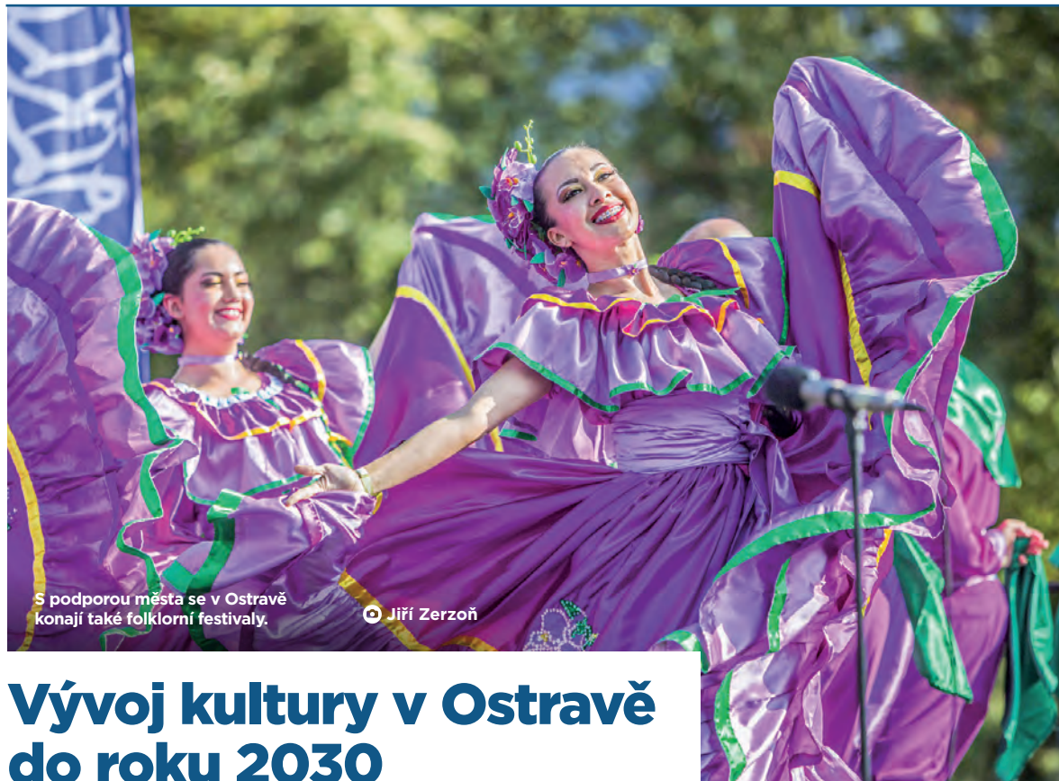
S podporou města se v Ostravě konají také folklorní festivaly.