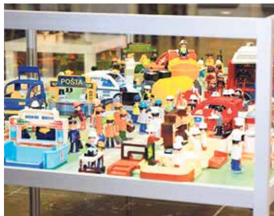
Výstava Fenomén igráček bude ke zhlédnutí v Ostravském muzeu až do konce února.

V Ostravském muzeu startuje 5. prosince projekt Muzeum plné pohádek, jehož součástí jsou tři samostatné a pohádkami doslova nabitě výstavy: Fenomén Igráček, Pohádky bratří Grimmů, Šťastný 2020. Pohyblivý Igráček – nostalgická vzpomínka pro dospělé a objevení hravého světa rodičů a prarodičů pro děti – představuje různorodé lidské činnosti, speciálně pro Ostravu byly vytvořeny unikáty horníka ve slavnostní uniformě a biskupa Bruna ze Schauenburku. Zhlédnete také 29 výjevů inspirovaných tvorbou bratří Grimmů, které jsou součástí sbírek Muzea města Drážďan. Brány království Fantazie, protentokrát nazvaného Šťastný 2020, jsou otevřeny dokořán. Vstupte! Výstavy potrvají do konce února. (hob)