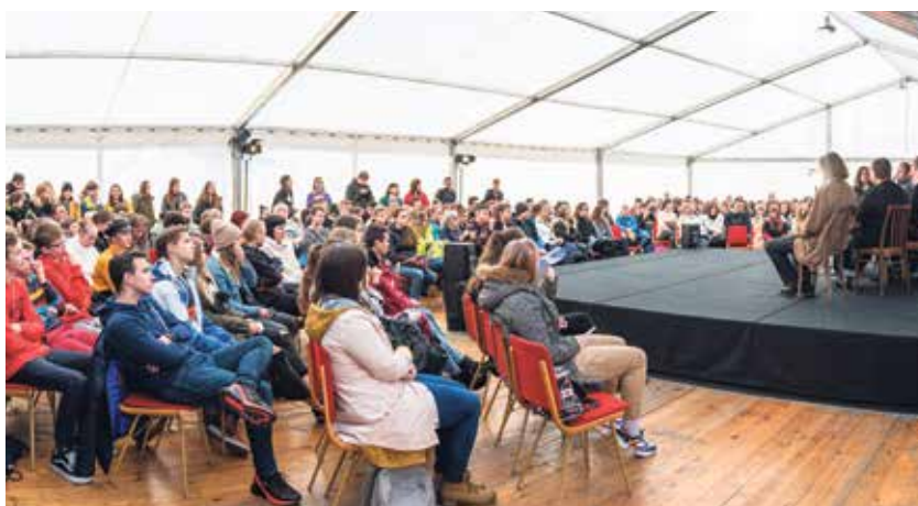
Beseda s aktéry listopadových událostí 1989 v Ostravě.