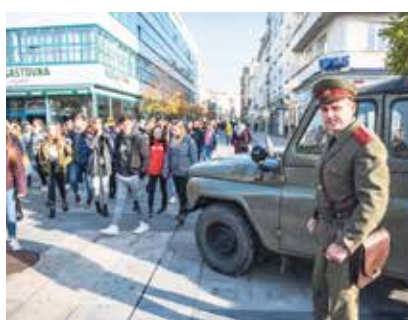
Příslušník dokreslil dobovou atmosféru.