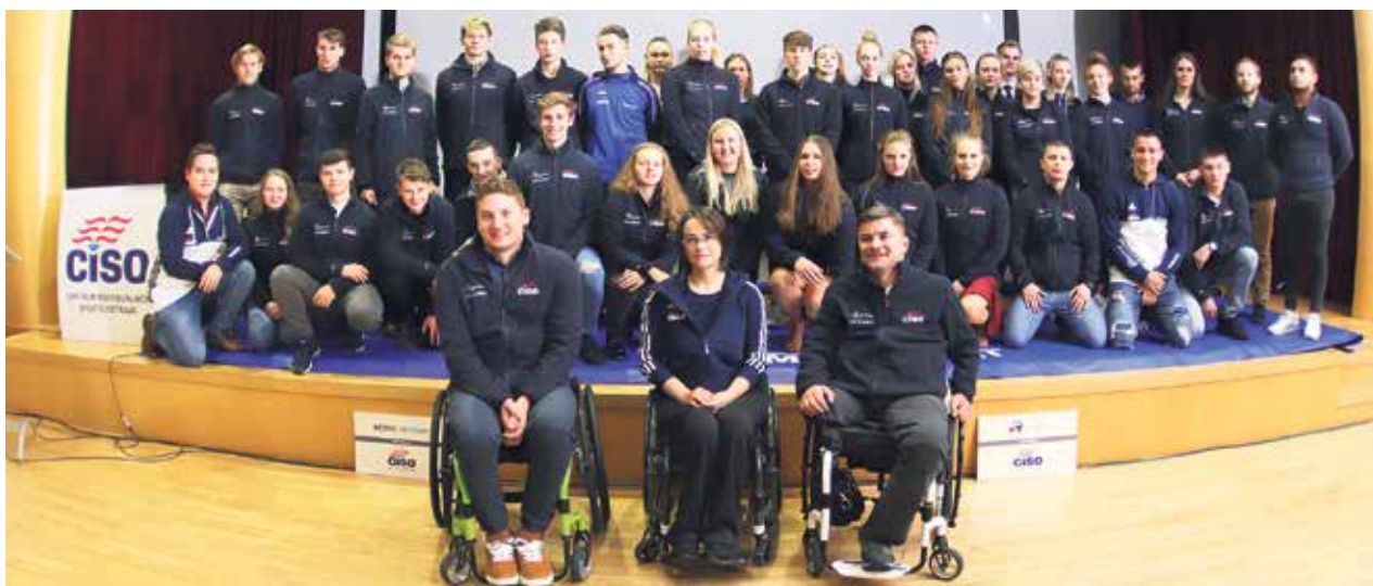
Sportovci CISO na listopadovém slavnostním vyhlášení.

Centrum individuálních sportů Ostrava (CISO) bylo založeno v roce 2005.