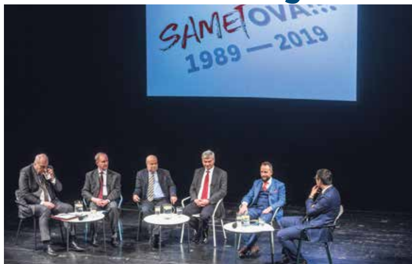
Historicky první debata všech ostravských polistopadových primátorů.