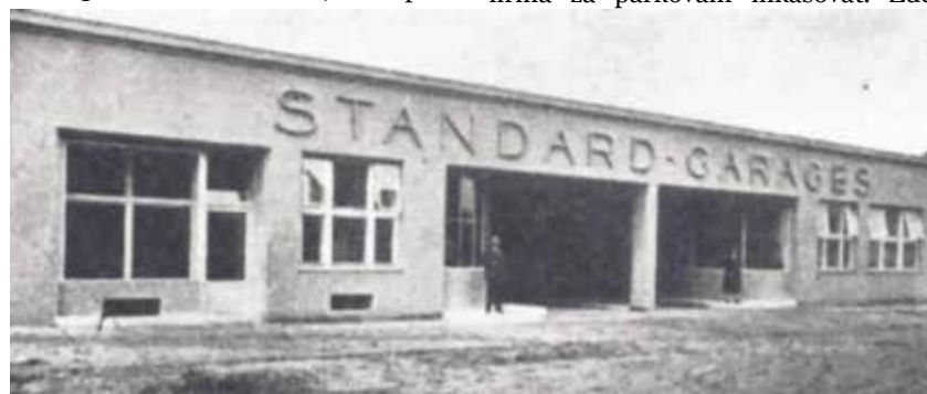
Průčelí a vjezd do objektu Garáží Standard.

to již alespoň jednu garáž. Otázkou bezpečného parkování se začalo zabývat také město a vymezilo několik oblastí, majících sloužit jako hlídaná parkoviště (mj. Masarykovo náměstí, parkoviště u Domu umění a u kostela Božského Spasitele). V této souvislosti vznikla zcela nová živnost – hlídání a garážování automobilů.