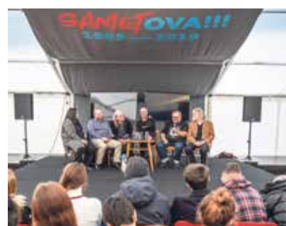
Účastníci listopadu 1989 vzpomínali.