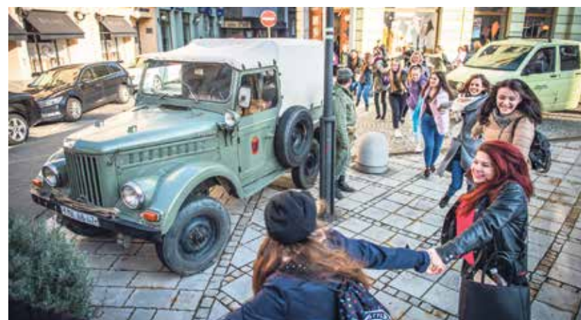
Lidský řetěz kolem historického centra.