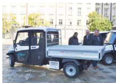
Elektrovozy mají ložnou plochu.