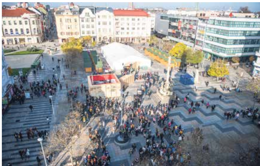
Oslavy vyvrcholily čtyřdenním programem na Masarykově náměstí