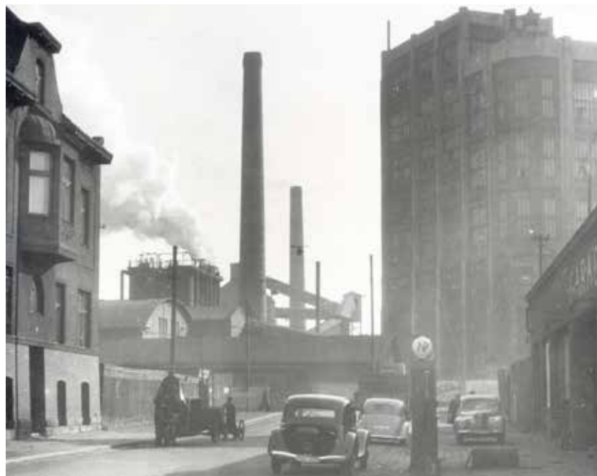
Brandlova ulice počátkem 50. let 20. století. Vpravo benzínová pumpa a budova garáží.

Nedochovaly se bohužel informace pro provoz parkovacího domu dosti podstatné, totiž jaký poplatek měla firma za parkování inkasovat. Zde