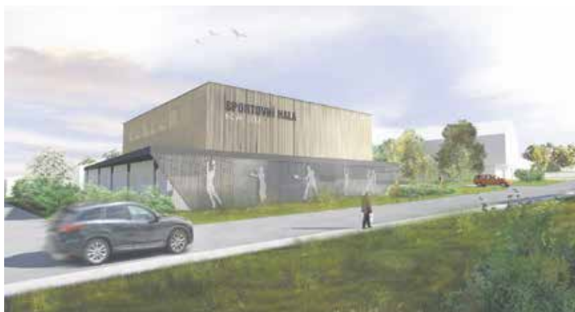
Vizualizace sportovní haly v Nové Bělé.

„Město postupně buduje sportovní infrastrukturu tak, aby se dobré podmínky pro rozvoj sportu, sportovních klubů a spolků postupně vytvořily ve všech obvodech. V lokalitě jižního okraje Ostravy se spádovou oblastí, do které patří Výškovice, Nová Bělá, Stará Bělá, Hrabová a Proskovice se aktuálně nenachází žádné sportovní zařízení víceúčelového typu, což způsobuje de-