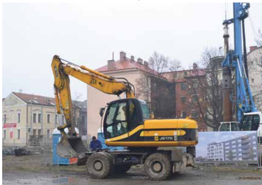
Stavebníci již hloubí základy.