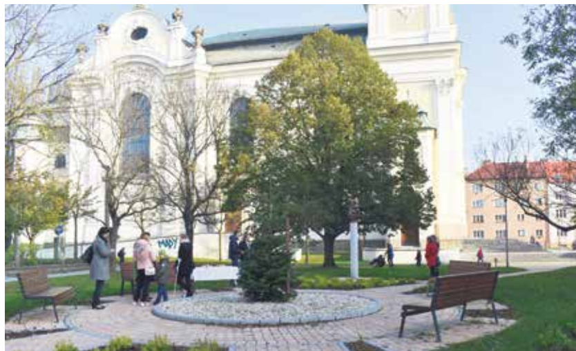
Revitalizovaný parčík v Mariánských Horách