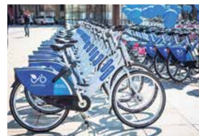
Kola společnosti Nextbike.

900, stanic bude 250, tedy o 50 více než letos. V některých obvodech přibudou lokality se stojany, nově budou sdílená kola v dalších pěti městských částech Martinov, Nová Ves, Plesná, Hrabová a Krásné Pole. Kola budou k dispozici od začátku března až do konce roku. Nově bude spuštěna také možnost rezervace kola. (av)