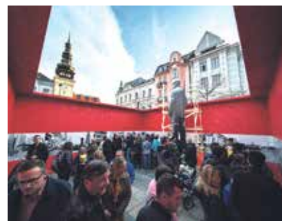
Milicionář a dobové fotografie.