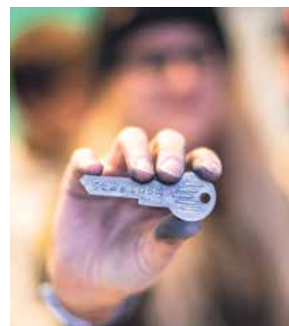
Každý si mohl odnést pamětní klíč.