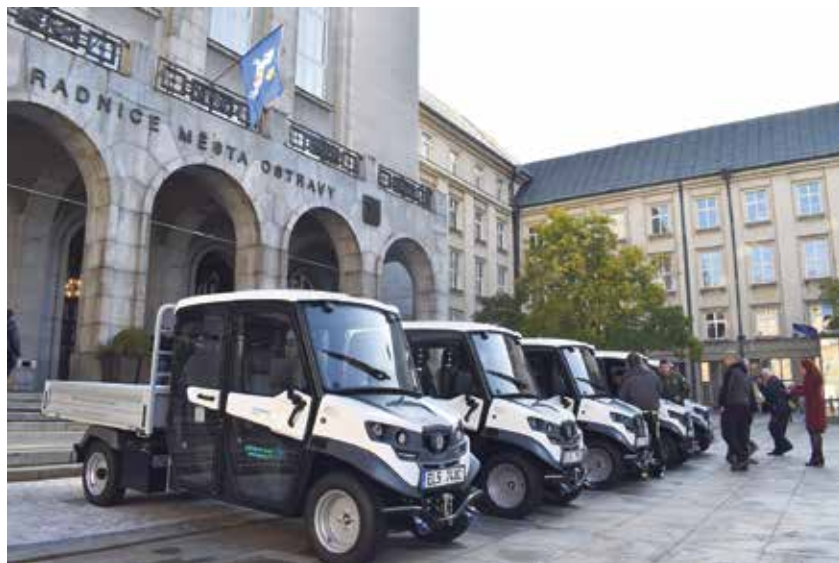
Nákladní elektromobily, které slouží v pěti ostravských obvodech.