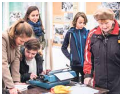
Ukázka, jak vznikal samizdat.