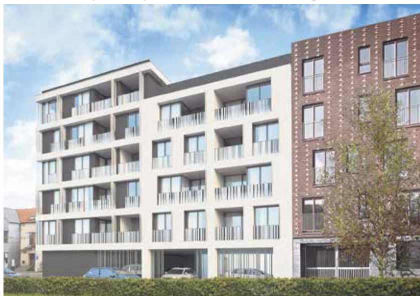
Vizualizace bytového domu v Janáčkově ulici.