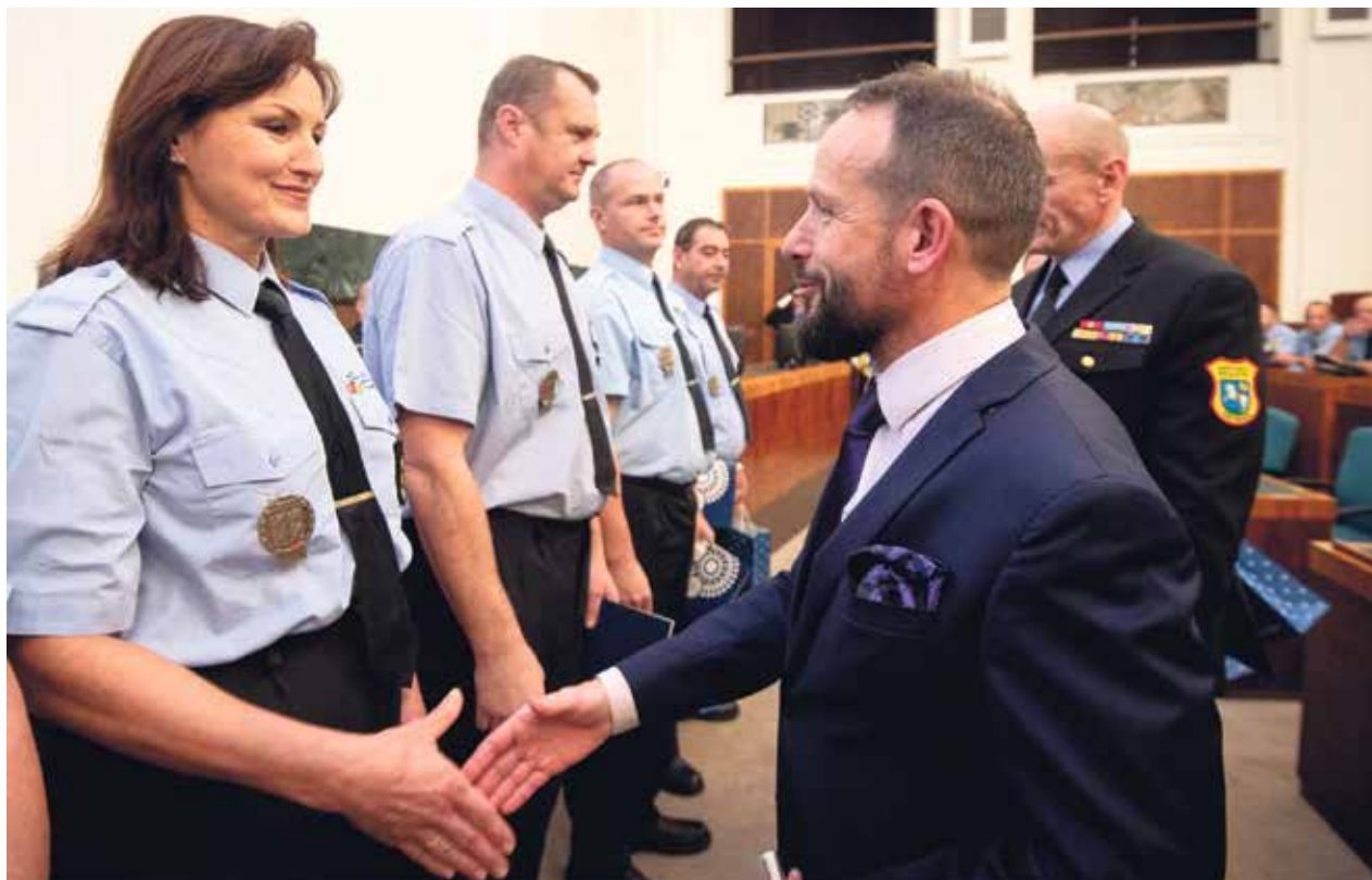
Primátor Tomáš Macura předává ocenění ostravským strážníkům.