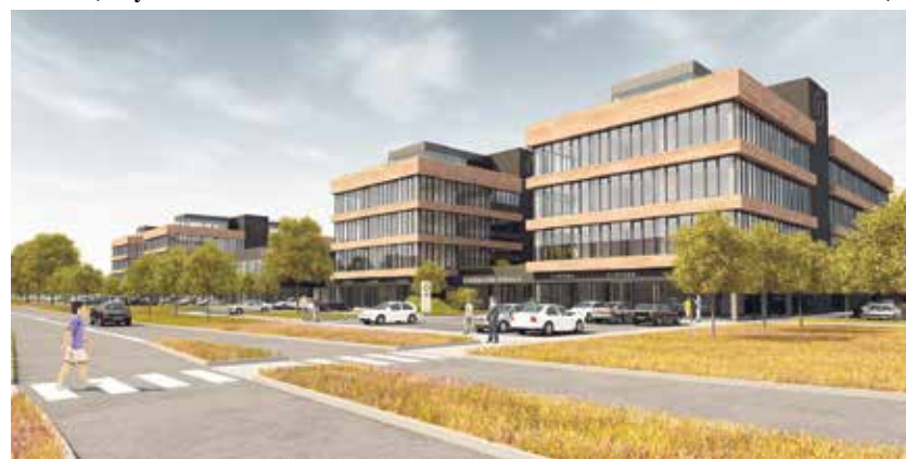
Vizualizace budov v hrušovské zóně Contera Park Ostrava D1.

leň, která vytvoří příjemné prostředí. Celková investice by měla dosáhnout dvou miliard korun. (rs)