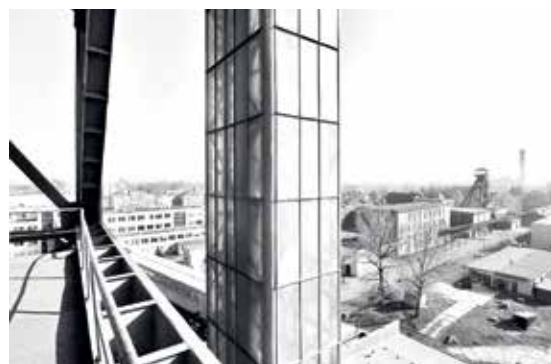
Fotografie z publikace literárního kritika Pavla Hrušky, fotografů Romana Poláška a Martina Popeláře a týmu spoluautorů.

Spolek Fiducia vydává v prosinci knihu, která se pokouší o zmapování duše ostravské krajiny. Poetický průvodce v deseti pěších trasách poradí všem, kdo