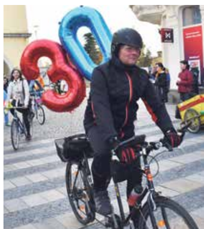
SametOVA Retro krasojízda.