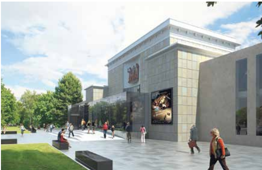
Vizualizace Domu kultury Poklad po rekonstrukci.

jsou již dokončeny vnitřní omítky, hotová je hydroizolace památkově chráněné střední části, dostávají se výtahové šachty, zděné příčky, vzduchotechnika a pokládá se podlaha ve velkém tanečním sále. Práce za 355