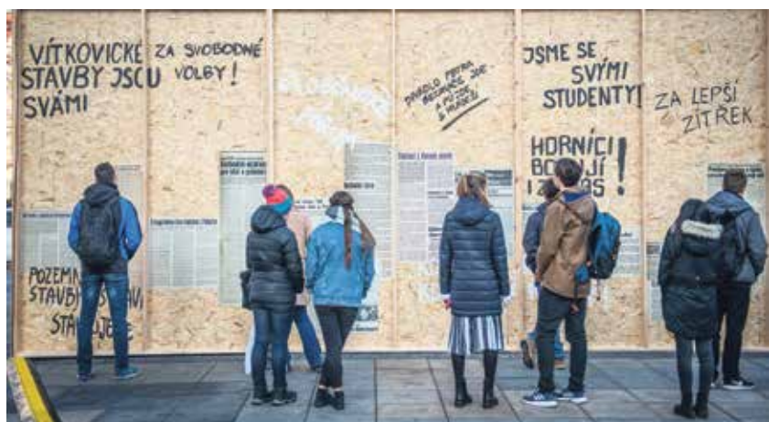
Dokumente a nápisy z listopadu 1989.