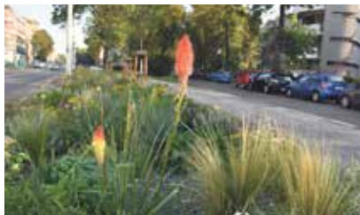
Trvalkový záhon u Nové radnice.