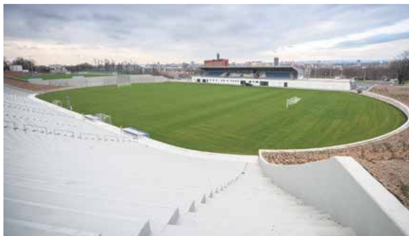
Zrekonstruovaný stadion Bazaly.

Žáci z akademie, která začala v Ostravě působit v září, dosud trénovali v provizorních prostorách. Nyní se přesunuli na Bazaly.