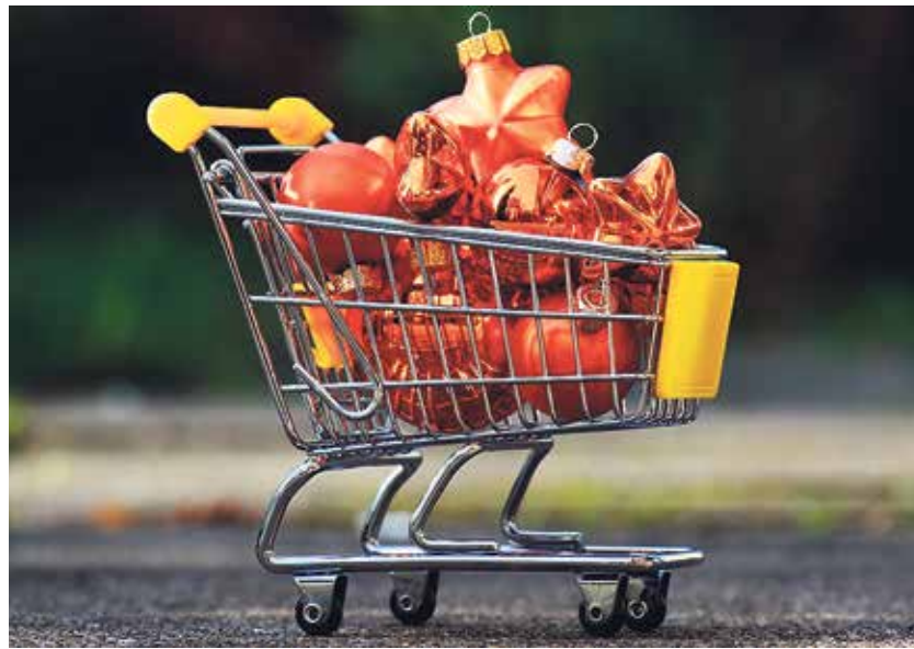
Vánoce umějí být obdobím klidu i nečekaného stresu, často s finančním pozadím.

předčasné splacení bývá oblíbeným ustanovením smluv. Takové půjčky se pak nezbavíte ani v případě, že pro to získáte dostatečné prostředky, případ-