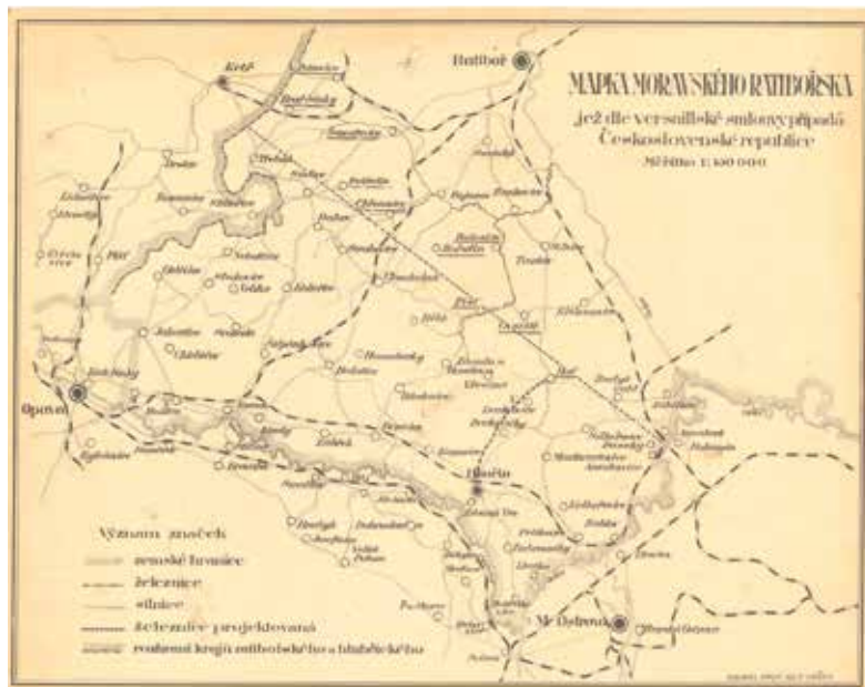
Moravské Ratibořsko, s vyobrazením obcí Hlučínska, historicky se jedná o území Horního Slezska, kolem roku 1922.

Zanikly německé spolky, do škol byl zaveden český vyučovací jazyk. Kronika obecné školy v Petřkovicích popisuje bouřlivý počátek školního roku 1920/1921. Děti a rodiče, kteří se již dříve dozvěděli o propouštění německých učitelů a přeměně školy na českou, se shromáždili na ulici před školou a nechťeli několik dnů nikoho vpustit na školní dvůr. Rodiče odmítali posílat děti do školy, požadovali jen německou školu bez jakéhokoliv vyučování češtině. Také v některých dalších obcích na Hlučínsku se sbíraly podpisy na petice za německou školu a proběhly stávky školních dětí. Nutno uvést, že lidé na Hlučínsku si v období pruské, resp. německé státní přiná-