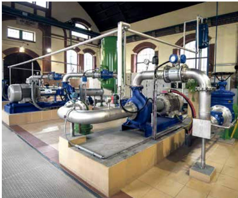
V Ostravě je 899 kilometrů kanalizační a 1046 kilometrů vodovodní sítě.