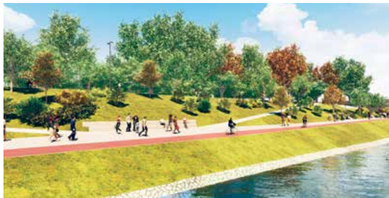
Nábřeží Ostravy se promění v proměnu. Vizualizace: Chválek ateliér s.r.o.

„Z dlouhodobého hlediska bychom komunikaci ideálně zcela uzavřeli pro automobily, to však za předpokladu, že budeme mít k dispozici objízdnou trasu. Preferujeme přírodě blízké řešení lokality a její návaznost na nové stavby Ostravské univerzity pro umění a sport. Předpokládáme, že výstavba univerzitních budov i naše úprava leobřežní komunikace skončí v roce 2021, nejpozději v roce 2022,“ po-