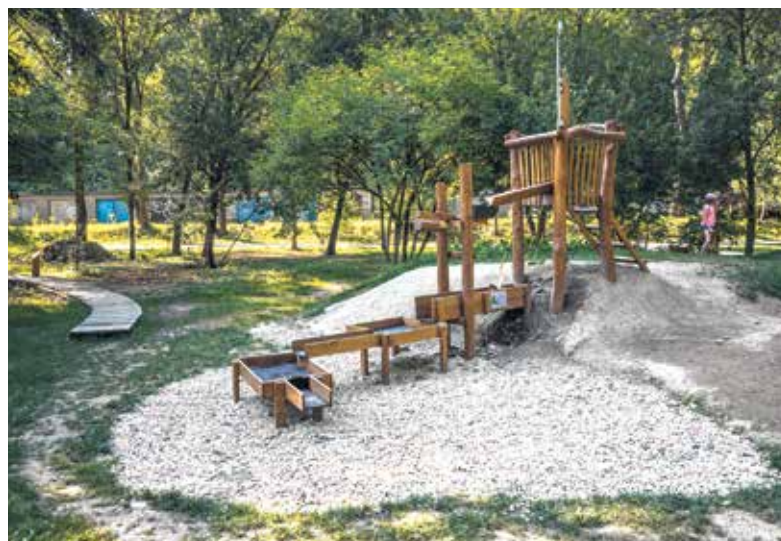
V minulosti byl z projektu podpořen např. i park Hrabovjanka.

nápady ucházet o finanční podporu města do konce března. K dispozici je 3,4 milionu korun. (rs)