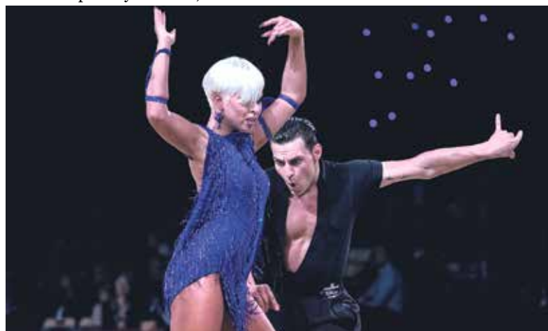
Do Ostravy se pravidelně sjíždějí nejlepší tanečníci světa.

Muži podlehli v semifinále švédskému mistrům Srörvreta 1:11 a v souboji o třetí místo prohráli s finským SC Classic 3:6. (rs)