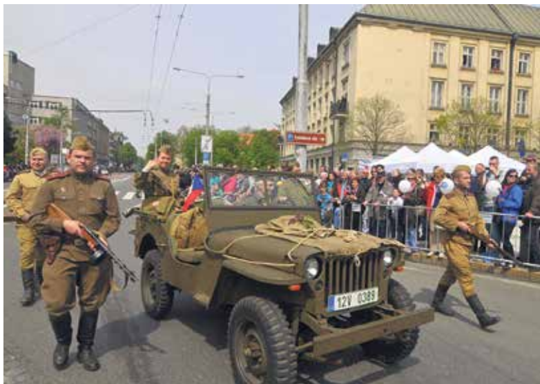
Oslavy 70. výročí osvobození města v roce 2015.