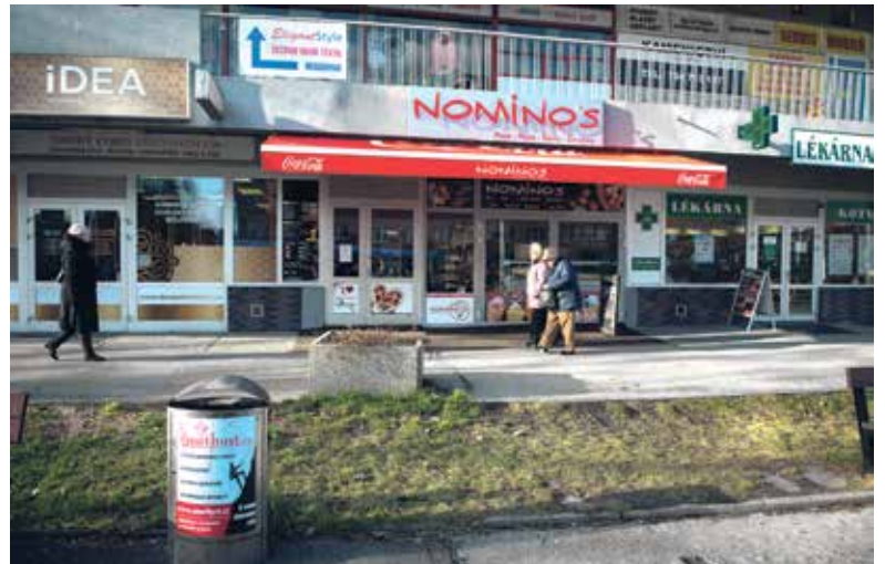
Reklama je umístěna prakticky všude ve veřejném prostoru a často působí nepřehledně.

Cílem je podpořit především menší podnikatele. Proto jsou oprávněnými žadateli ti, jejichž celkový obrát za uplynulé účetní období nepřekročil 10 milionů korun. Minimální výše dotace poskytnuté na jeden projekt činí tři tisíce korun, maximální výše dotace je 30 tisíc korun. Město se bude finančně spolupodílet na úhradě uznatelných nákladů realizovaných pro-