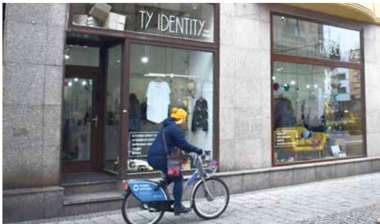
Příklad vkusné reklamy v centru Ostravy.

Manuál umísťování reklamy, plné znění nařízení pro regulaci reklamního smogu, podmínky dotačního programu a další informace jsou k dispozici na webu www.ostrava360.cz .