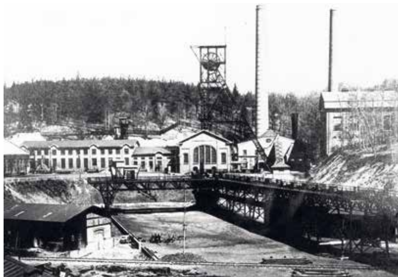
Kamenouhelný důl Anselm v Petřkovicích kolem roku 1920, obec Petřkovic byla díky existenci dvou uhelných dolů Anselm a Oskar na svém katastru označována za nejprůmyslovější ze všech hlučínských obcí, v roce 1920 zaměstnávaly oba doly na 3000 dělníků (v roce 1937 již o polovinu méně).

Svou roli sehrála proněmecká agitace, předsudky vůči českému národu „husitů a bezbožníků“ a také skutečnost, že mnozí obyvatelé Hlučínska pracovali v německých zemích jako sezónní dělníci a cítili se s Německem existenčně spjatí. Dospělí obyvatelé Hlučínska mohli do ledna 1922 optovat pro Německo, čehož využilo 4600 osob (13 % obyvatel Hlučínska) a byli následně přesídleni. Například k opci a následnému přesídlení za hranice státu se z Petřkovic rozhodlo 260 osob (10 %), z Koblova 79 osob (5 %) a Hošťálkovic 71 osob (6 %).