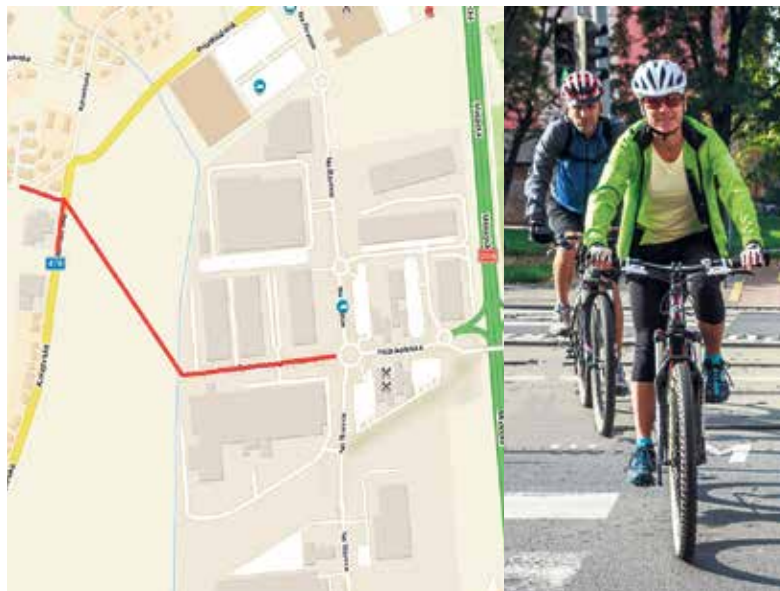
Nová cyklostezka se v Hrabové napojí na Krmelínskou ulici.

„Snažíme se síť cyklostezek v Ostravě a nejbližším okolí dále rozšiřovat a vzájemně propojovat, aby cyklisté jezdili po bezpečných stezkách a ne silnicích s hustým automobilovým provozem. Nově budované trasy slouží nejen k projížďkám, ale především k podpoře cyklo dopravy jako zdravé a ekologické formy každodenního přesunu do zaměstnání a dalších aktivit. Těch, kteří