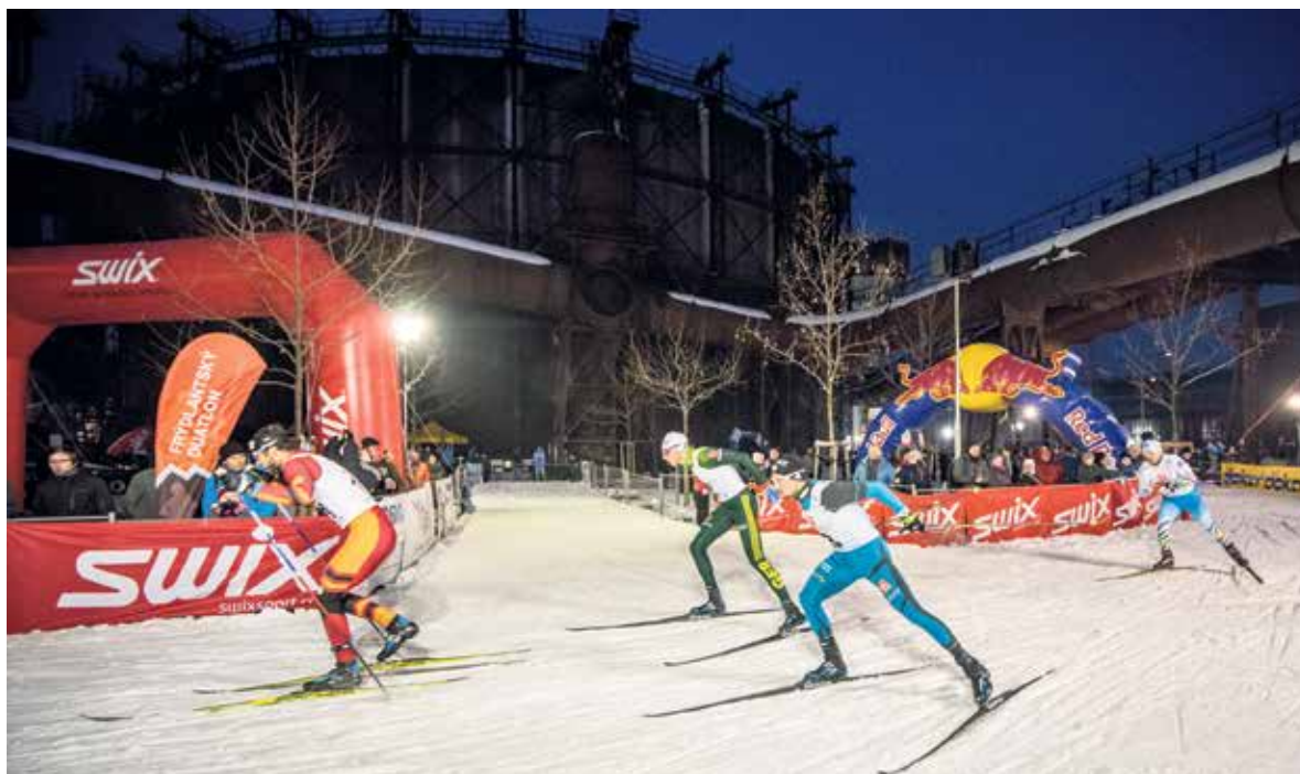
Lyžaři budou bojovat pod vysokými pecemi v sobotu 15. února.