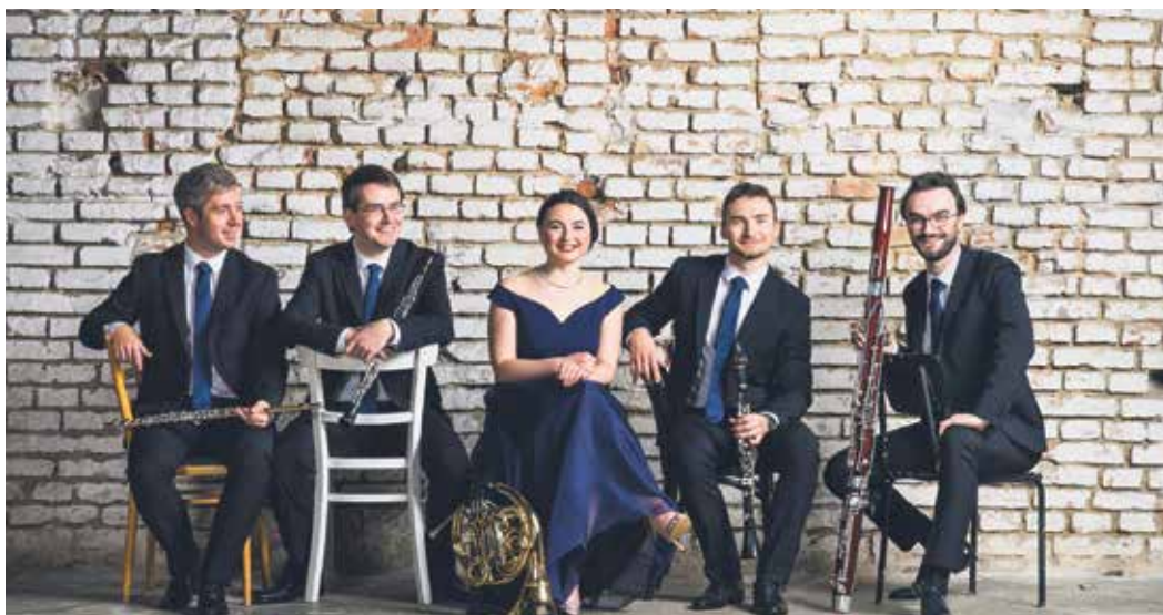
Dechový soubor Belfiato Quintet neboli „Pěkný dech“.

Vlastní tvorbou se bude 10. března od 19 hodin ve vítkovické multifunkční aule Gong prezentovat Ondřej G. Brzobohatý. (hob)