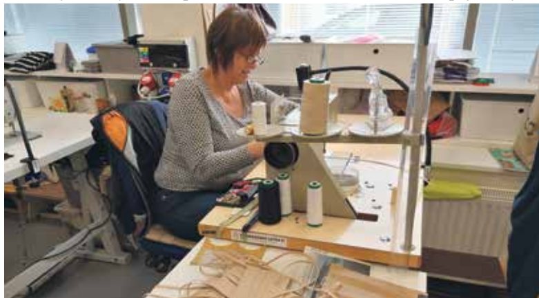
Jako jedni z prvních začali šít roušky v Národním divadle moravskoslezském, které je aktuálně uzavřeno.

telé města i městských organizací, lidé, jejichž pracoviště jsou aktuálně uzavřena. Roušky věnují pracovníkům nasazeným do první linie nebo potřebným včetně bezdomovců. Roušky šije Národní divadlo moravskoslezské, Fajna dílna, Vestibul interiéru a řada dalších. Ty, co poslední dny tráví u šicích strojů, shánějí materiál a distribuují roušky v Ostravě a okolí, propojila např. iniciativa Rouška je cool.