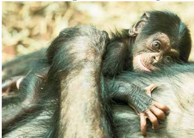
Nové narozené mládě šimpanze.

Tři roky po sobě zahnízдили v ostravské zoo orlí mořští. Poprvé to bylo v roce 2018, kdy odchováli jedno mládě, v následujícím roce dvě mláďata. Letos snesla samice tři oplozená vejce. Aktuálně pečují o dvě mláďata, třetí se vylíhlo o několik dní později. Orel mořský je považován za největšího orla Evropy. (hob)