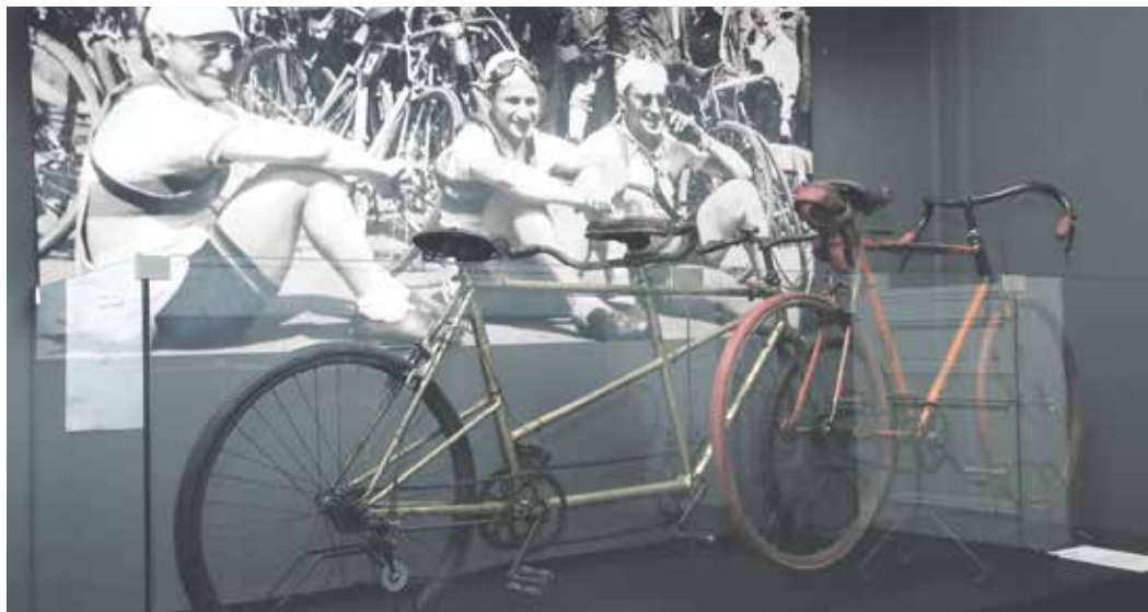
Historické bicykly v Ostravském muzeu.

spolku Elegant, který výstavu spolupořádá. Uvidí historické bicykly, vysoko kolo „kohoutovku“ z 80. let 19. století, nejstarší dřevěnou drezínu, která je spíše odrazedlem pro dospělé, příslušenství kol, dobové módní doplňky, tematické letáky, staré tiskoviny, trofeje i předměty připomínající historii cyklistických spolků. (rs)