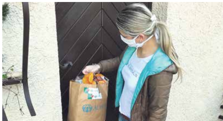
Dobrovolnice ADRY přináší nákup do domácnosti seniora.