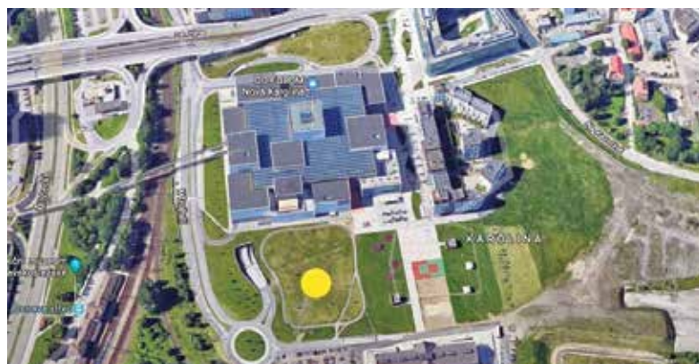
Pozemek za Novou Karolinou (označený žlutým terčem), na kterém vyroste pětipodlažní administrativní budova.

„Naším dlouhodobým cílem je vytvořit z centra Ostravy hojně navštěvované atraktivní místo. Stavba administrativního objektu na dosud nevyužitém území bude dalším důležitým krokem pro rozvoj této významné části centra města, pro jeho zcelení, propojení moderních staveb nákupního centra a obytných domů s historickými objekty Trojhalí. Těší mě, že se do projektu