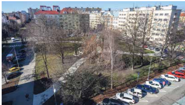
Památník veteránů bude umístěn v parku Čs. letců.

Soutěž na památník vypsal město již loni. „Přestože přišlo 27 ná-