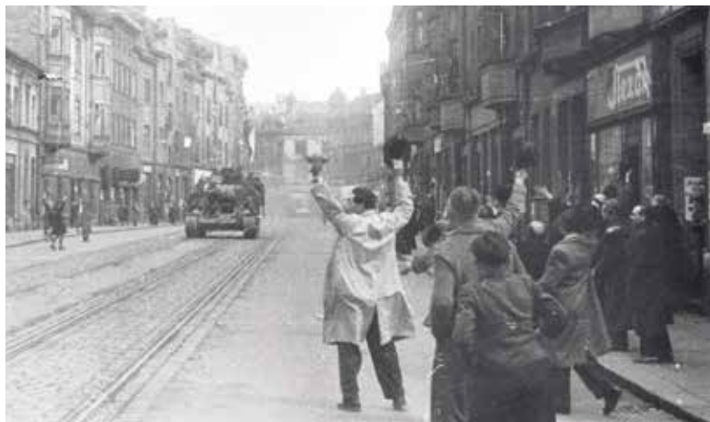
Tank projíždí 30. dubna 1945 Nádražní ulicí.

Ostrava si 30. dubna každoročně připomíná osvobození města i konec druhé světové války. Velké oslavy se uskutečnily v roce 2015 k 70. výročí osvobození. Město připravilo na letošní rok k 75. výročí rovněž rozsáhlé oslavy, které ale musely být omezeny v rámci opatření proti šíření koronavirové epidemie. (rs)