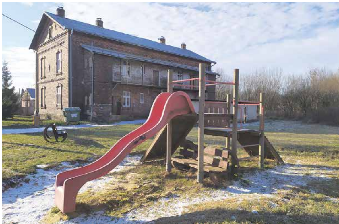
Děti i dospělí budou využívat znovuotevřené komunitní centrum.