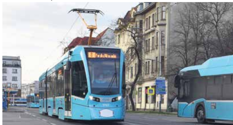
Do ulic města vyjely tramvaje s namalovanými rouškami.

U některých linek byly upraveny intervaly, dočasně byly zrušeny tramvajové spoje č. 6 a 15, autobusové linky 20, 90 a 91, které reagují na uzavření školských zařízení, a trolejbusové linky 103 a 109. Obslužnost je zajištěna dalšími spoji. Podrobnosti o změnách najdete na www.dpo.cz/nouzovadoprava . (rs)