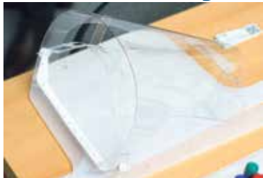
Jeden z ochranných štítů ostravské firmy IdeaHUB.

Výrobu pěti tisíc lehkých ochranných štítů, kterých je nedostatek, iniciovalo město Ostrava u společnosti Moravskoslezské inovační centrum (MSIC) Ostrava. Vyvinulo je sdílené vývojové centrum IdeaHUB, které sídlí v areálu MSIC. Ostrava objednala ochranné štíty pro zdravotníky, pracovníky v sociálních službách, strážníky i lidi na přepážkách úřadů. Štíty byly vyro-