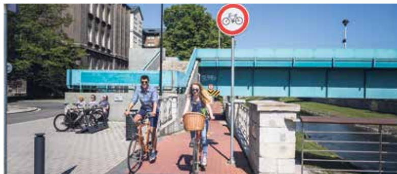
Ostrava se stane spolupřátelkou soutěže Do práce na kole.

Soutěž je určena pro týmy i jednotlivce, kteří dojíždějí do práce na kole, bruslích, skateboardu, longboardu, běhají nebo chodí pěšky. Zapojit se do ní mohou také vozičkáři. Soutěž motivuje lidi, aby pro každodenní