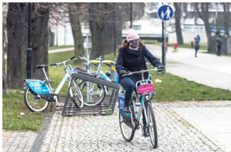
Sdílená kola mohou nahradit cestování MHD.