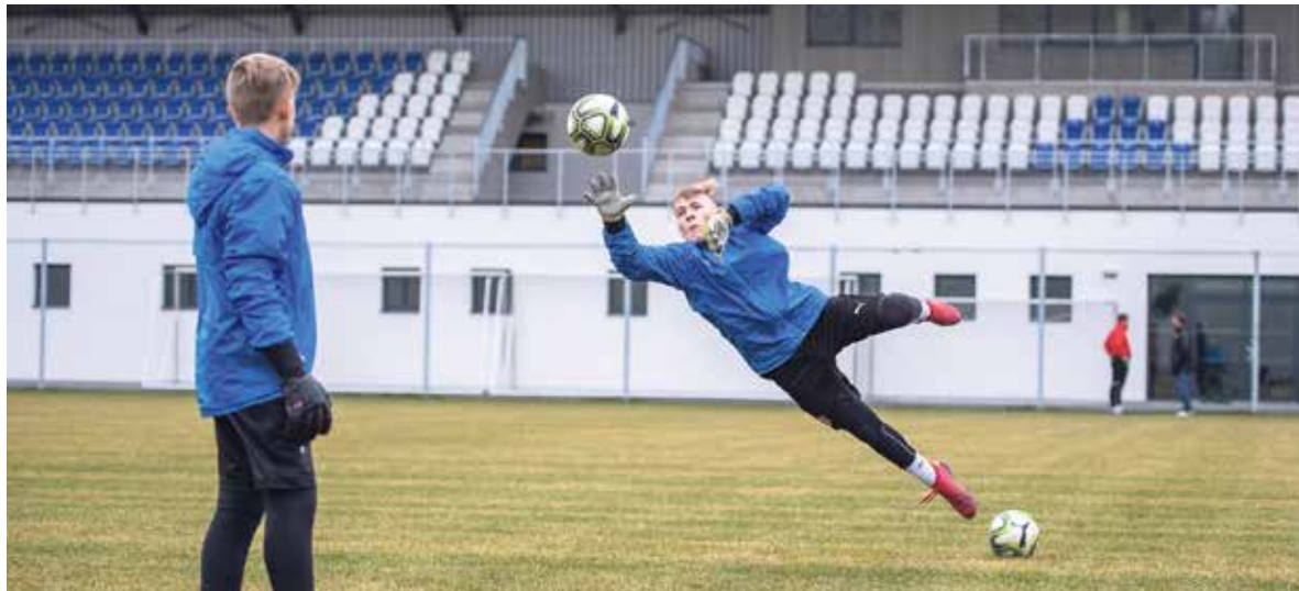
Mladí brankáři při rozcvičení na hlavním hřišti stadionu Bazaly.

Stadion Bazaly má nyní hřiště s přírodní i umělou trávou, běžec-kou dráhu, tělocvičnu, posilovnu, prostor pro regeneraci, šatny a zázemí pro trenéry a další pracovníky. Tréninky na něm budou pokračovat, až skončí omezení související s pandemií koronaviru. (rs)