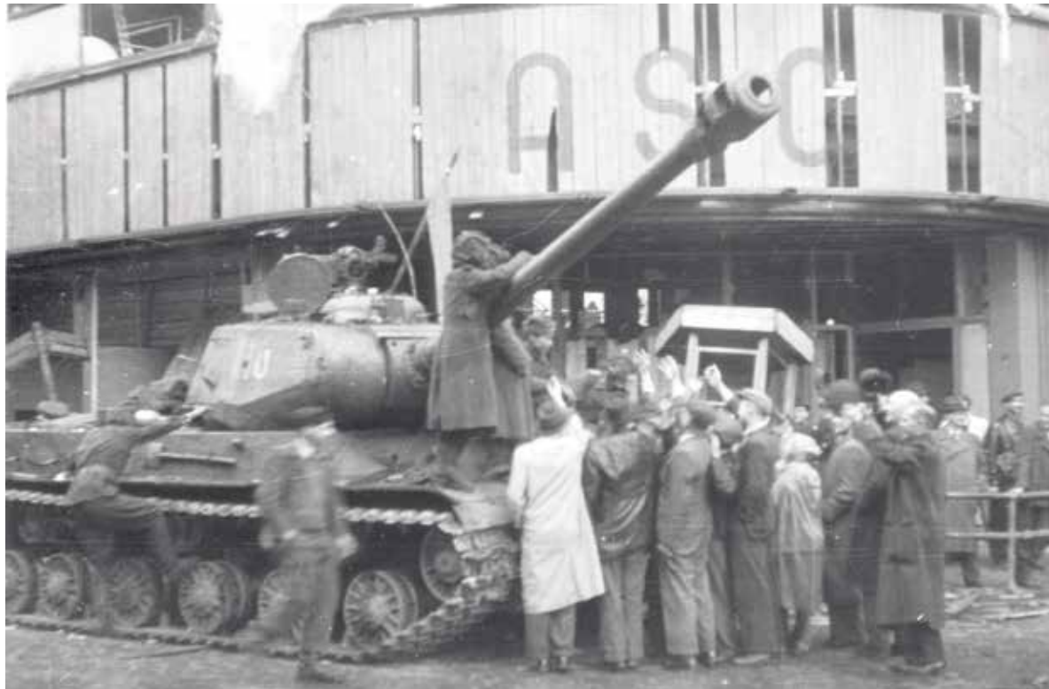
Ostravané vítají tankisty, kteří dorazili k obchodnímu domu ASO.