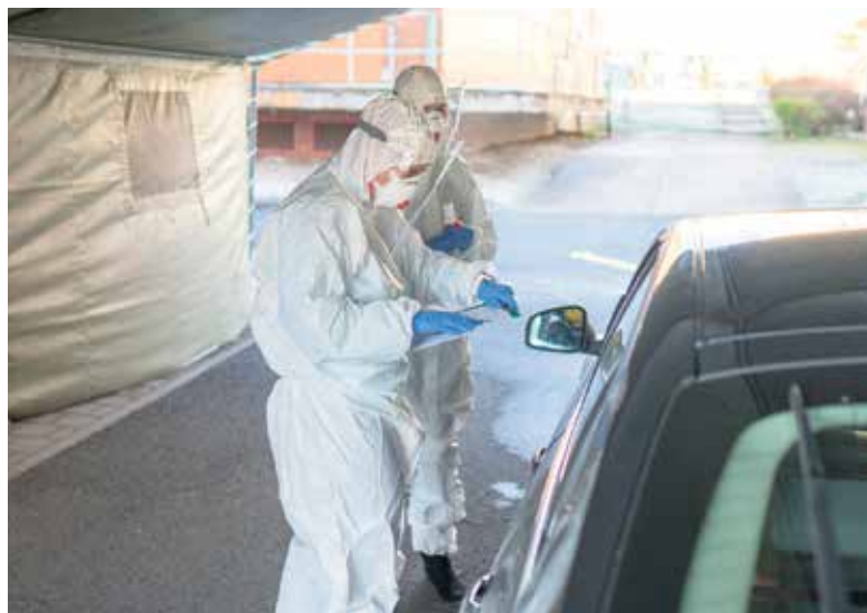
Stěry provádějí zdravotníci tak, aby pacient nemusel vystupovat z automobilu.

Druhé odběrové místo ve městě funguje ve Fakultní nemocnici Ostrava v Porubě. Vjezd k odběrovému místu je z ulice K Myslivně. Ani zde dotyčný nevystupuje z automobilu. Najede do stanu, kde zdravotní sestra provede odběr. Toto odběrové místo funguje denně od 7 do 19 hodin. I zde je povinnost mít doporučení od epidemiologa. (rs)