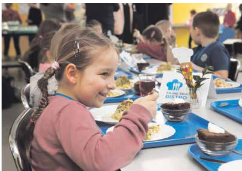
Děti z porubské Základní školy A. Hrdličky si pochutnávají na menu s kuřecím závitkem.