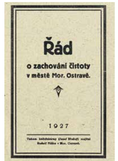
Čistotní řád schválený městským zastupitelstvem 10. června 1927.