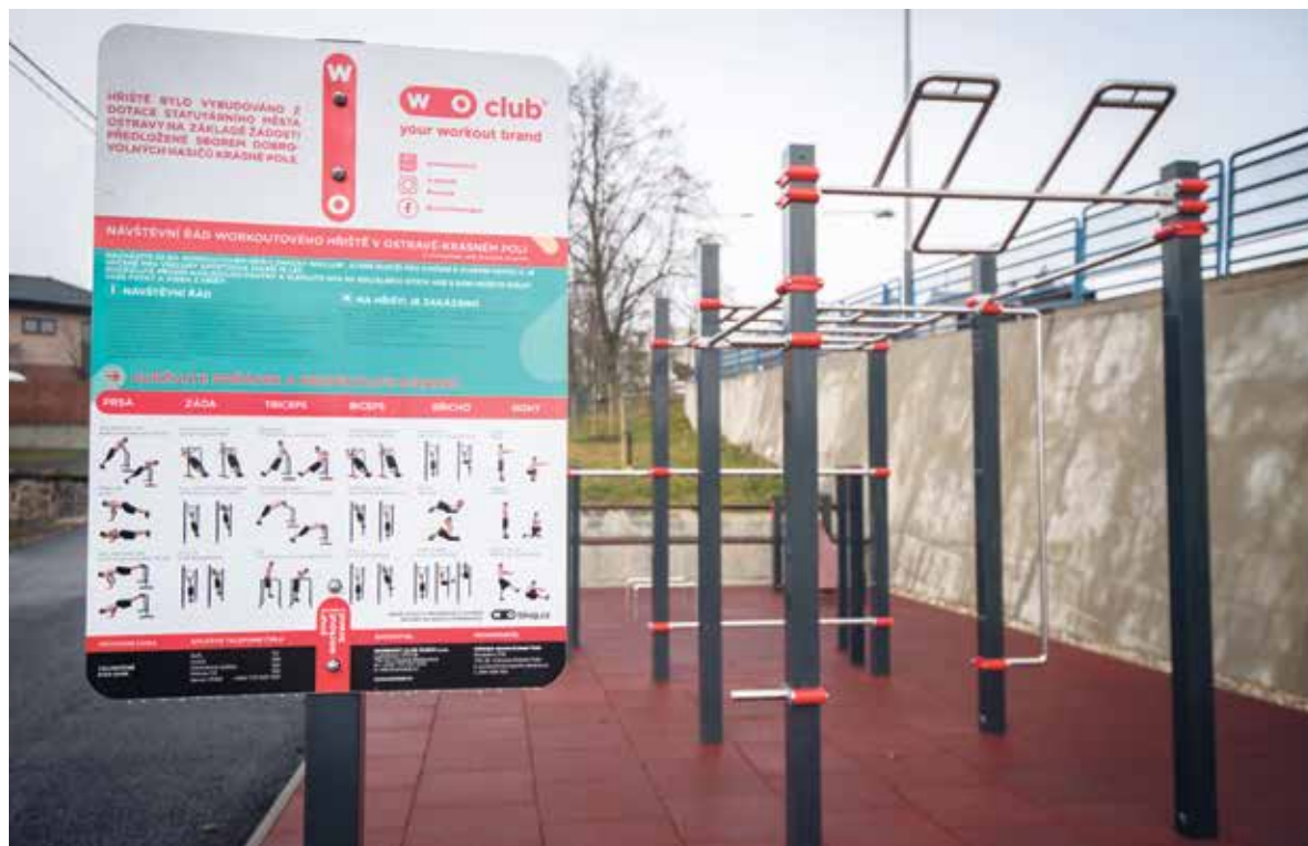
Workoutové hřiště v Krásném Poli.

Pro vytipované lokality se vybere typově a kapacitně vhodné workoutové hřiště. Projekt se doplní o cenovou nabídku, návrh vybavení a formát hřiště. Město bude hledat alternativní možnosti financování, např. dotační tituly. V Ostravě je bezmála 20 workoutových hřišť. V loňském roce například postavili za dotaci z projektu FajnOVA nové