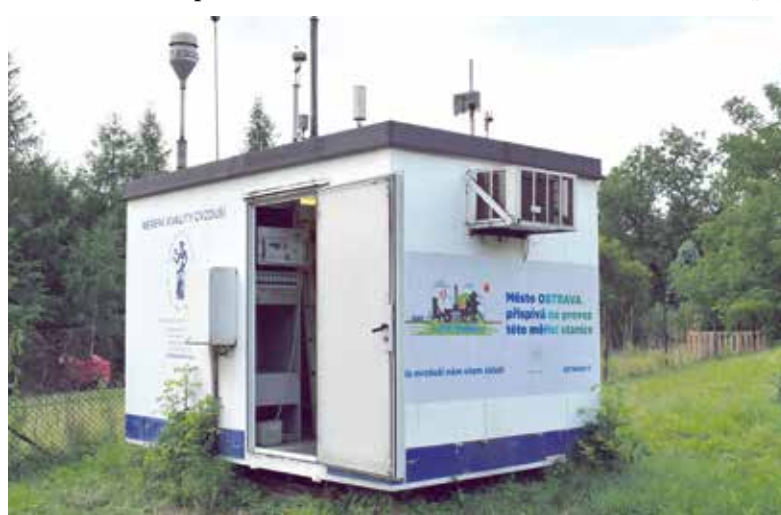
Měřicí stanice v Radvanicích.

nic Českého hydrometeorologického ústavu. (ph)