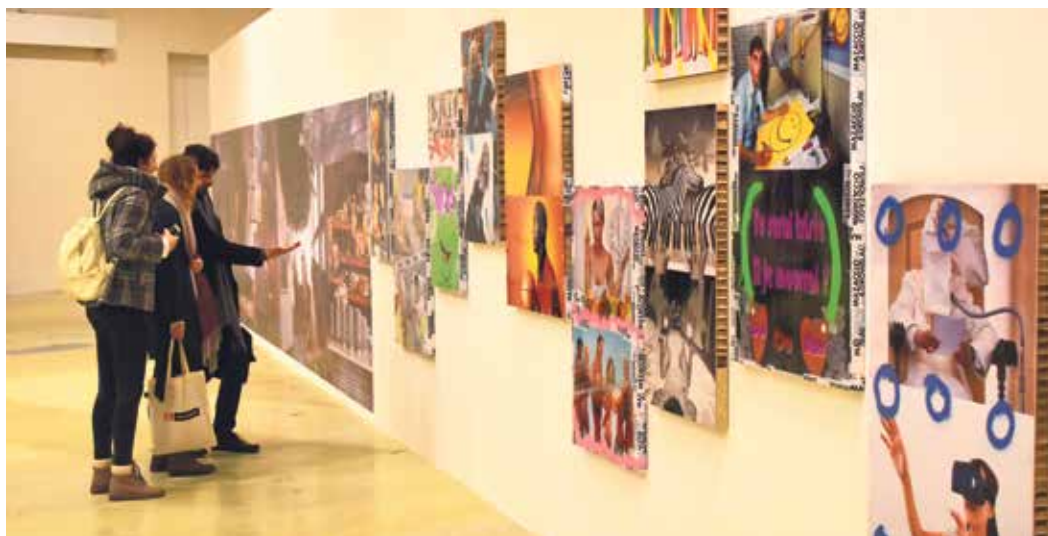
Část výstavní stěny v galerii Plato.

Výstavu Skiz(ə)m mohou zájemci navštívit až do 31. května. (rs)