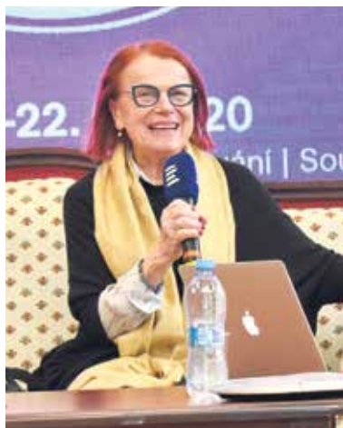
Iva Janžurová byla tvář letošního festivalu. Její besedu navštívily stovky posluchačů.

Součástí festivalu bylo vyhlášení cen Český bestseller. Hlavní ocenění v kategorii Česká beletrie pro dospělé převzala Alena Mornštajnová za román Tiché roky. (rs)