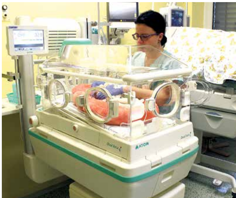
Nový inkubátor v městské nemocnici.

Oddělení Dětského lékařství získalo plně vybavený kombinovaný