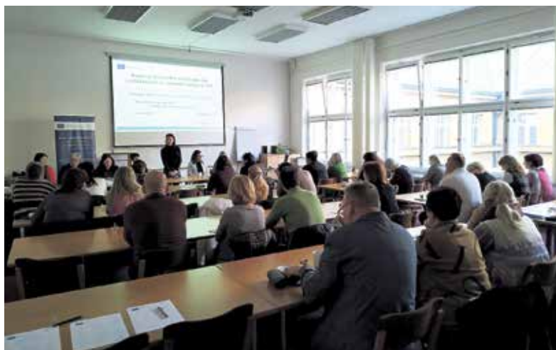
Účastníci vzdělávacího semináře.

Projekt odstartoval na začátku školního roku a zapojilo se do něj 25 ostravských základních škol. Je zaměřen na zvýšení úspěšnosti vzdělávání dětí se speciálními vzdělávacími potřebami i dětí z rodin se zvýšenou potřebou sociální podpory, které nemají dostatečné zájemní na přípravu do školy či postrádají motivaci k učení. Probíhají nejen metodická setkání a zahraniční exkurze zapojených odborníků, ale i workshopy pro rodiče, například o domácí přípravě do školy nebo o výběru střední školy. (lm)