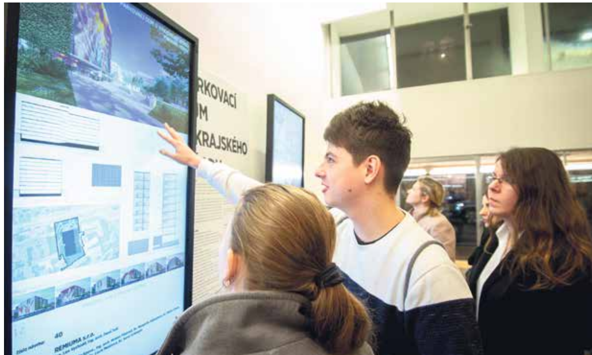
Výstava návrhů v sídle MAPPA v Nádražní ulici.

„Chtěl jsem, ať je objekt co nejmíň bednou na auta, ať je hravým zrcadlem strnulých objektů kolem,