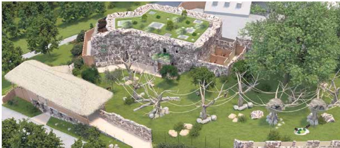
Vizualizace nové expozice pro makaky, gibony a kopytníky.

„V posledních letech jsme investovali do řady nových pavilonů a expozic, které zvyšují atraktivitu zoo pro návštěvníky, ale také zlepšují podmínky pro chov zvířat. Díky tomu patří naše zoologická zahrada k nejoblíbenějším turistickým cílům. Ročně ji navštíví kolem půl milionu lidí. Velký zájem je na druhé straně pro město závazkem, že se o svou Zoo musí nadále dobře starat. Budování další expozice je