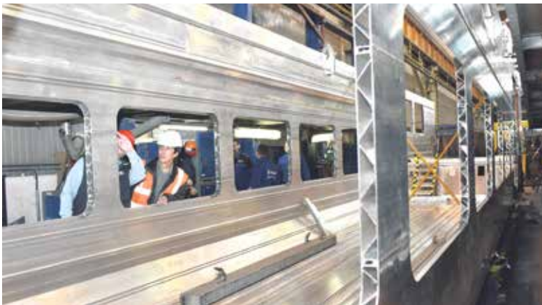
Železniční vůz, který vyrábějí pracovníci v ostravském areálu Škoda Vagonka.

Vagonka v současné době vyrábí elektrické vlakové jednotky pro České dráhy a pro zákazníky na Slovensku a v Lotyšsku. (rs)