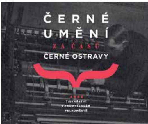
Výstava o tiskařině v Ostravě potrvá do 17. května.

Jak to bylo s tiskařskou živností v Ostravě koncem 19. a začátkem 20. století, se zájemci dozvědí na výstavě Černé umění za časů černé Ostravy aneb Tiskařství v průmyslovém velkoměstě v Galerii Astra v domě s pečovatelskou službou v ulici Ivana Sekaniny v Ostravě-Porubě.