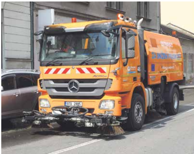
Jeden z vozů, který čistí ulice od prachu a nečistot.

Celkem 366 kilometrů státních, krajských i městských komunikací je rozděleno podle prachových map do tří kategorií. Městu z toho patří