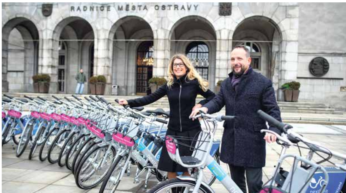
Letošní sezonu bikesharingu zahájili primátor Tomáš Macura a náměstkyně Kateřina Šebestová.

„Letošní bikesharingová sezona přinese řadu novinek. Nejen, že kol bude více a budou v dalších pěti obvodech, ale nově bude náš ostravský systém propojen s tím ve Vřesíně a v Hlučíně. Novinkou je možnost rezervace kola a 10 bonusových stanic, kde si lze půjčit kolo až na 30 minut zdarma. Během dubna bude bikesharing integrován do systému veřejné dopravy Dopravního podniku. Pro přemístění do konkrétního cíle ve městě aplikace navrhne optimální trasu a nejefektivnější kombinaci dopravních prostředků včetně kol,“ dodala náměstkyně primátora Kateřina Šebestová.