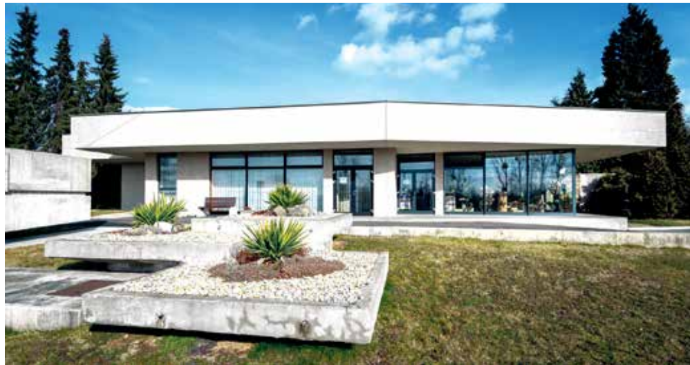
Úpravy správní budovy a centrálního schodiště by měly být hotové do konce letošního roku.

„Uvědomuji si nutnost investic do oprav pietních míst, jakými jsou hřbitovy, a považuji péči o jejich vzhled za jednu z povinností obce. Jsem proto ráda, že se letos podařilo v rozpočtu města vyčlenit 23 milionů korun na rekonstrukce či jiné úpravy hřbitovů v jednotlivých městských obvodech. Začínáme převodem osmi milionů pro ústřední hřbitov ve Slezské Ostravě. Další 15 milionů je určeno pro ty městské obvody, které budou mít připravené projekty či záměry. Když jsme loni analyzovali, co je kde potřeba, tak kromě rekonstrukcí chodníků nebo oprav plotů se často mezi požadavky objevovala příprava pro nová hřbitová místa a kolumbária. Například ve Vítkovicích se chystá projekt nové smuteční síně a rádi bychom se zaměřili na revitalizaci zeleně,“ popsala náměstkyně primátora Kateřina Šebestová. (rs)