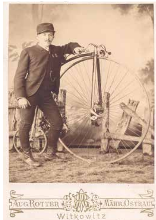
Jízda na kole nemusí být jen sportovním zážitkem, ale také společenskou a kulturní událostí.

Část expozice je také věnovaná cyklistickým závodům a bude doplněna o originální sbírku závodních kol. Výstava prezentuje také světový unikát v podobě obnovy řemesla výroby vysokých kol v České republice, která patří k největším světovým výrobcům špičkových replik vysokých kol. Součástí výstavy bude také videoprojekce věnovaná prezentaci dochovaných archivních fotografií, filmů a dokumentů, kvízy s cyklistickou tematikou pro děti i dospělé a další doprovodný program. (red)