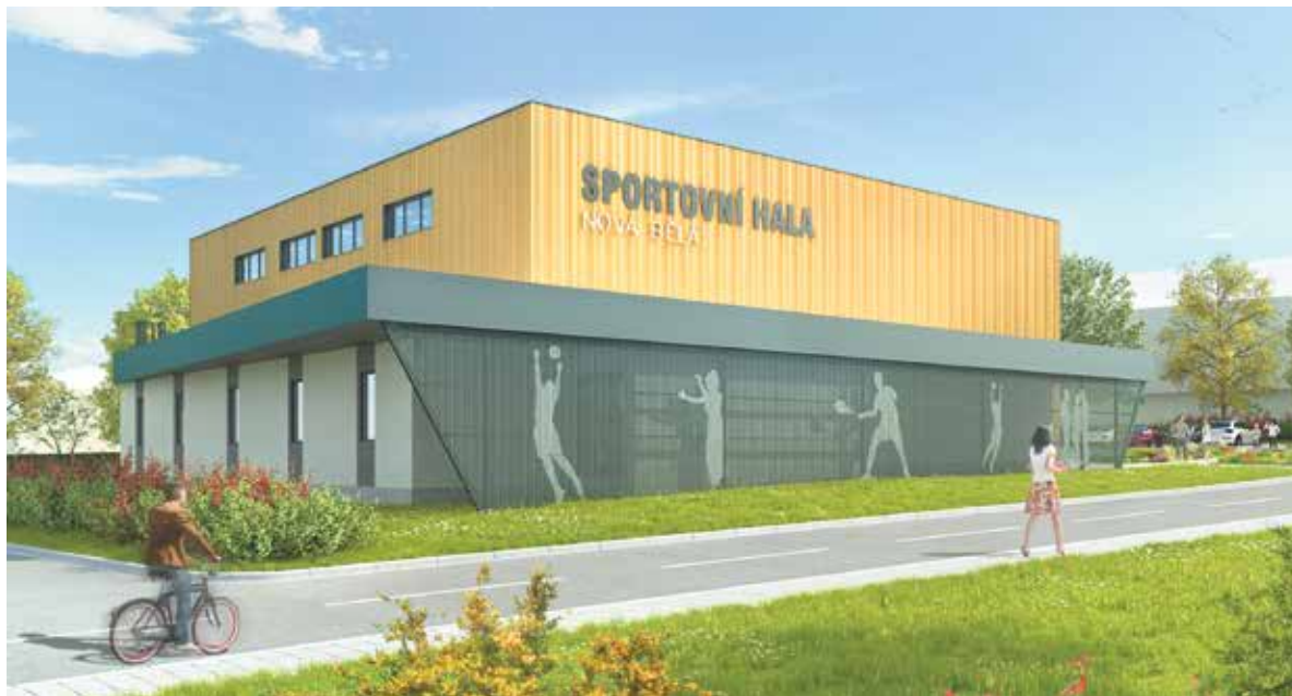
Sportovní hala v Nové Bělé.

Novou multifunkční sportovní halu začalo stavět město Ostrava v Nové Bělé. Hala by měla být dokončena do konce listopadu letošního roku. Bude možné v ní hrát na profesionální úrovni basketbal, badminton, volejbal a stolní tenis, rekreačně tenis, házenou, florbal, futsal a další sporty. V nové hale bude univerzální hřiště o rozměrech 30 x 18 metrů, malé hlediště s kapacitou 50 až 100 diváků, skladové prostory, klubovna a sociální zázemí. Součástí areálu bude parkoviště s 23 místy.