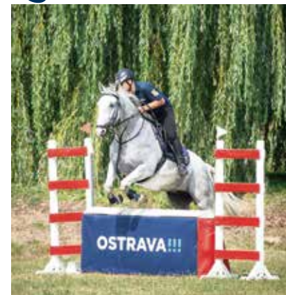
Kůň zdolává překážku.