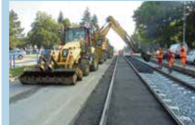
Práce na rekonstrukci tramvajové trati v Porubě.

Rekonstrukce tramvajové trati v ulici 17. listopadu v Porubě, která skončila v druhé polovině srpna, přináší cestujícím pohodlnou jízdu a obyvatelům v okolí tišší provoz