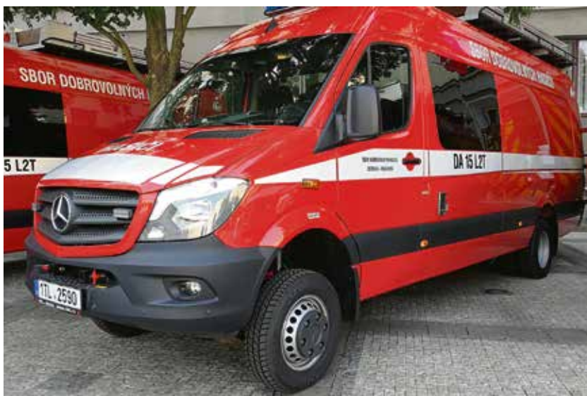
Mercedesy nahradily dobrovolným hasičům přesluhující Avie.

lionu, MS kraj 2,25 milionu a obvod Pustkovec 1,825 milionu korun. Novou zbrojnicí za 20 milionů Kč získají také hasiči z Muglinova (r)