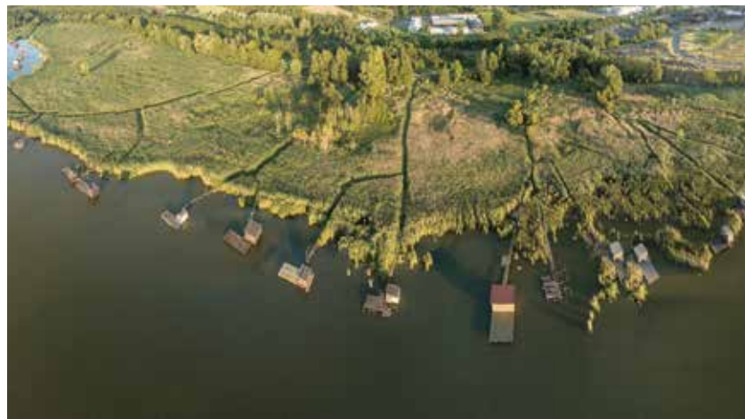
Jedním z nejmalebnějších míst v Ostravě je Heřmanický rybník.

Ano, bylo toho více. Cílíme v nich na nejmladší generaci. Ostrava je partnerem soutěže Hledej pramen vody, kterou pro žáky základních škol pořádá společnost Ostravské vodovody a kanalizace. Děti po několik týdnů plní postupně konkrétní úkoly a zábavnou formou se tak seznamují s vodou a jejím využitím, učí se s ní hospodařit a samozřejmě ji i pít. Letos se soutěž konala již po sedmnácté a každého ročníku se účastní tisíc dětí. Zjistila jsem, že děti uvažují často daleko více ekologicky než jejich rodiče, a to mne opravdu těší, protože začít se musí u nich. (rs)