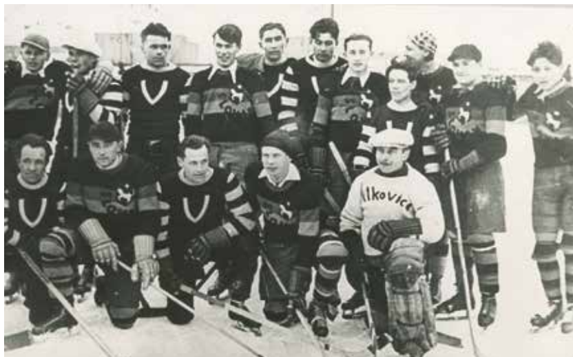
Ostravští rivalové, hokejisté týmů SSK Vítkovice a KS Slovan, na společném snímku z roku 1934.

Vraťme se ale do SKMO. Zápal vedení klubu pro lední hokej zde příliš