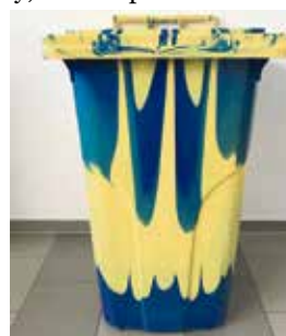
Nová popelnice na tříděný odpad.

Domácnosti, které budou do projektu zapojeny, obdrží počátkem září dopis s informací o termínu veřejného projednání a také letáčky s potřebnými informacemi i harmonogramem rozvozu popelnic. (av)