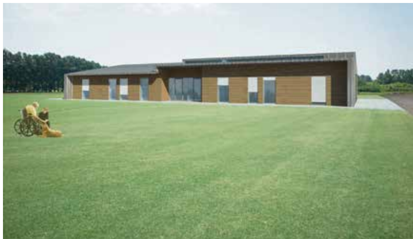
Vizualizace nového bydlení pro klienty Čtyřlístku.

Mentálně postižení lidé dosud žili v domovech Barevný svět a Na Liščině. Každý z pěti nových domů ve Výškovicích, Nové Bělé, Petřkovicích a v Hrušově (dva domy) budou tvořit dvě domácnosti. V každé domácnosti bude žít šest klientů v jedno- a dvou-