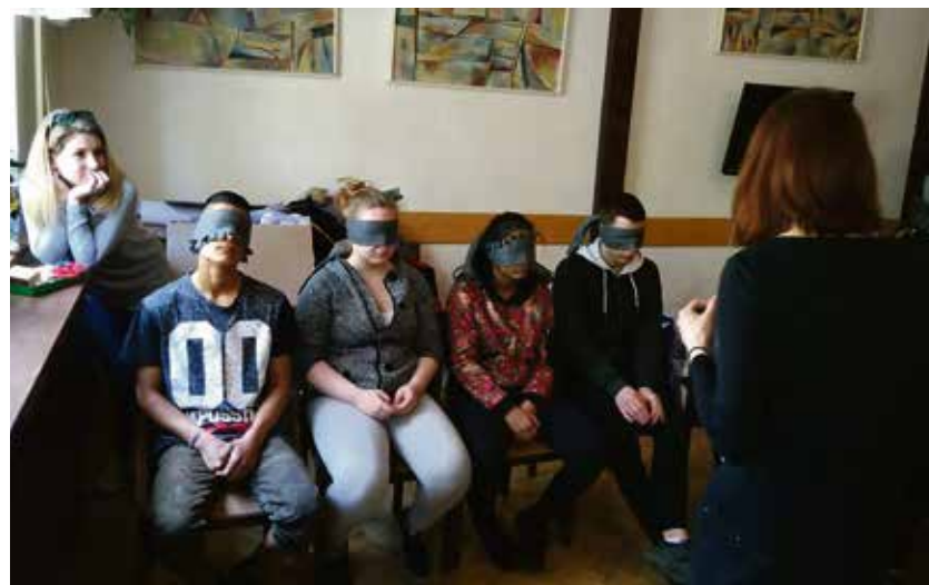
Klienti se účastní pravidelných setkání ve skupinách.