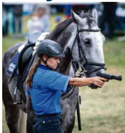
Jednou z disciplín byla také střelba.