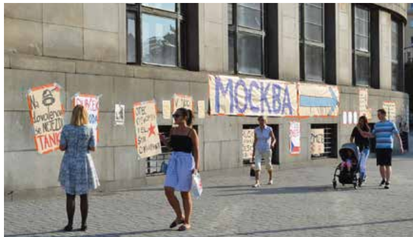
Plakáty proti okupantům zaplavily centrum města.

zkušenost a pocity, které lidé prožívali, nelze přenést. Chtěli jsme alespoň částečně navodit atmosféru oněch nešťastných srpnových dnů,“ řekl k akci primátor Tomáš Macura. (rs)