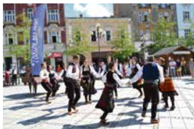
Srbští tanečníci na Jiráskově náměstí.