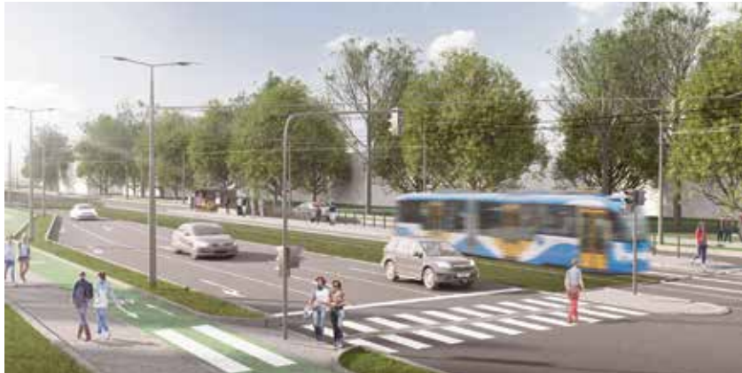
Vizualizace tramvajové trati.

Nová tramvajová trať by měla vést od Slovanu k Duze a dále k hypermarketu Globus. K její výstavbě mají být využity nejmodernější technologie, které umožňují provoz s nízkou hlučností. Projekt pracovním nazvaný Ekologizace veřejné dopravy v Porubě je připravován od roku 2014. Plán na rozšíření tramvajové trati na sever Poruby je však starý několik desítek let. Tramvajová doprava, která v místě neprodukuje žádné emise, je považována za neekologičtější způsob hromadné přepravy osob. Poruba realizací projektu může získat jednu z nejmodernějších tramvajových tratí v Evropě. Celý projekt za přibližně miliardu korun by měl být z až 85 % financován z prostředků Evropské unie. Rozhodnutím krajského úřadu aktuálně ještě podstoupí komplexní posouzení vlivu stavby na životní prostředí, tzv. velkou EIA. Tato dokumentace bude po předložení krajskému úřadu opět projednána s dotčenými správními úřady a s veřejností. (r)