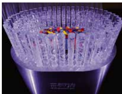
Trofej pro vítězný kontinent.

„Každá ze 116 křišťálových tyčí byla vytvářena na sklářské píšťale a je originálem. Český křišťál na vítězné trofeji symbolizuje čistotu, křehkost a výjimečnost,“ vysvětlil Jaroslav Kolářek. „Středovou plochu dále tvoří kovová platforma s vygravírovaným