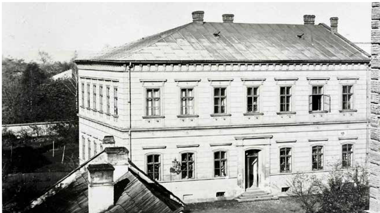
Budova hlavní školy v Zámecké ulici v Moravské Ostravě postavená v letech 1868 – 1869 a přestavěná v 80. letech 19. století.

vině 19. století stal též jednou z priorit komunální politiky ostravského regionu. Školská otázka byla v programu všech politických spolků a stran, českých, německých i polských. Potřeba gramotných dělníků byla palčivě pocítována vedoucími manažery velkých ostravských průmyslových podniků. Početná skupina haličských migrantů žijících v Ostravě a okolních obcích, pracujících v dolech a hutích, vykazovala velmi vysokou negramotnost a tato skutečnost se negativně odrážela v jejich pracovních schopnostech