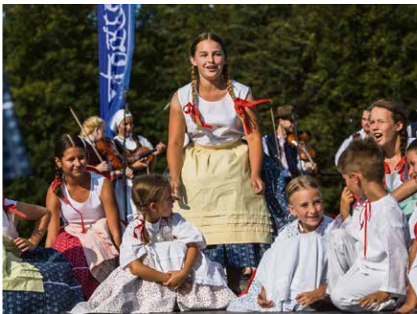
Ostravský soubor Krasničanek sklídil během svého vystoupení v Porubě velký úspěch.

ní v ostravských ulicích, na náměstích a také v domovech pro seniory a v domově Čtyřlístek. Festival vyvrcholil závěrečnou přehlídkou na Slezsko-ostravském hradě. (r)