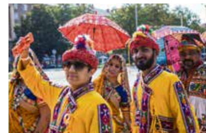
Exotiku přivezli Indové.