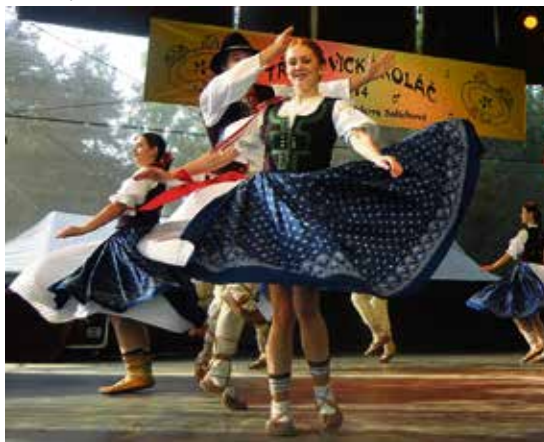
Tanečníci na Třebovickém koláči.

společností Jitřenka a Sluníčko z Ostravy a Berani z Těškovic. K vidění bude i zvířecí farma a ukázka sokolnictví. Pořadatelem slavnosti je Slezský soubor Heleny Salichové. (hob)