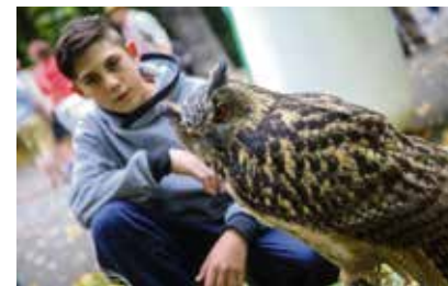
Festival potěší milovníky přírody.

Vstup na Festival dřeva v Ostravě je zdarma. (rs)