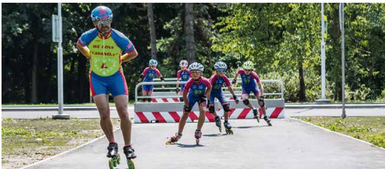
In-line bruslaři využívají nově otevřenou část areálu.