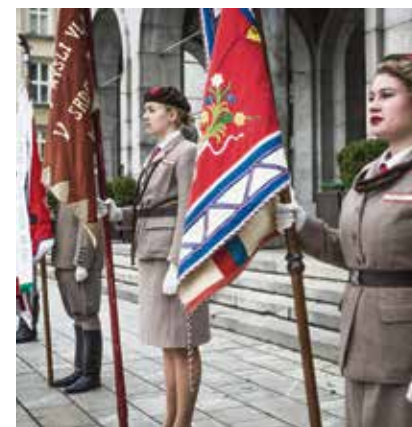
Sokolské prapory před Novou radnicí.