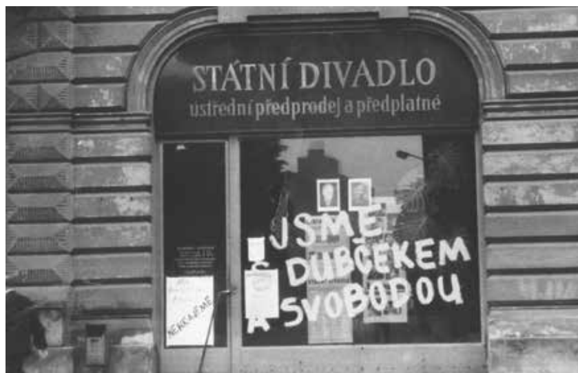
Nápisy odsuzující okupaci ve výkladci předprodeje vstupenek Státního divadla Ostrava v ulici Čs. legií.