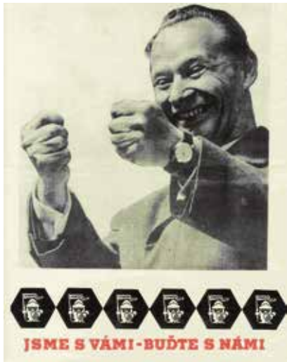
Jeden z plakátů s tváří Alexandra Dubčeka.

20. srpen 1968 byl pro většinu Ostravanů všední den jako kterýkoli jiný. Přípravovalo se rovněž číslo deníku Nová svoboda, které mělo vyjít příští ráno. Na poslední straně se však obje-