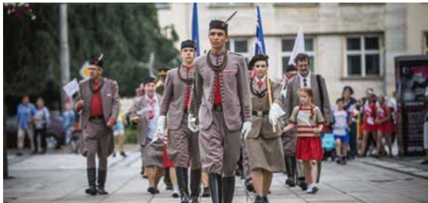
Průvod na Prokešově náměstí.

lovnou a dočkali se ovací diváků. Tyto skladby zacvičili na 16. Všesokolském sletu, který se konal první červencový víkend v Praze. (r)