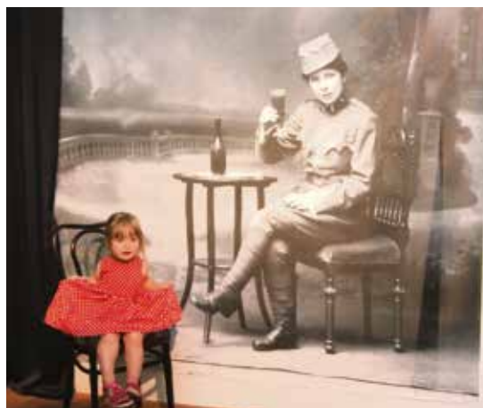
Je libo snímek?

braných fotoateliérů činných v Ostravě v dobách první republiky. Zlatým hřebem vernisáže byl křest reprintu historicky první ryze fotografické publikace Moravská Ostrava, kterou vydal v roce 1928 vlastním nákladem ostravský fotograf Karel Hůlek mladší. Knihu připravil u příležitosti 10. výročí vzniku Československa a 100. výročí založení Vítkovických železáren. Její současný reprint je motivován 100. výročím vzniku republiky. (bk)