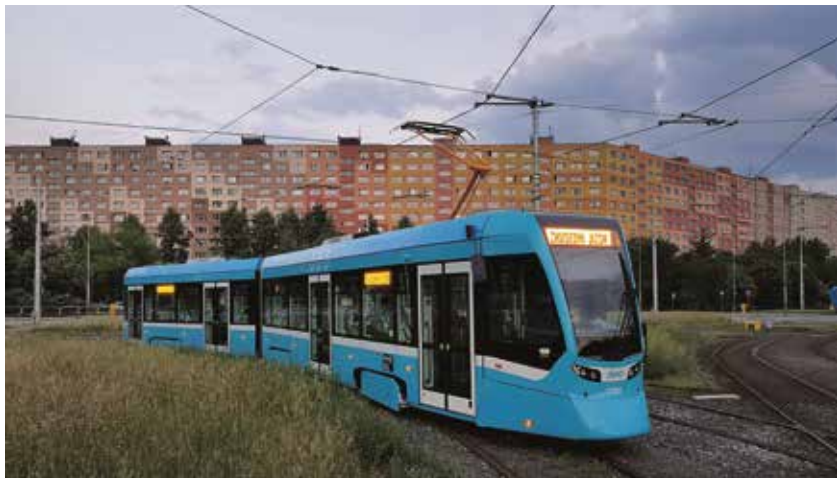
Tramvaj Stadler nOVA během zkušební jízdy.