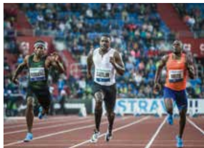
Prvenství na stometrové trati vybojoval Američan Justin Gatlin.

Atletický mítink Zlatá tretra se konal na Městském stadionu Ostrava již po sedmapadesáté. V 16 disciplínách nabídl divákům 10 mistrů světa z posledního šampionátu v Londýně a desítky medailistů z olympiád, mistrovství světa a Evropy.