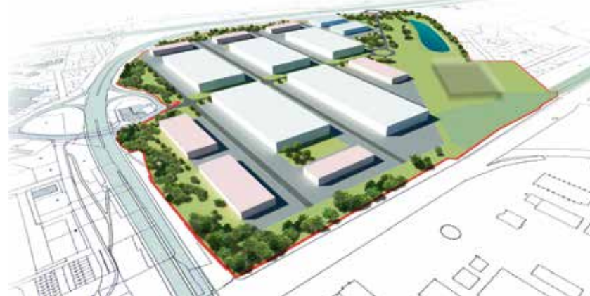
Vizualizace hrušovské zóny.