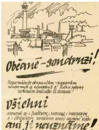
Plakáty rozšiřované v Ostravě po začátku okupace 21. srpna 1968.

Psal se předposlední týden letních prázdnin roku 1968. Demokratizační proces tzv. Pražského jara byl v plném proudu také v Ostravě. Zdálo se, že postupující liberalizaci nelze zastavit.