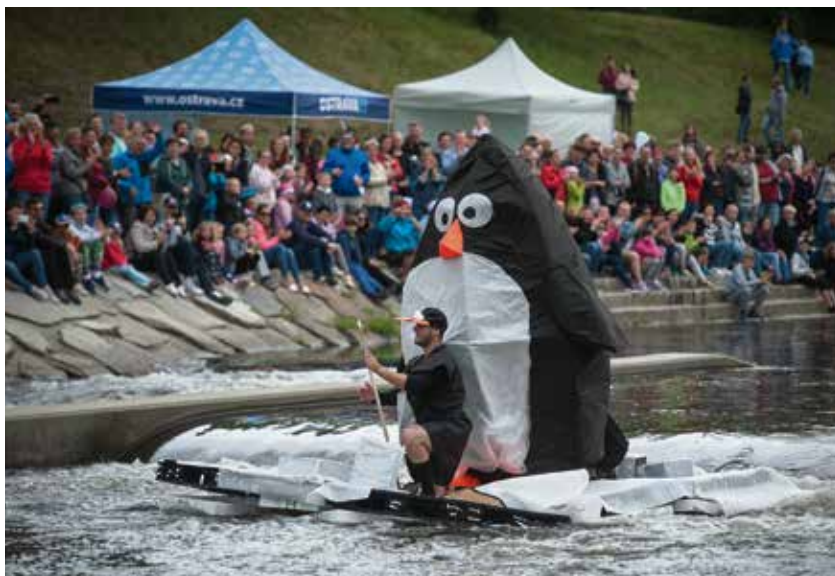
Tučňáci získali nejvíce hlasů u porotců.