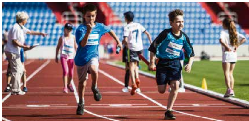
Školáci základních škol závodili ve štafetě 4x200 metrů.

stupně měli na programu štafetu na 8x 200 metrů. Studenti středních škol závodili ve štafetě na 4x 400 metrů. Do superfinále postoupily pouze vítězné štafety jednotlivých kontinentů jak v kategorii dívek, tak i mezi chlapci. Děti i studenti získali pěkné ceny z kolekce Kontinentálního poháru a mohou se těšit na září, kdy přijdou na stadion buď fandit svým spolužákům a mistrům a vicemistrům jednotlivých kontinentů nebo přímo závodit v předprogramu velkého atletického závodu plného atletických hvězd. (r)