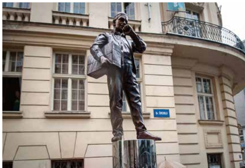
Plastika Karla Kryla před budovou rozhlasu.

Celé znění podmínek pro poskytnutí dotace je k nahlédnutí na www.ostrava.cz v sekci dotace a na http://fajnova.cz/projekt/fajnovyprostor/ . (red)