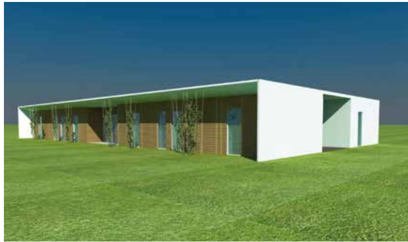
Vizualizace nového bydlení pro klienty Čtyřlístku.

klientů Čtyřlístku. Celkové náklady pro obě etapy jsou odhadovány na 270 milionů korun, z toho spolufinancování z fondů EU bude činit více než 230 milionů korun. (av)