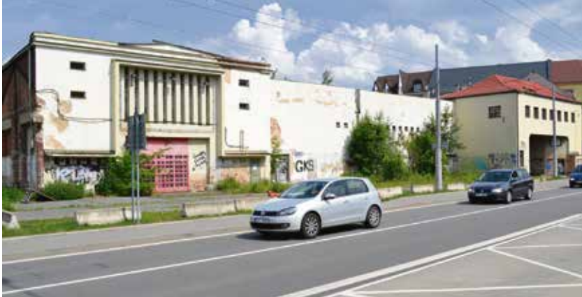
Budovy přístavby městských jatek, v nichž vznikne Mezinárodní kulturní centrum.

Budova přístavby jatek se skládá z šesti různých konstrukčních systémů navzájem stavebně propojených s výměrou 5035 m 2 . Vykoupena byla za 37,95 milionu korun. Výměra sousedních památkově chráněných historických jatek, ve kterých bude působit galerie Plato, činí 20 381 m 2 . (rs)