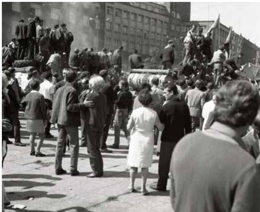
Občané před Novou radnicí pokoušející se diskutovat se sovětskými vojáky.