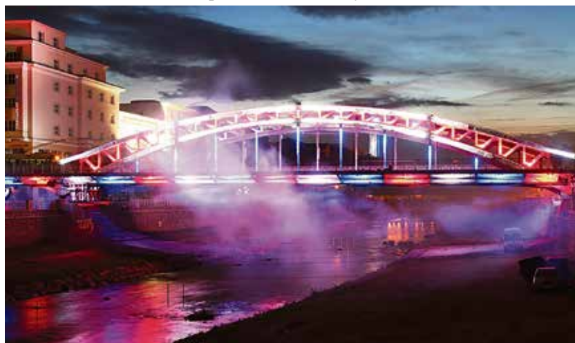
Sýkorův most se rozsvítil na závěr Rozmarných slavností řeky Ostravice.

díla je 3,29 milionu korun bez DPH. Součástí zakázky jsou antivandal kryty, které ochrání světla před krádeží, poškozením a také před povětrnostními vlivy. (rs)