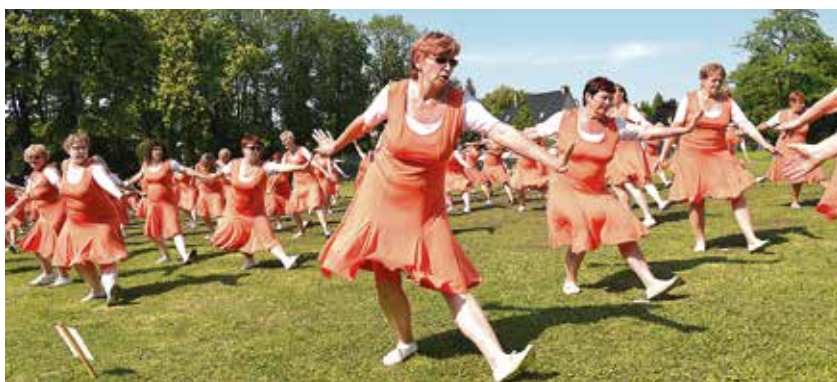
Ženy předvedly svou skladbu na hřišti za Čapkovou sokolovnou.